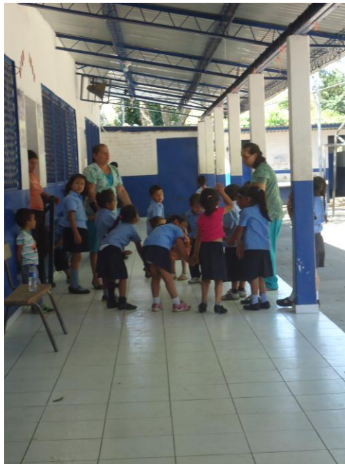
Centro Escolar Doctor Rafael Severo López