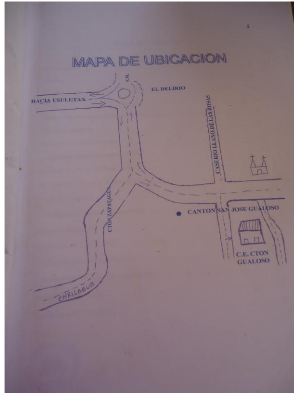
Croquis para poder llegar a "Centro Escolar Cantón San José Gualoso"