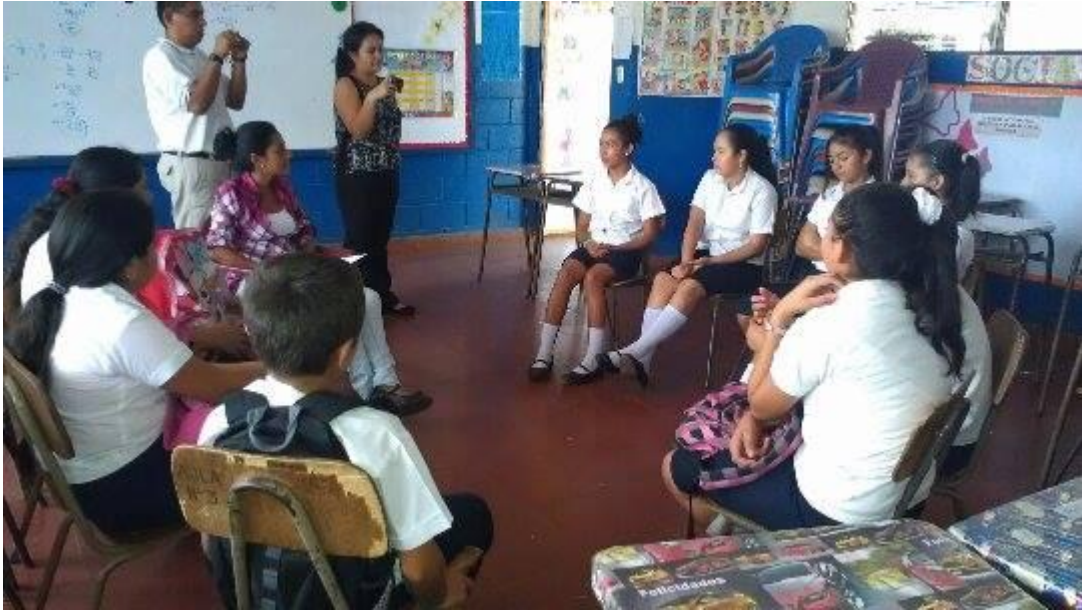
Grupo focal "Centro Escolar: Cantón San José Gualoso"