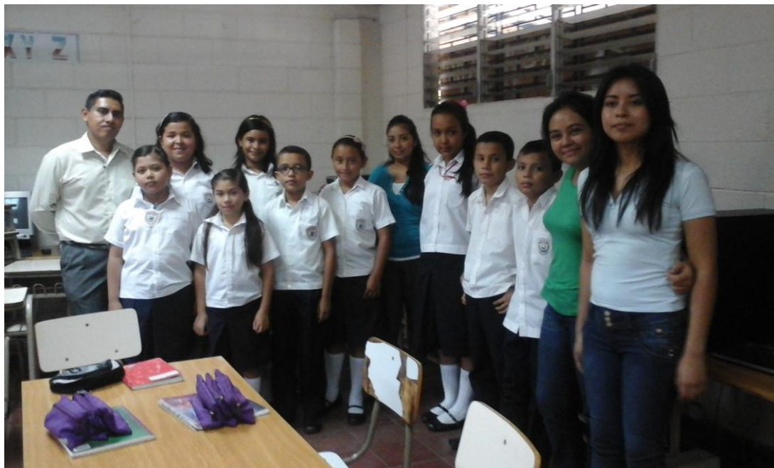
Grupo focal "Centro Escolar: Ingeniero Antonio Mejía"