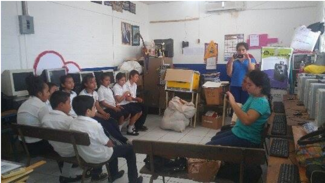
Grupo focal "Centro Escolar: Doctor Rafael Severo López"