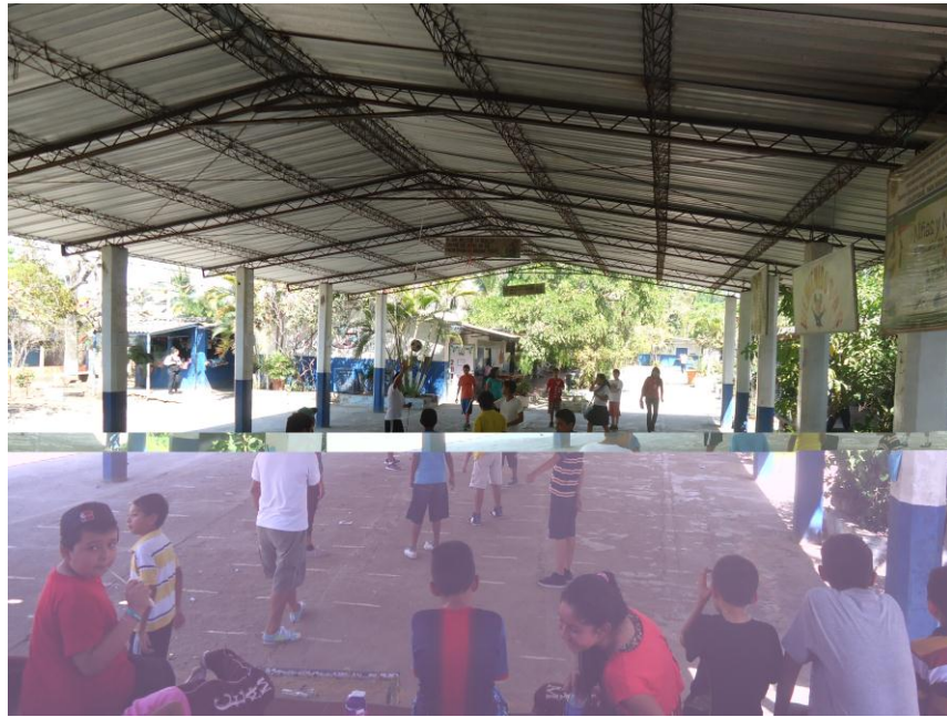
Centro Escolar Ingeniero Antonio Mejía