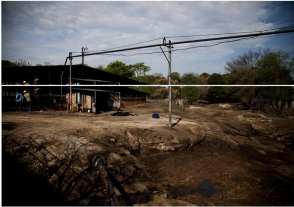
Empleados del ingenio La Magdalena limpian la pila de melaza que rebalsó el 5 de mayo y contaminó más de ochenta kilómetros a lo largo de cuatro ríos en el occidente de El Salvador, fronterizo con Guatemala.