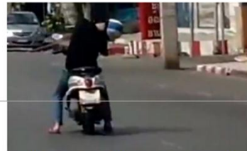
VIDEO: Captan a sujeto conduciendo una moto totalmente dormido