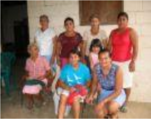
GRUPO DE MUJERES ENCARGADAS DEL PROYECTO COMUNAL DEL BORDADO DE ARCATAO, TOMADAS EL 30 DE MAYO 2008