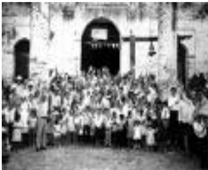
FELIGRESES REUNIDOS FUERA DE LA IGLESIA ANTIGUA DEL MUNICIPIO DE ARCATAO, (DONADA POR UN INFORMANTE DE LA COMUNIDAD)