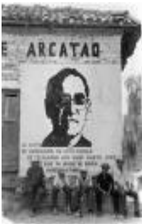
FOTOGRAFÍA UBICADA FRENTE AL CONVENTO PARROQUIAL DE ARCATAO (DONADA POR INFORMANTE DE LA COMUNIDAD)