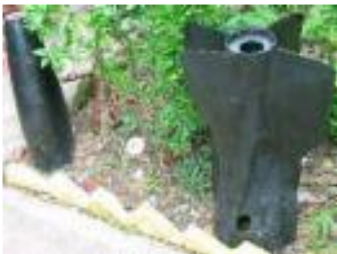
ESQUIRLAS DE BOMBAS QUE UTILIZABA EL EJÉRCITO EN LA GUERRA, SE ENCUENTRA EN EL CENTRO DE FORMACIÓN MARTIRES DE SUMPUL ARCATAO (PROYECTO DE MUSEO) TOMADA EL 31 DE MAYO 2008