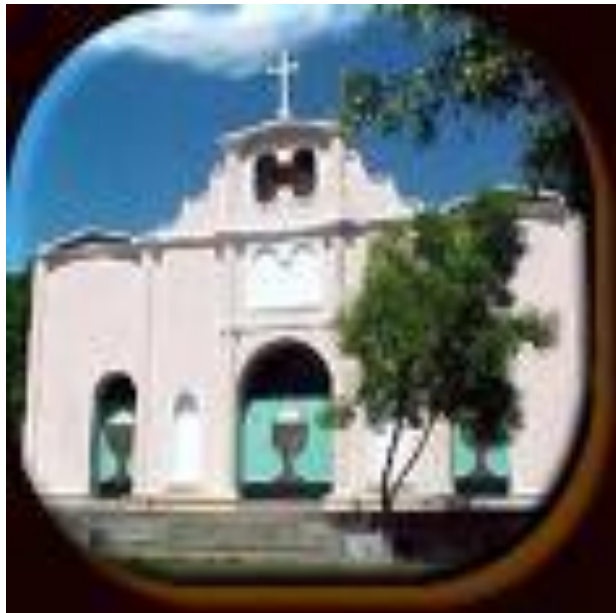
IGLESIA ACTUAL DEL MUNICIPIO DE ARCATAO TOMADA EL 31 DE MAYO 2008