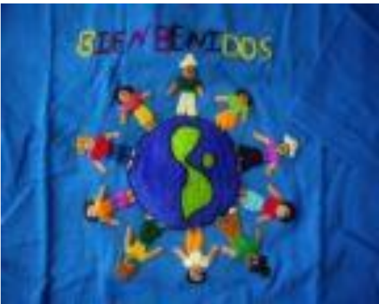
MUESTRAS DEL TRABAJO QUE REALIZAN