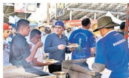
Los salvadoreños prepararon platillos propios del país y los degustaron en familia.

PATROCINADORES Más de este número de empresas patrocinó las festividades patrias que los salvadoreños celebraron a lo grande en Maryland, Estados Unidos.