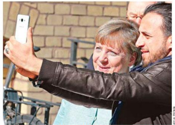
Integración. La canciller alemana, Ángela Merkel, fue recibida con aplausos ayer durante su visita a centros de refugiados, donde incluso posó con ellos para tomarse selfies.

SOLUCIÓN REPRESENTANTES DE LA UE Y LA ONU SE REUNIERON PARA ACELERAR SOLUCIÓN AL CONFLICTO EN SIRIA POR EL QUE MILES HUYEN Y BUSCAN ASILO.