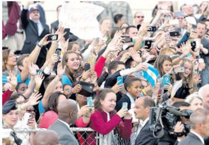
Decenas de católicos asistieron a recibir al Pontífice a la base aérea de Andrews, en Maryland.

A medida se acercan las horas para que comiencen los desplazamientos del papamóvil por las calles de Washington, los cordones de seguridad se han ido ampliando especialmente en los alrededores de la Casa Blanca hacia la Avenida Constitución, así