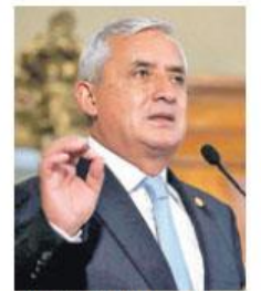
Otto Pérez Molina, exgobernante de Guatemala.

El exgobernante, preso por corrupción, quiere en su celda una televisión, oasis, computadora y una refrigeradora.