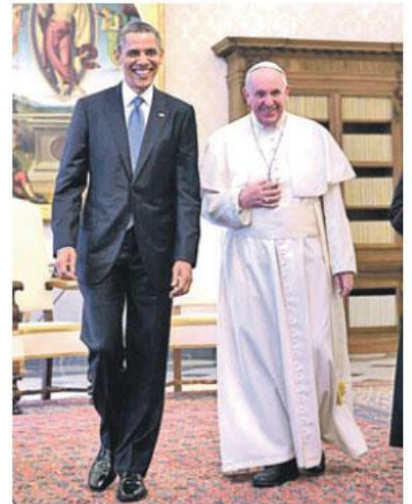
El Papa Francisco será recibido por el presidente de EE. UU. Barack Obama apenas baje del avión papal.