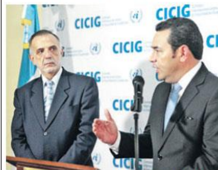
El presidente electo de Guatemala, Jimmy Morales (d), habla con el jefe de la Cicig, Iván Velásquez (i).