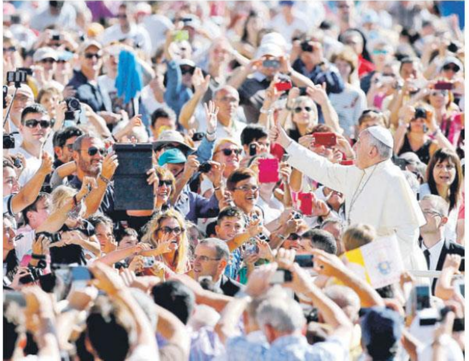
Aunque el Pontífice suele portar una “agenda hermética”, se espera que pronuncie palabras de apoyo a los inmigrantes.

“Para mí es muy importante (este viaje a EE. UU.) para encontrarlos a ustedes, a los ciudadanos de EE. UU. que tienen su historia, su cultura, sus virtudes, sus alegrías, sus tristezas, sus problemas como toda la gente”, expresó el pa-