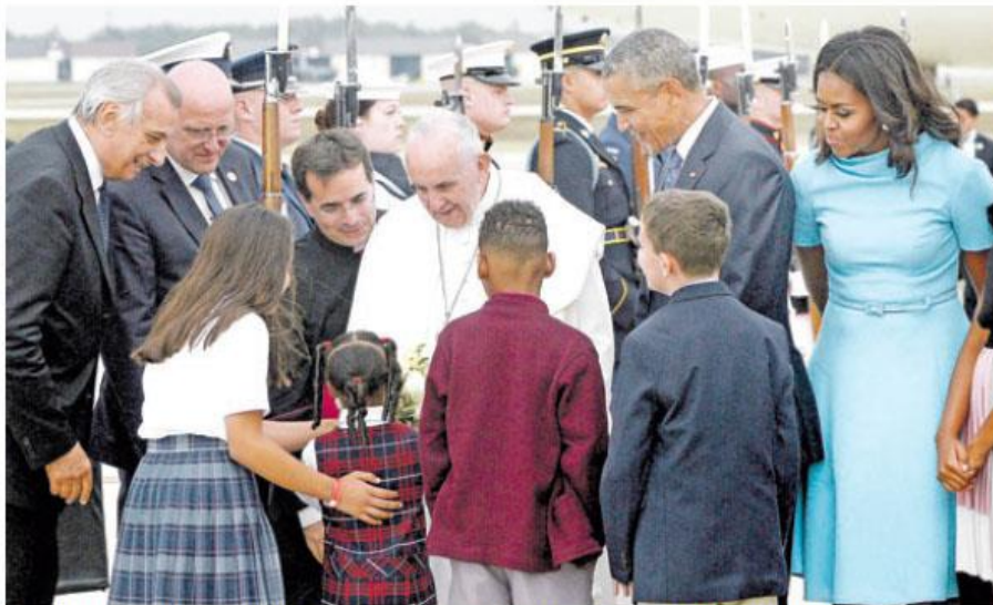
El Santo Padre (c) acompañado del presidente estadounidense, Barack Obama (c-d), saluda a un grupo de niños.