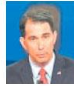
JEB BUSH, HABLANDO SOBRE SU ESPOSA MEXICANA

“No necesitamos un aprendiz en la Casa Blanca (Donald Trump). Ya tenemos uno (el presidente Barack Obama)”.