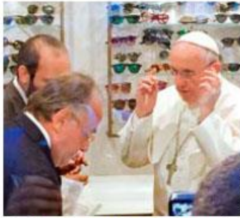
Gira. El papa Francisco tendrá este mes una gira que lo llevará a Cuba y Estados Unidos.