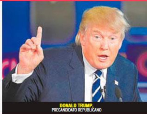
DONALD TRUMP, PRECANDIDATO REPUBLICANO

“Tenemos un país de leyes y se deben ir (los indocumentados), y volverán si pueden volver... Esto se hará de buena gestión y corazón”.