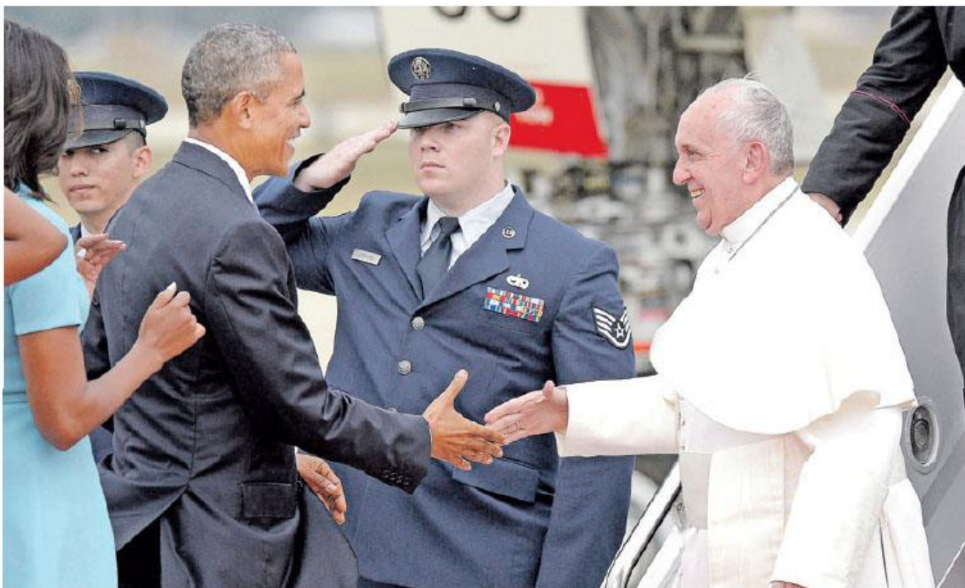
El presidente de los Estados Unidos, Barack Obama (l), recibe al Papa Francisco (d) ayer, en la base aérea de Andrews, Maryland. La visita del Pontífice se extenderá hasta el domingo.