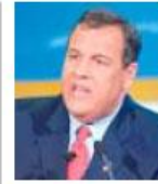
SCOTT WALKER, GOBERNADOR DE WISCONSIN

“Al trabajador de la construcción que no tiene trabajo no le importan sus carreras (de Trump y Fiorina)”.