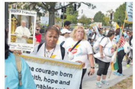
La marcha desde la Basílica de la Inmaculada Concepción hasta la plaza frente a la Casa Blanca pide al Papa pronunciarse por los inmigrantes.