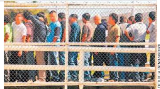
Regreso. Salvadoreños llegan a su país deportados desde Houston. La cifra de deportaciones en el año fiscal 2015 tendrá un descenso, según datos de EUA.

Para 2015, Johnson anticipó "menos deportaciones y más porcentaje de deportaciones de criminales", de acuerdo con las nuevas prioridades que el presidente de EUA, Barack Obama, anunció en noviembre de 2014 para que fueran expulsados del país los criminales y no