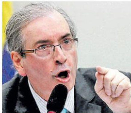
Eduardo Cunha, presidente de la Cámara de los Diputados de Brasil.

Cunha es hasta la fecha el político de mayor rango investigado en la Operación Lava Jato (Operación Limpieza), que pretende desarticular la trama de desvío de cientos o incluso miles de millones de dólares desde Petrobras a partidos políticos, empresarios e