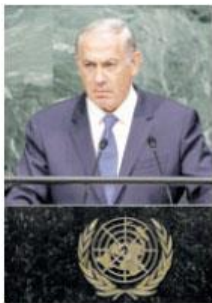
El primer ministro de Israel, Benjamin Netanyahu.