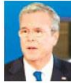
BEN CARSON, PRECANDIDATO REPUBLICANO

“Ella es estadounidense por elección y, como yo, defiende una mayor seguridad fronteriza”.