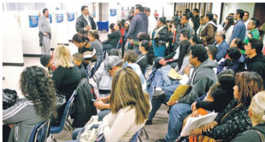
Salvadoreños acuden al consulado de El Salvador en Los Ángeles, para tramitar la reinscripción al TPS.