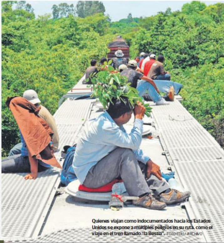
Quienes viajan como indocumentados hacia los Estados Unidos se exponen a múltiples peligros en su ruta, como el viaje en el tren llamado "la Bestia".