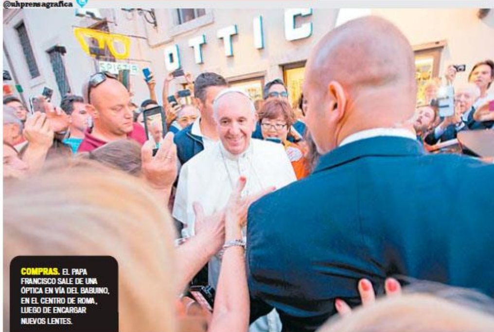
COMPRAS. EL PAPA FRANCISCO SALE DE UNA ÓPTICA EN VÍA DEL BABUINO, EN EL CENTRO DE ROMA, LUEGO DE ENCARGAR NUEVOS LENTES.