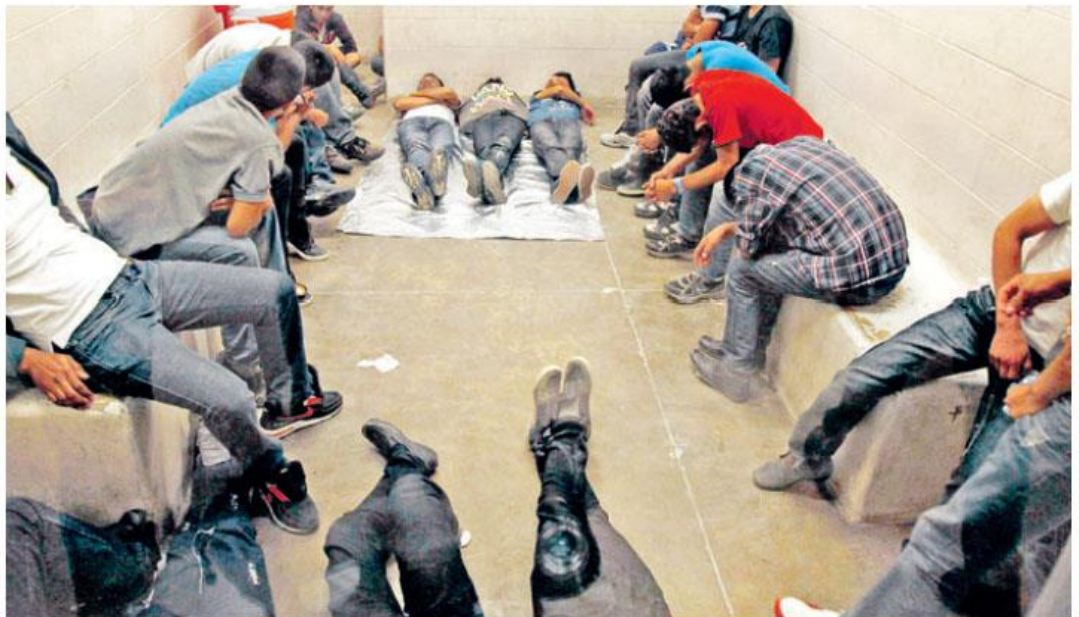
Miles de niños salvadoreños se mantienen detenidos y atendidos en México, intentaban reunirse con sus padres.

Para los representantes de las organizaciones, las cifras de deportaciones y detenciones de menores de edad en las