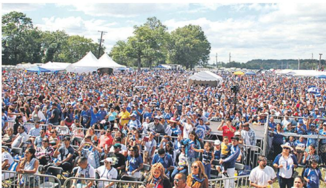
Cientos de salvadoreños asistieron Festival Salvadoreñísimo para celebrar las fiestas de Independencia y poner en alto el nombre del país.

de festivales que le reencuentran con el país a la distancia. "Es mi día libre y uno viene a pasar un buen rato aquí, siempre se encuentra a más de algún amigo y conocidos y luego a empezar otra vez la semana de puro trabajo", comentó este salvadoreño residente en Virginia, mientras espera en la cola por una carne asada de un conocido restaurante salvado-