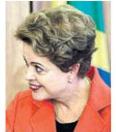
Dilma Rousseff, gobernante brasileña.

Entre 2005 y 2010, ella presidió el consejo administrativo de la petrolera estatal.