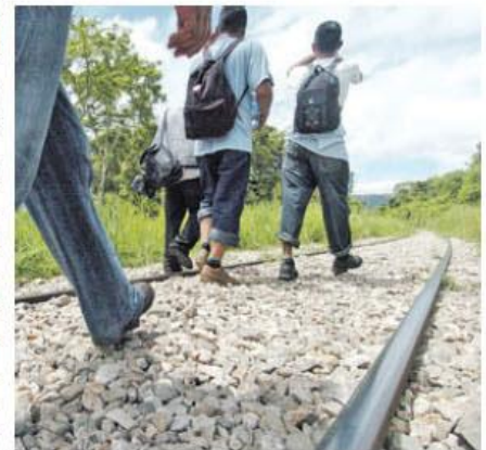
En El Salvador se carece de programas de protección para los niños y adolescentes retornados de México.

El incremento entre 2013 y 2014 se produjo, sobre todo, por el gran número de familias y niños no acompañados que cruzaron de forma ilegal la frontera por la zona del Valle del Río Grande (sur de Texas), huyendo de la violencia en sus países de origen, principalmente El Salvador, Guatemala y Honduras.