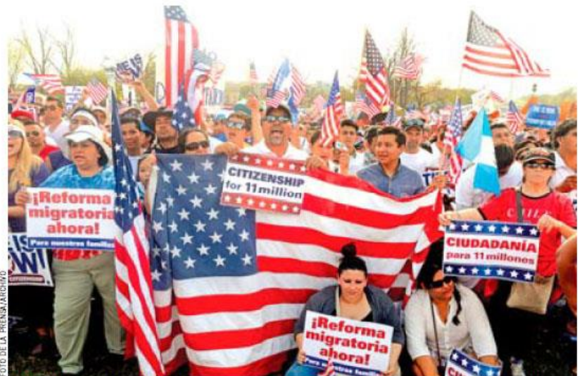
RESPALDO. GRUPOS PROINMIGRANTES APOYARON AYER LA DECISIÓN DE LLEVAR CASO A CORTE SUPREMA DE EUA.

FIRMA. HACE CASI UN AÑO BARACK OBAMA FIRMÓ LOS DECRETOS MIGRATORIOS A BORDO DEL AIR FORCE ONE, CUANDO SE DIRIGÍA HACIA LAS VEGAS, NEVADA.