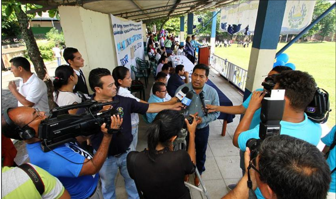
Cierre del mes cívico con autoridades de Ministerio de Educación y el alcalde de Apopa Elías Hernández.