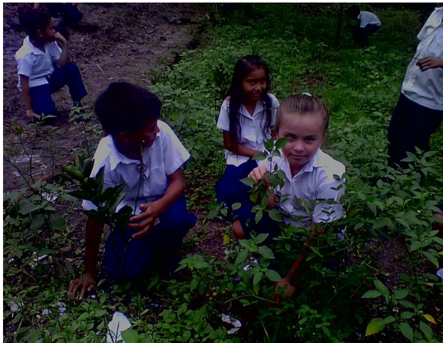
ESTUDIANTES DEL CENTRO ESCOLAR CANTÓN LA PUEBLA