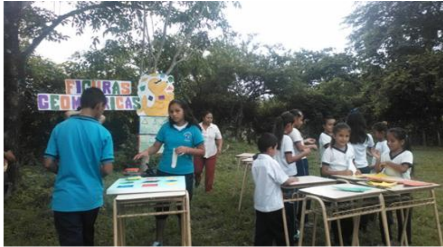
Proyecto Acción Educativa