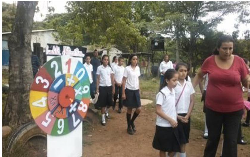
Proyecto Acción Educativa