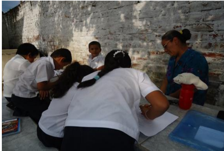
ESTUDIANTES DEL CENTRO ESCOLAR NATALIA LÓPEZ, año 2014