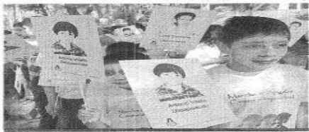
Día del Desaparecido Miembros de Pro Búsqueda marcharon ayer a la Asamblea Legislativa para pedir el establecimiento del "día de la niñez desaparecida", en lugar del Día del Reencuentro Familiar.