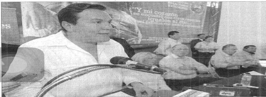
LAMENTÓ. El canciller de la República, Francisco Laínez, a nombre del Gobierno, lamentó la desaparición de niños durante la pasada guerra civil, en los operativos militares del Ejército.