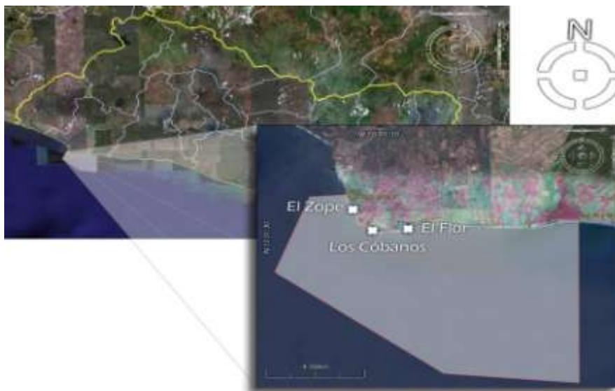
Figura 1. Ubicación del área de estudio con las estaciones de muestreo en las playas: El Zope, Los Cóbanos y El Flor. El polígono indica la propuesta del área natural protegida Los Cóbanos del Ministerio del Medio Ambiente y Recursos Naturales 2006.

Los Cóbanos cuentan con un sistema de arrecife rocoso con asentamiento de coral, el cual presenta características muy singulares dentro de su funcionamiento, algunas de estas particularidades dentro de este ecosistema han sido estudiados (Orellana, 1985; Funes et al , 1989; Castro & Tejada, 1993; Lemus et al , 1994; Molina 1996, Reyes y Barraza, 2003; Molina 2004). Los Cóbanos se localiza a 11 kilómetros al suroeste de Acajutla en el Departamento de Sonsonate, entre los 13° 35' 67" latitud norte y 89° 45' 10" longitud oeste y los 13° 35' 71" latitud norte y 89° 45' 15" longitud oeste, según el Instituto Geográfico Nacional (Lemus et al. , 1994). Este corresponde de Oeste a Este con los límites de la playa El Zope y la playa El Flor (ver fig. 1)