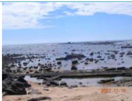
Foto 2: Zona Costera de los Cóbanos antes de ser dragada