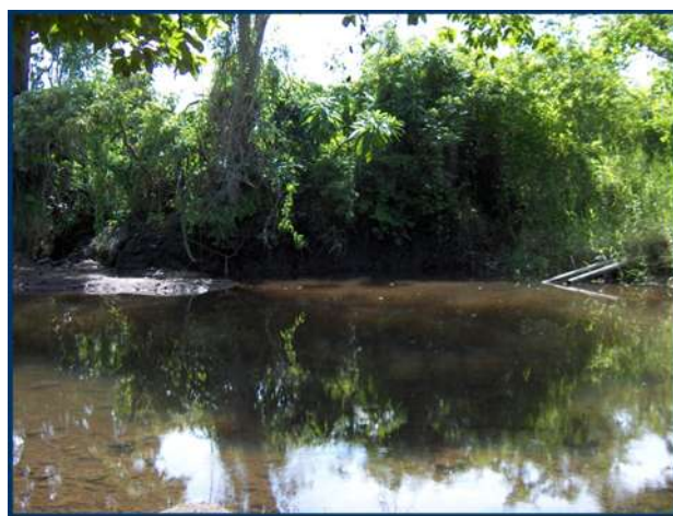
Fotografía 3. Río Las Marías, Los Cóbano 2006

El los pobladores de Punta Remedios tienen una escasez crónica de agua, tanto para riego como consumo humano, tanto que la idea de escasez del recurso forma parte del imaginario sociocultural regional. Los últimos 20 años, los diferentes gobiernos de turno, locales, regionales y nacionales, han difundido la noción que la solución a todos los problemas de acceso y uso al recurso hídrico esta en un proyecto pozos con los cuales se satisfaría las demandas de la zona, y más aun, en su componente agrícola, sería el impulsor del desarrollo económico de la región.