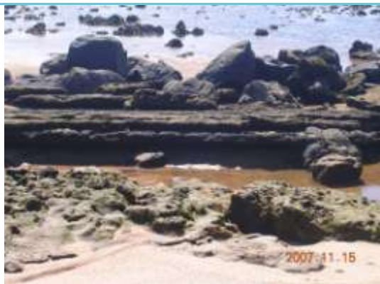
Foto 3: Arrecife rocoso de antes de ser dragado