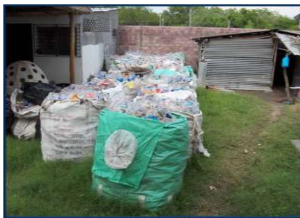
Fotografía 4. Botellas plásticas colectadas en las playas con influencia turística, 2006.

Según ICMARES/UES y FUNZEL (2007), existe un programa de manejo de desechos sólidos enfocado en el reciclaje de plásticos y dirigido por la ONG FundArrecife que en conjunto con habitantes de la comunidad se encargan de la colecta y preparación los plásticos para la planta.