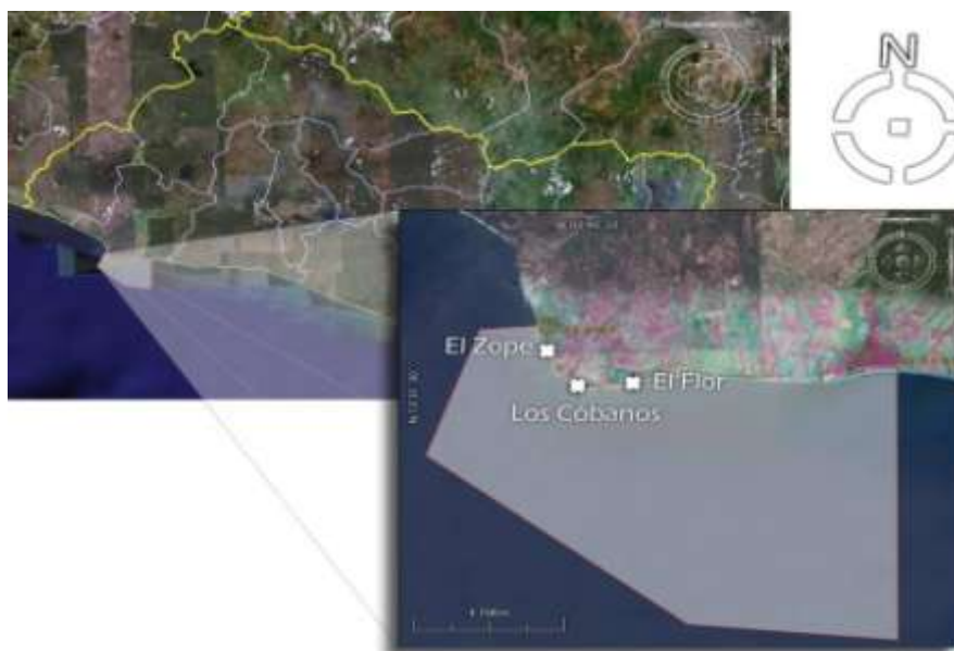
Figura 1. Ubicación del área de estudio con las estaciones de muestreo en las playas: El Zope, Los Cóbano y El Flor. El polígono indica la propuesta del área natural protegida Los Cóbano del Ministerio del Medio Ambiente y Recursos Naturales 2006.

Los Cóbano cuentan con un sistema de arrecife rocoso con asentamiento de coral, el cual presenta características muy singulares dentro de su funcionamiento, algunas de estas particularidades dentro de este ecosistema han sido estudiados (Orellana, 1985; Funes et al , 1989; Castro & Tejada, 1993; Lemus et al , 1994; Molina 1996, Reyes y Barraza, 2003; Molina 2004). Los Cóbano se localiza a 11 kilómetros al suroeste de Acajutla en el Departamento de Sonsonate, entre los 13° 35' 67" latitud norte y 89° 45' 10" longitud oeste y los 13° 35' 71" latitud norte y 89° 45' 15" longitud oeste, según el Instituto Geográfico Nacional (Lemus et al. , 1994). Este corresponde de Oeste a Este con los límites de la playa El Zope y la playa El Flor (ver fig. 1)