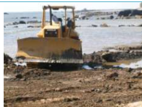
Foto 4: Destrucción de arrecife rocoso