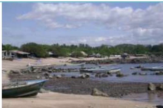
Foto 1: Comunidad de los Cóbanos