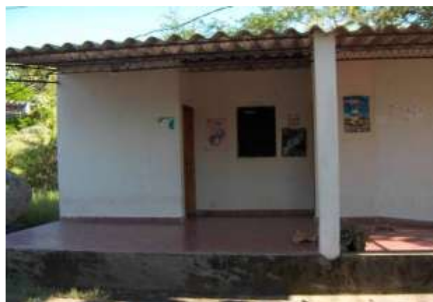
Fotografía 2. Clínica de atención médica AGAPE, Cantón Los Cóbanos, 2006

La atención en salud se lleva cabo a través del MSPAS 21 y de acuerdo al SIBASI, citado por