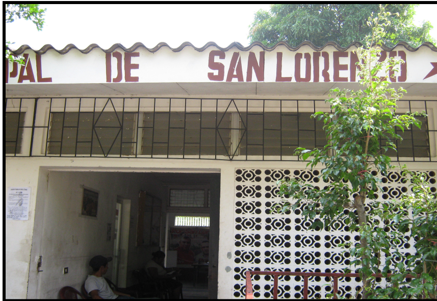
VISTA DEL EDIFICIO MUNICIPAL DE SAN LORENZO.