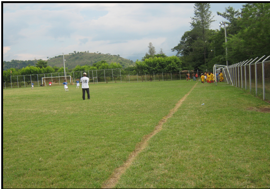
VISTA DE ÁREA DE RECREACIÓN DEL MUNICIPIO