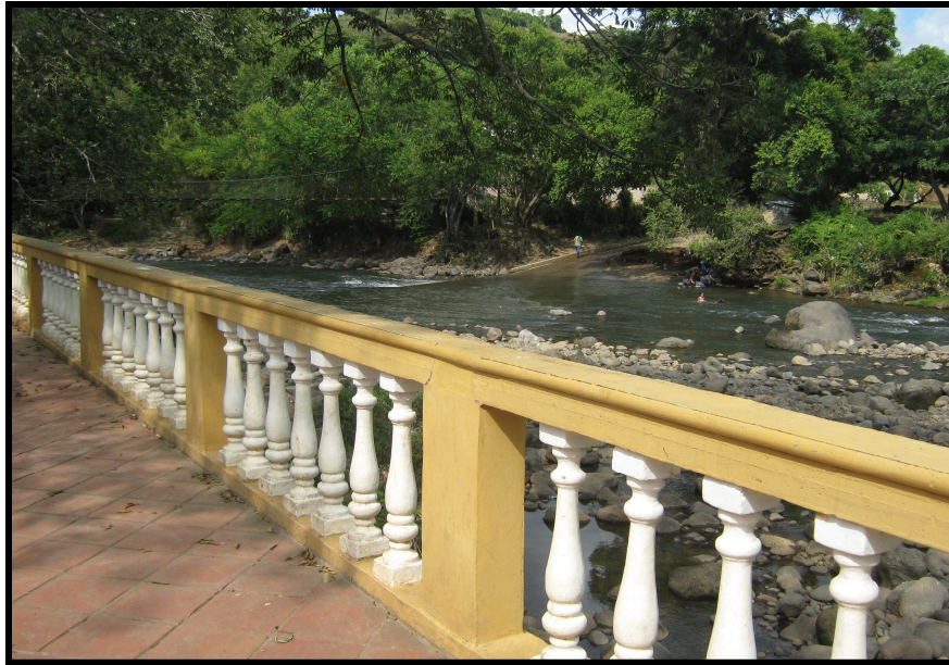
VISTA PANORAMICA DEL RÍO DE SAN LORENZO