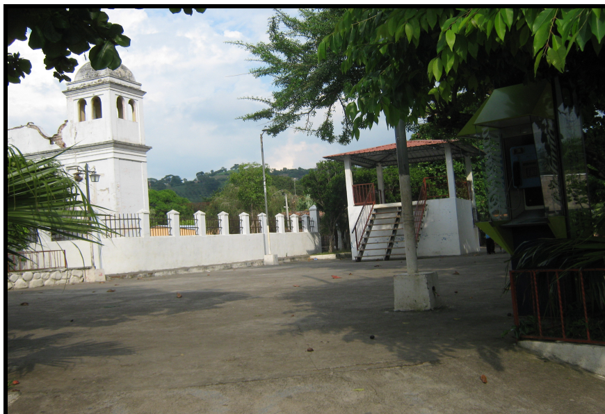
VISTA PANORAMICA DEL PARQUE DE SAN LORENZO E IGLESIA.