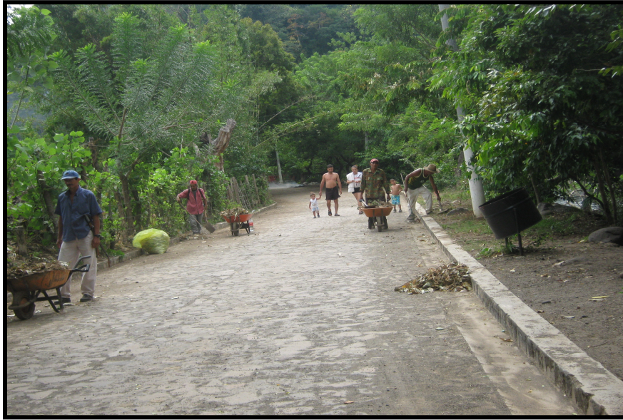
TAREAS DE LIMPIEZA REALIZADAS POR LA COMUNIDAD A DIARIO.