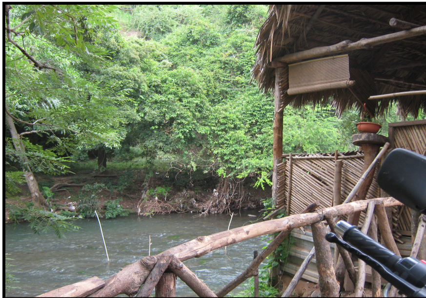
RESTAURANTE CONTIGUO AL RÍO SAN LORENZO.