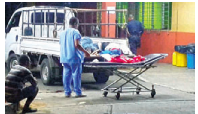
Los jóvenes se dirigían a un baile cuando desde otro vehículo los atacaron con fusiles.

No obstante, algunos policías que llegaron a custodiar la escena al estacionamiento del hospital San Pedro no descartaron que entre los muertos y heridos hubiera