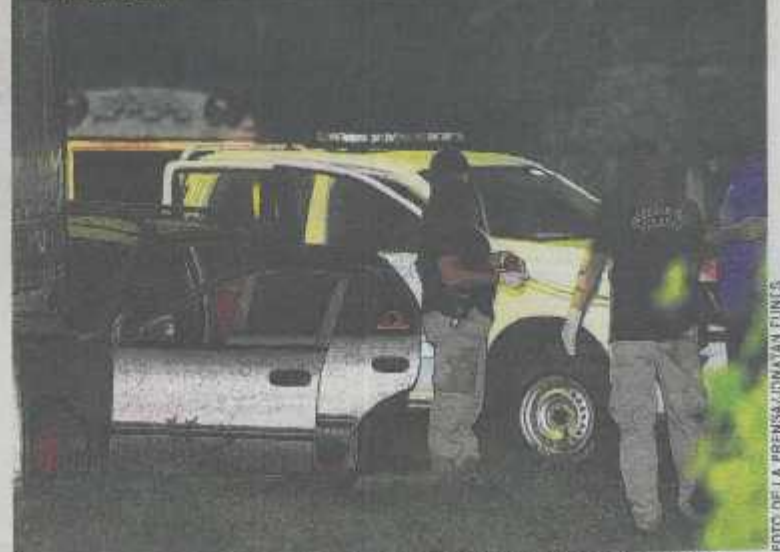
AUTORIDADES PROCESAN ESCENA DE DOBLE HOMICIDIO EN CANTÓN LA CRUZ ARRIBA, CALLE PRINCIPAL A SAN PEDRO PERULAPÁN, CUSCATLÁN. SEGÚN LA PNC, LOS FALLECIDOS ESTÁN EN EL INTERIOR DE UN VEHICULO.