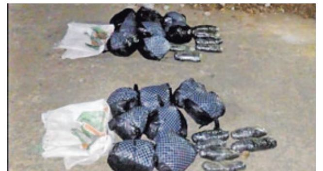
Droga incautada en la frontera La Hachadura a Arteaga Alas.

Ayer por la noche la Fiscalía informó de otro homicidio, en Santa Catarina Masahuat, en Sonsonate. La víctima fue un hombre que fue atacado con arma de fuego.