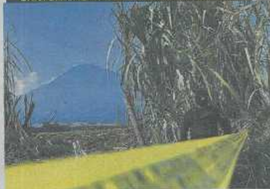
UNA PAREJA FUE ASESINADA EN ESTE MUNICIPIO.