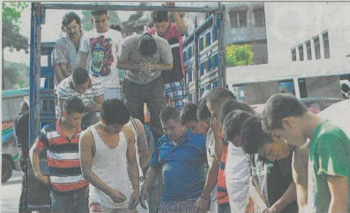
Estructuras criminales. La Fiscalía y Policía han realizado redadas esta semana para capturar a los responsables de extorsionar, asesinar y provocar desplazamientos forzados en diferentes puntos del país.