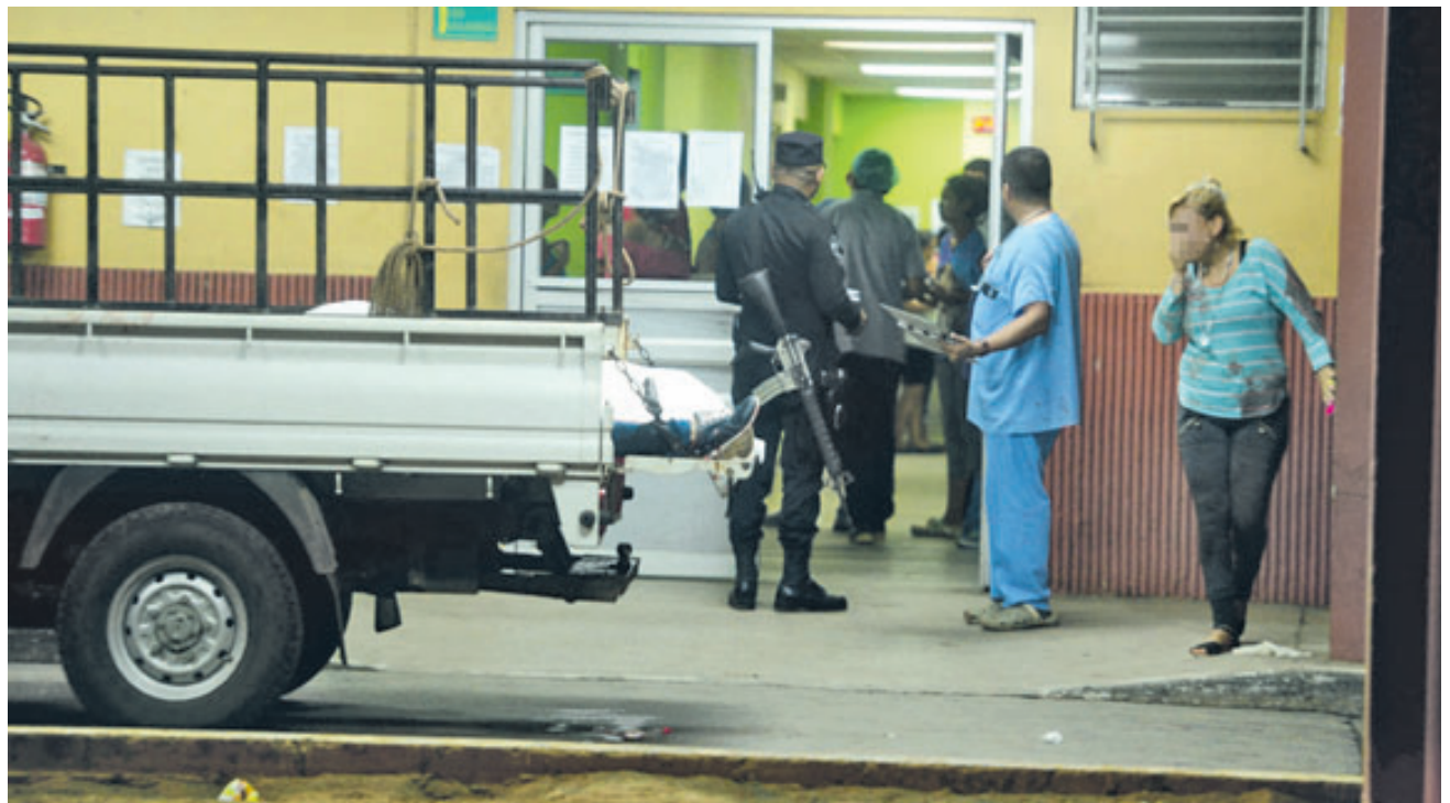
Varios de los lesionados fueron llevado al hospital San Pedro de Usulután. Ahí fallecieron algunos.

La Fiscalía investigó al padraastro de la víctima y determinó que él solía golpear a los dos hijos de su pareja cada vez que lloraban. García está recluido en el penal de Izalco, Sonsonate.