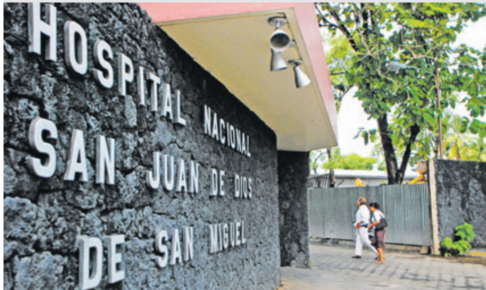
En este hospital fue donde falleció el niño tras haber sido ingresado de emergencia.