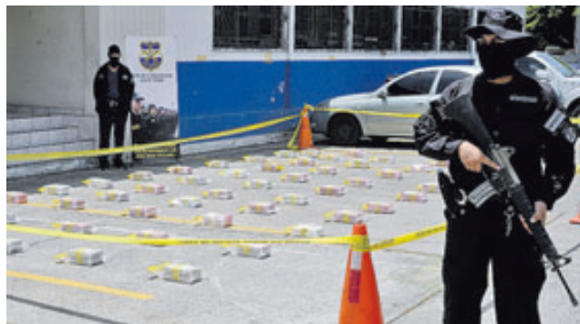
En la mayoría de los decomisos ha habido detenciones de ciudadanos ecuatorianos y colombianos.

En total las autoridades decomisaron 10,626.53 kilos de distintos tipos de droga, equivale a 10.63 toneladas, con un valor económico que asciende a 251 millones 901 mil 34 dólares, en el mercado, según la División Antinarcóticos de la PNC. Desde el 1 de enero hasta el 28 de diciembre la droga más in-