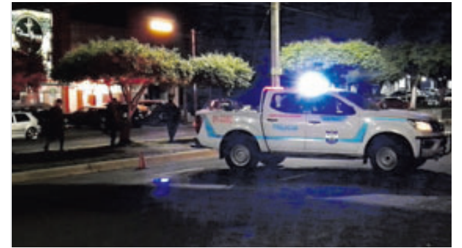
Lugar donde ocurrió el ataque armado provocado por un grupo de hombres.

casa y se miraban las llamas. Lo que hice fue gritar a mi familia y vecinos para sacar al niño, lo cual nos tardamos alrededor de media hora en sacarlo, porque nos tocó romper la ventana y la puerta para poderlo sacar”.