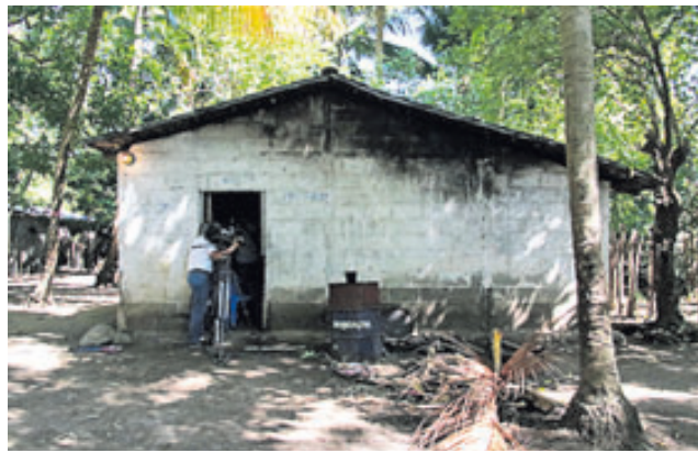
Casa donde fue asesinada la niña el pasado fin de semana.