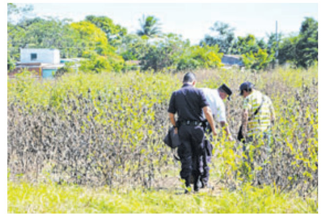
El cuerpo de una persona fue encontrado en la colonia Orellana, Chalchuapa.