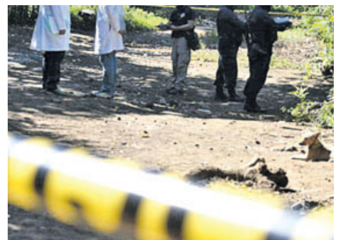
Varios agricultores han sido víctimas de pandilleros en las últimas semanas.

Las autoridades no determinaron el sexo de la víctima ni cómo la mataron.