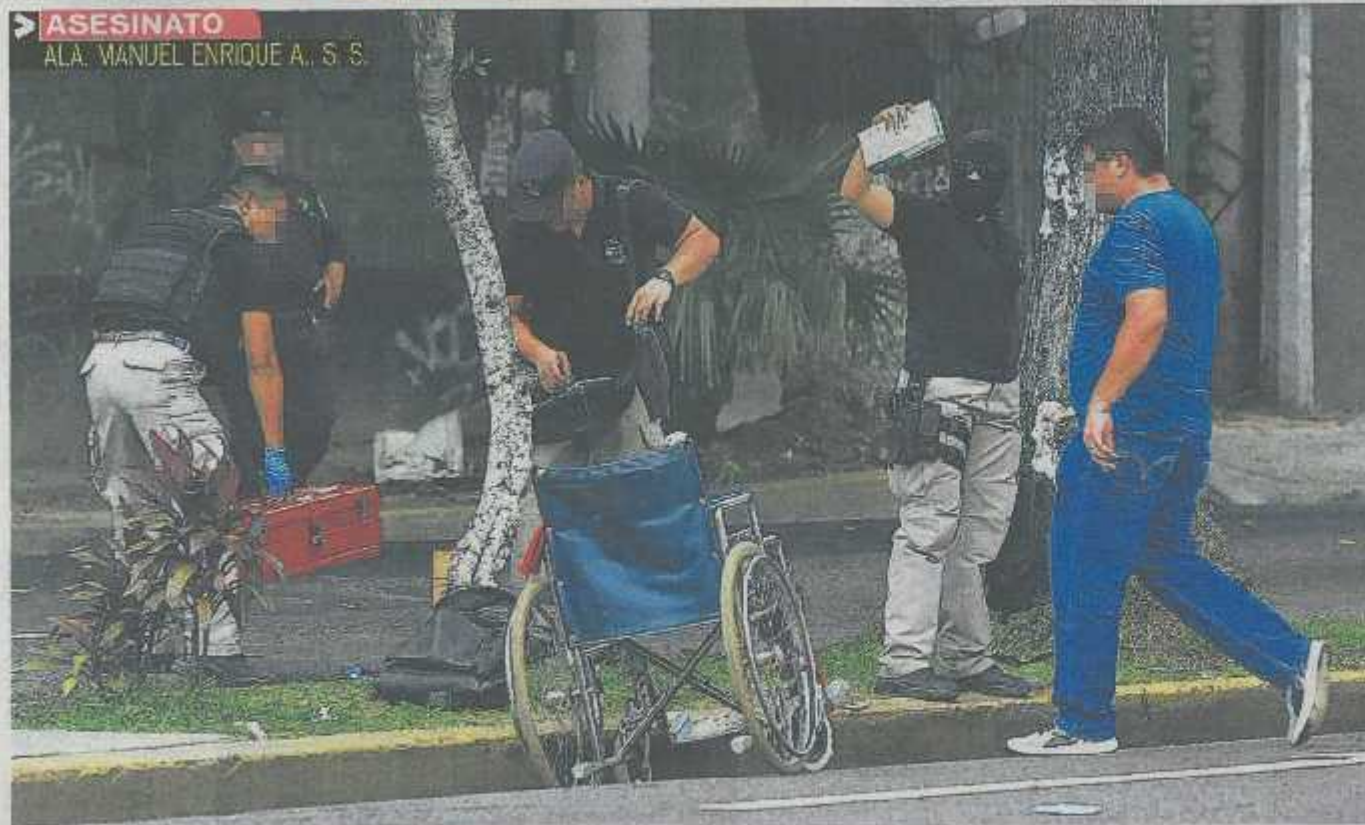
PADRE E HIJO FUERON ASESINADOS AYER POR LA MAÑANA SOBRE LA ALAMEDA MANUEL ENRIQUE ARAUJO. AUTORIDADES INFORMARON QUE ES MUY PROBABLE QUE FUERON ULTIMADOS A CAUSA DE RENCILLAS ENTRE PANDILLAS.