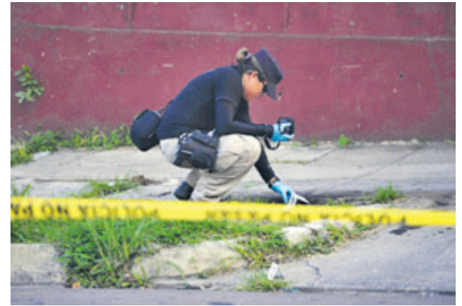
Tres supuestos pandilleros murieron en un tiroteo con policías en el barrio La Cruz, en Jucuapa.

Lo malo de comercializar y consumir la carne de caballo es por la falta de control, autorizaciones legales y medidas higiénicas que se emplean para su procesamiento.