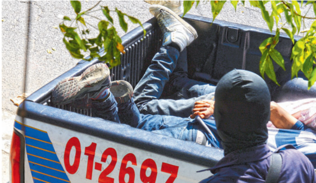
Tras el ataque contra el policía, en el barrio La Vega, dos hombres fueron detenidos para investigarlos.

Tras el ataque, decenas de policías realizaron un operati-