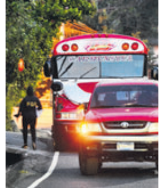
Lugar donde ayer en la tarde fue asesinado un empleado de Centros Penales.

Al ver que los tres delincuentes desvalijaban a los pasajeros sacó su pistola, pero los delincuentes se le adelan-