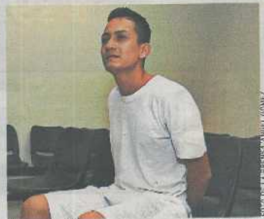
Atraso. La diligencia estaba programada para las 11 de la mañana. A esa hora solo estaban presentes la fiscalía y el imputado.