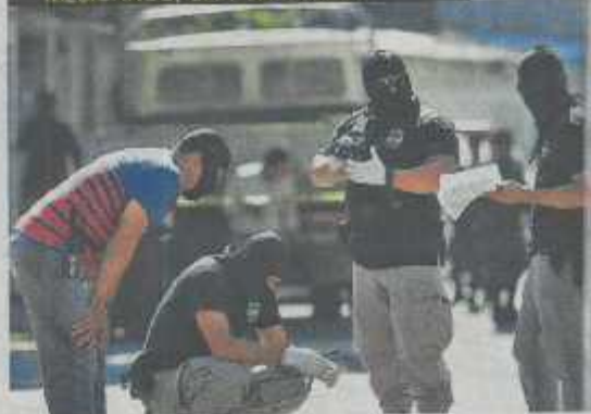
LA PNC ENCONTRÓ EL CADÁVER DE UN HOMBRE ENVUELTO EN SÁBANAS. LA VÍCTIMA NO FUE IDENTIFICADA POR FALTA DE DOCUMENTOS.