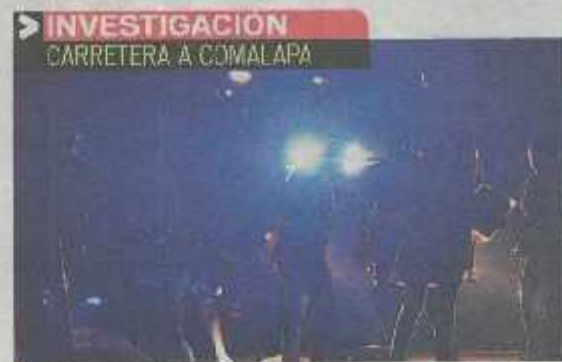
LA PNC ENCONTRÓ EL CADÁVER DE UNA MUJER. INVESTIGAN SI SE TRATA DE UN HOMICIDIO.