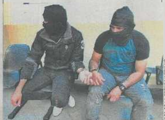
Reforma. Un tribunal vicentino procesa a dos agentes policiales por permitir ingreso de mujeres e ilícitos en bartollinas.

Recientemente, los diputados también aprobaron otra reforma para que los agentes de la PNC, FAES y custodios que en cumplimiento de sus labores realicen una acción en la legítima defensa y que por esta sean procesados puedan mantener los casos bajo reserva, sus identidades y de sus familias.