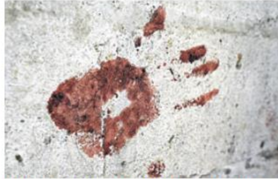
Las huellas de la tragedia estaban por diversos espacios de la humilde vivienda.

A la medianoche, ánimo, se paró junto a la hamaca en la que él estaba acostado y le dijo sonriendo que se durmiera, desde entonces no pudo conciliar el sueño y se despertaba a cada rato. A las 4:00 de