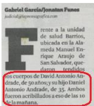
Ilustración 1, 4 DE NOVIEMBRE LPG

En todas las notas se detalló el nombre de la persona que fue asesinada y su edad, y en los casos que no se hizo fue porque se detallaba en la redacción que la víctima no había sido identificada aun por las autoridades.