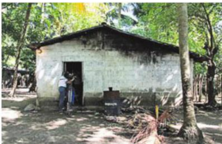
Casa donde fue asesinada la niña el pasado fin de semana.

El tercer recuadro también incumple el artículo 9, ya que detalla cómo sucedió el hecho, aun cuando antes ya se había dicho que el menor había fallecido a causa de una herida ocasionada por su propia madre. Es decir, hasta cierto punto ese párrafo es redundante, porque reafirma algo que ya se dijo en los primeros párrafos de la noticia.