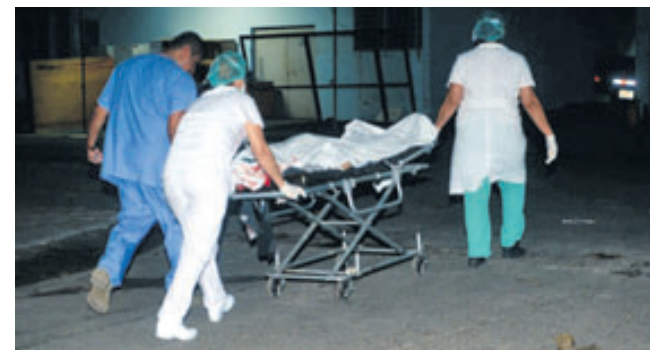
Al menos dos de los lesionados murieron en la entrada al hospital de Usulután debido a gravedad de heridas.

alguno que tuviera vínculos con las maras.