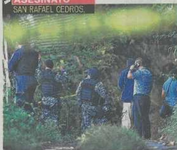
VARIOS PANDILLEROS FUERON SORPRENDIDOS POR LA PNC EN UNA VIVIENDA. LA PNC INFORMÓ QUE HUBO UN TIROTEO Y MURIÓ UNO DE LOS PANDILLEROS.

dad La Fortaleza, contiguo a la escena del crimen.