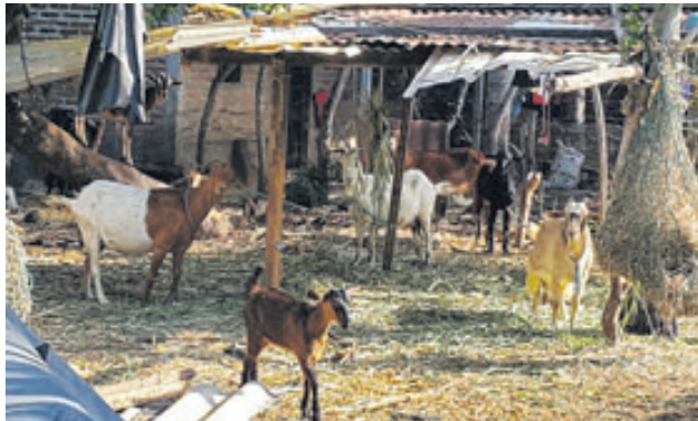
Gerónimo Morales tenía varias cabras, era su fuente de ingreso para mantener a sus tres hijos.

Gerónimo era un buen vecino. Eso dijeron algunos adultos que dijeron conocerlo muy bien. Ellos contaron que la víctima había comenzado con el negocio de la leche de cabra desde hace poco más de un año, cuando se vio obligado a comprar una cabra para alimentar a una de sus hijas que padecía una enfermedad.