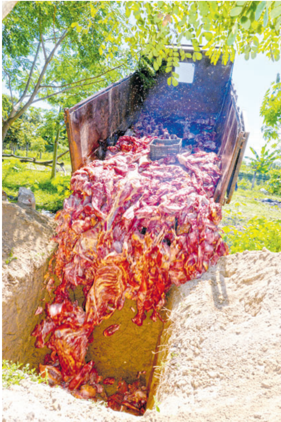
Este ha sido el decomiso más grande de carne de caballo: las autoridades confirman que eran 5,600 libras.

Además de los arrestados, 20 presos más que guardan de-