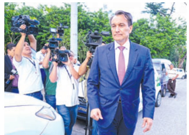
El exministro Atilio Benítez fungía como embajador en Alemania, pero fue desaforado el pasado 5 de diciembre. EDH/ARCHIVO

Ahora está en manos de la Fiscalía presentar una acusación formal ante un tribunal penal contra el exfuncionario para que sea procesado por los delitos que le acusa, los cuales ocurrieron en la época en que se desempeñó como viceministro de la Defensa.