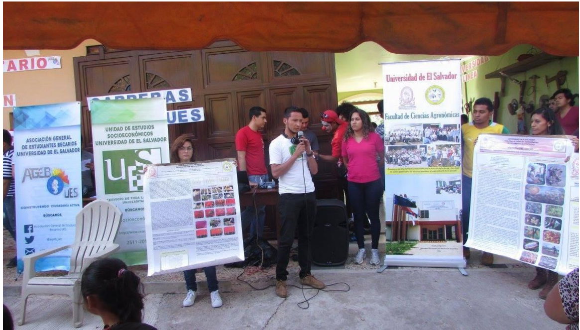
Fuente: Feria de desarrollo comunitario realizada en el municipio de Metapán Santa Ana, fotografía tomada por la Asociación General de Estudiantes Becarios de la Universidad de El Salvador (AGEB-UES) el 19 de diciembre de 2016.