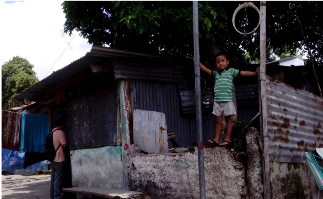
FUENTE: Propia de Estudiantes Egresadas de la Universidad de El Salvador, Asociación Cooperativa de Vivienda por Ayuda Mutua Barrio Concepción, niño jugando en Mesón San Salvador, 20 Julio del 2017.