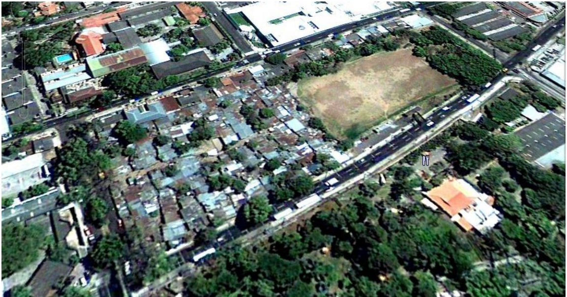
IMAGEN N° 1 COMUNIDAD LA CRUZ Y TERRENO EN DONDE ACTUALMENTE SE CONSTRUYEN LOS EDIFICIOS HABITACIONALES “LA GRAN MANZANA”