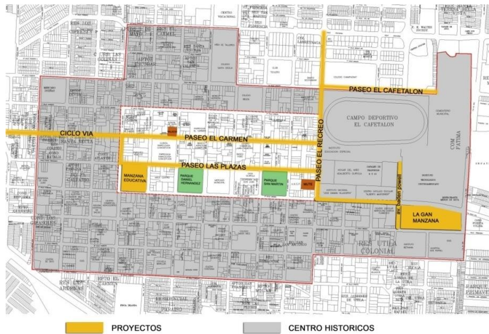
MAPA N° 2 MAPA DE ZONAS INTERVENIDAS DEL CENTRO HISTÓRICO CON LOS PROYECTOS CULTURALES