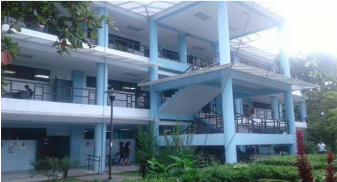
edificio Dagoberto Marroquín