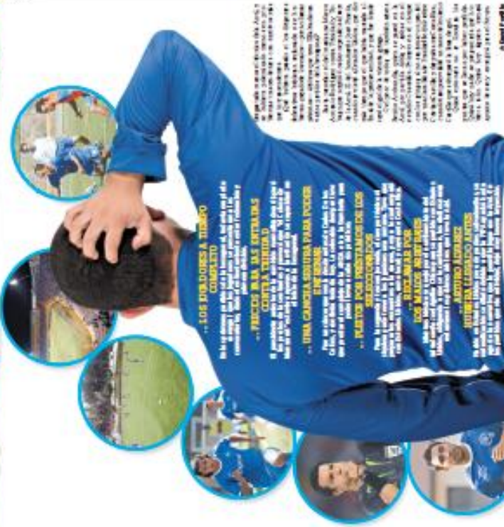
El Once | 5 goles

Si el fútbol argentino hubiera ganado la Copa del Mundo de Fútbol de 2014 en Brasil, ¿qué hubiera pasado? ¿Sería el primer título mundial para el seleccionado nacional? ¿Cómo se sentirían los jugadores y el pueblo argentino? ¿Qué impacto tendría esto en el deporte argentino y en la economía del país? Estas son algunas de las preguntas que nos hacemos en este artículo.