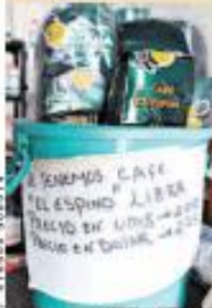
LOS PRECIOS en "Lida" son más bajos que en otros establecimientos.

El municipio usa vales a modo de moneda en unos negocios P. 2 Y 3