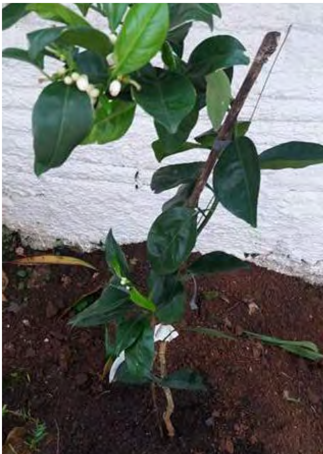
Figura 1 . Apariencia de una de las plántulas frutíferas de cítrico (naranja) comercializadas en floricultura del “municipio de Palhoça”, Grande Florianópolis, estado de Santa Catarina/ SC, transportando inadvertidamente caracoles no-nativos invasores indo-asiáticos Ariophantidae Macrochlamys cf. indica Benson, 1832 (Fotografía: Jefferson Souza da Luz, staff del “Projeto AM”).

Figure 1. Appearance of one of the citrus fruit seedlings (orange) marketed in floriculture of the “Palhoça municipal district”, Great Florianópolis region, Santa Catarina State/ SC, inadvertently transporting invasive non-native indo-asiatic snail Ariophantidae Macrochlamys cf. indica Benson, 1832 (Photography: Jefferson Souza da Luz, staff of the “Project AM”).