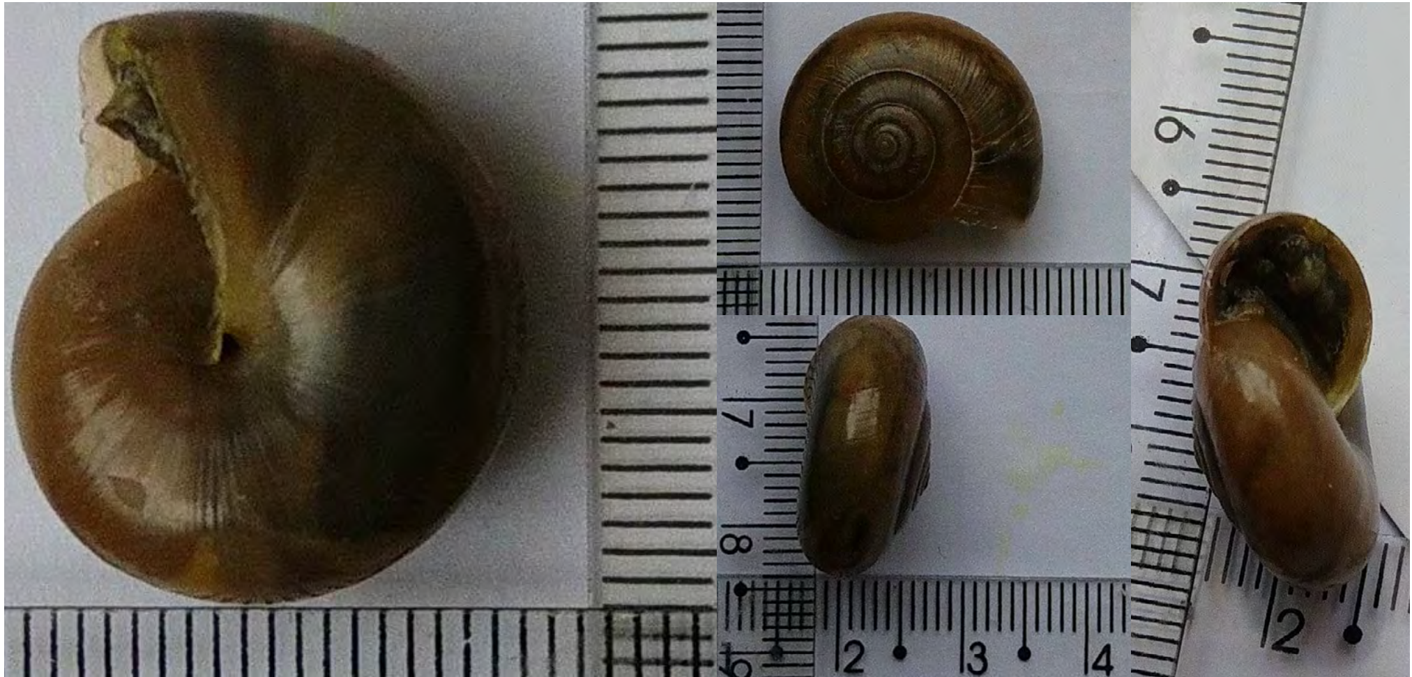
Figura 3. Detalles de la concha del caracol no-nativo invasor indo-asiático Ariophanthidae Macrochlamys cf. indica Benson, 1832 encontrado en plántulas frutíferas de cítricos comercializadas en floricultura del “Município de Palhoça”, Grande Florianópolis, estado de Santa Catarina/ SC (Fotografía: Jefferson Souza da Luz, staff del “Projeto AM”).