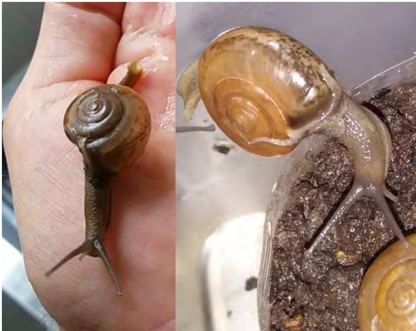
Figura 2: Caracoles no-nativos invasores indo-asiáticos Ariophantidae Macrochlamys cf. indica Benson, 1832 encontrados en plántulas frutíferas de cítricos comercializadas en floricultura del “Município de Palhoça”, Grande Florianópolis, estado de Santa Catarina/ SC (Fotografía: Jefferson Souza da Luz, staff del “Projeto AM”).

Figure 1. Appearance of one of the citrus fruit seedlings (orange) marketed in floriculture of the “Palhoça municipal district”, Great Florianópolis region, Santa Catarina State/ SC, inadvertently transporting invasive non-native indo-asiatic snail Ariophantidae Macrochlamys cf. indica Benson, 1832 (Photography: Jefferson Souza da Luz, staff of the “Project AM”).