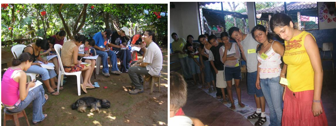
Jornadas de reflexión realizadas en el Cantón Santa Marta, el 28 de Octubre y el 02 de Diciembre de 2006

Igualmente se procedió el día 29 en las colonias Cinco de Noviembre y El Campo, las que al final se fusionaron, dada la poca asistencia de jóvenes en esta última colonia. Por la tarde ninguna de las dos colonias asistieron, por tanto se suspendió la actividad. En general se contó con una asistencia de cincuenta y tres jóvenes, treinta y una mujeres y veintidós hombres, provenientes de cinco colonias diferentes.