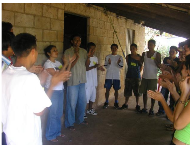
Jornada de Reflexión realizada en el Cantón Santa Marta el 02 de Diciembre de 2006.

De acuerdo a lo establecido, el equipo investigador diseñó tres cartas didácticas que se trabajarían una en cada jornada. Sin embargo, situaciones como el atraso generado en la entrega de las convocatorias, retrasaron la realización de la primera jornada. Por otra parte la impuntualidad en la asistencia de las y los jóvenes convocados redujo el tiempo de la jornada. Esto obligó a