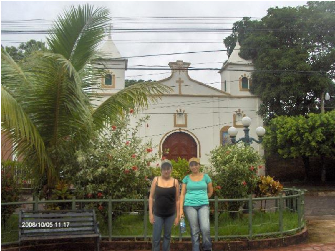
IGLESIA PARROQUIAL DE INTIPUCÁ