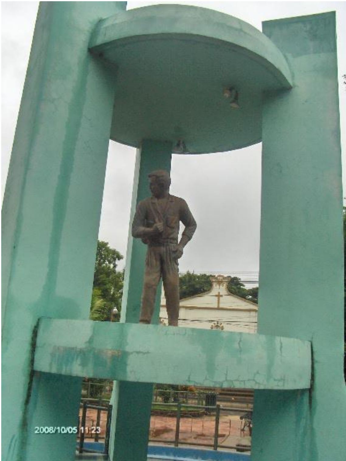
PARQUE CENTRAL DE INTIPUCÁ