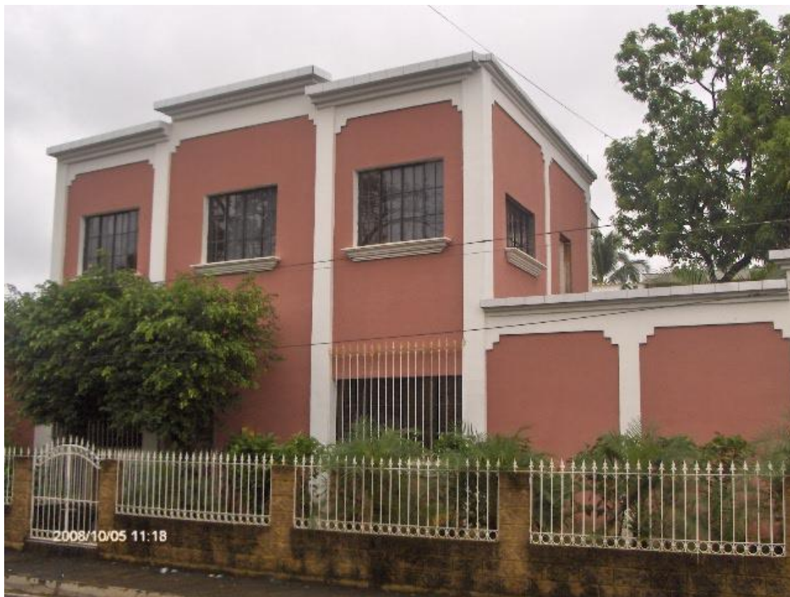
CIUDAD DE INTIPUCÁ