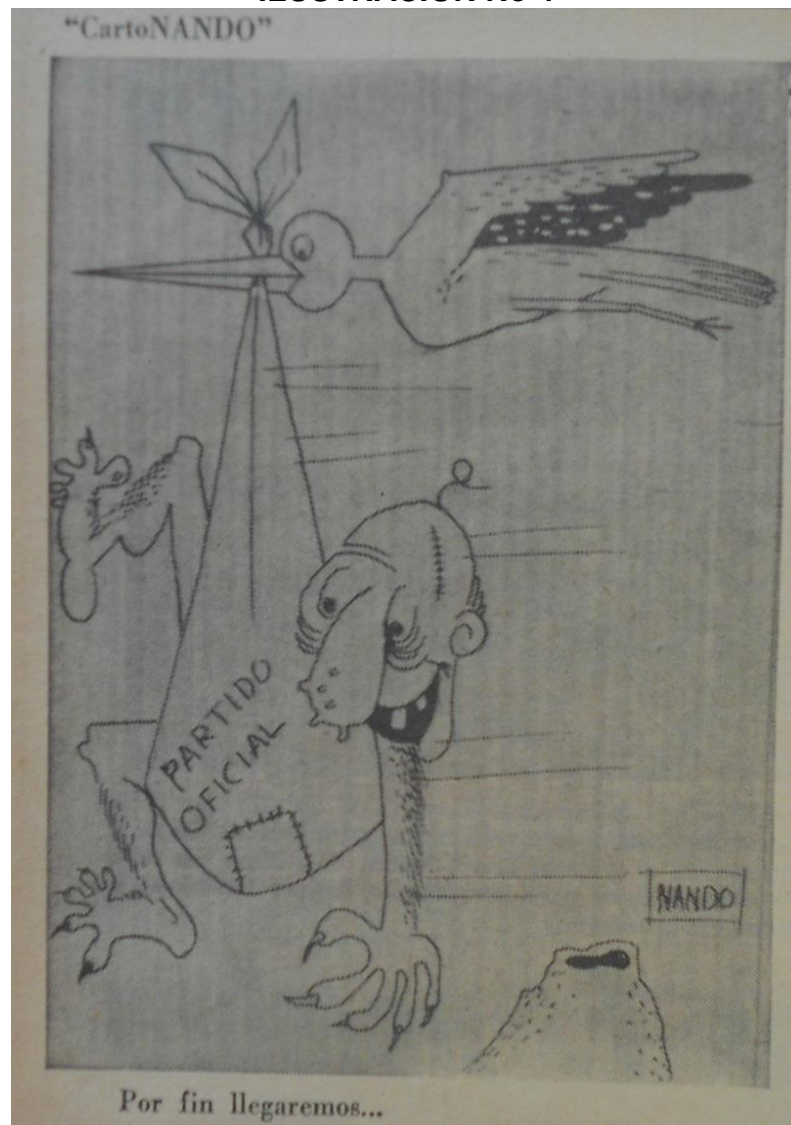
ILUSTRACIÓN No 4