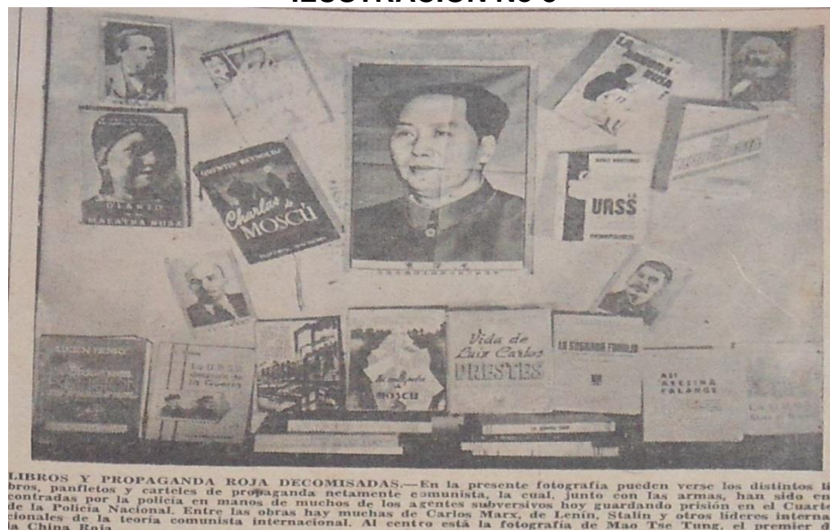
LIBROS Y PROPAGANDA ROJA DECOMISADAS. —En la presente fotografía pueden verse los distintos libros, panfletos y carteles de propaganda netamente comunista, la cual, junto con las armas, han sido encontradas por la policía en manos de muchos de los agentes subversivos hoy guardando prisión en el Cuartel de la Policía Nacional. Entre las obras hay muchas de Carlos Marx, de Lenin, Stalin y otros líderes internacionales de la teoría comunista internacional. Al centro está la fotografía de Mao Tse Tung, el premier de la China Roja.

Fuente: "Libros y propaganda roja decomisada", El Diario de Hoy , 29 de septiembre de 1952, 3.