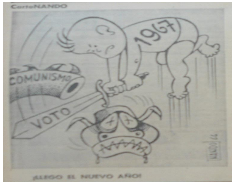
ILUSTRACIÓN No. 5