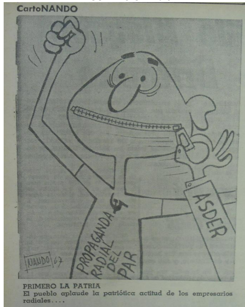
ILUSTRACIÓN No 6

Fuente: "CortoNando", El Diario de Hoy , 26 de enero de 1967, 6.