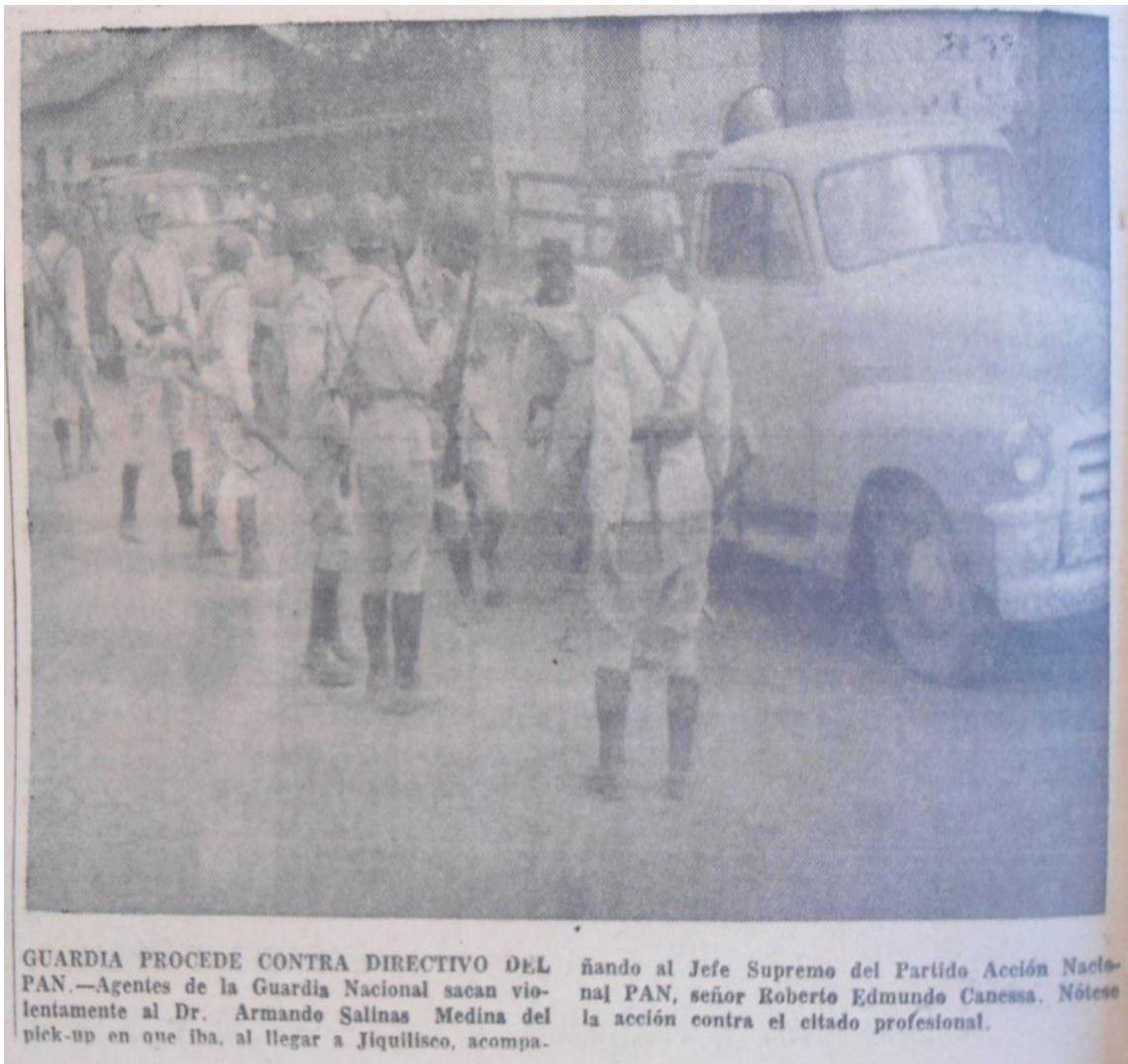
ILUSTRACIÓN No 3