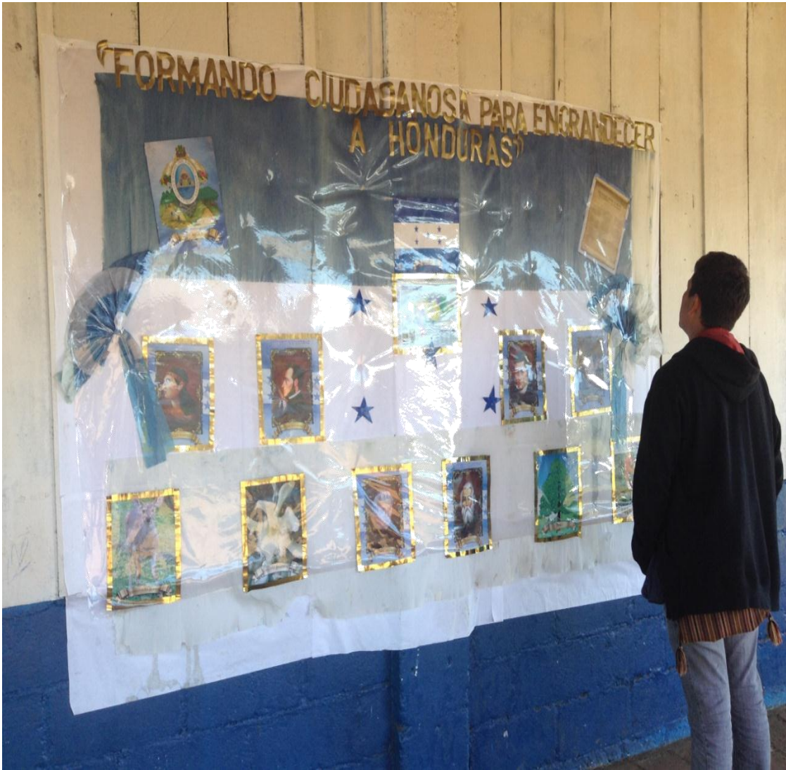
Mural Cívico ubicado en el exterior de un salón de clases del CEIC.