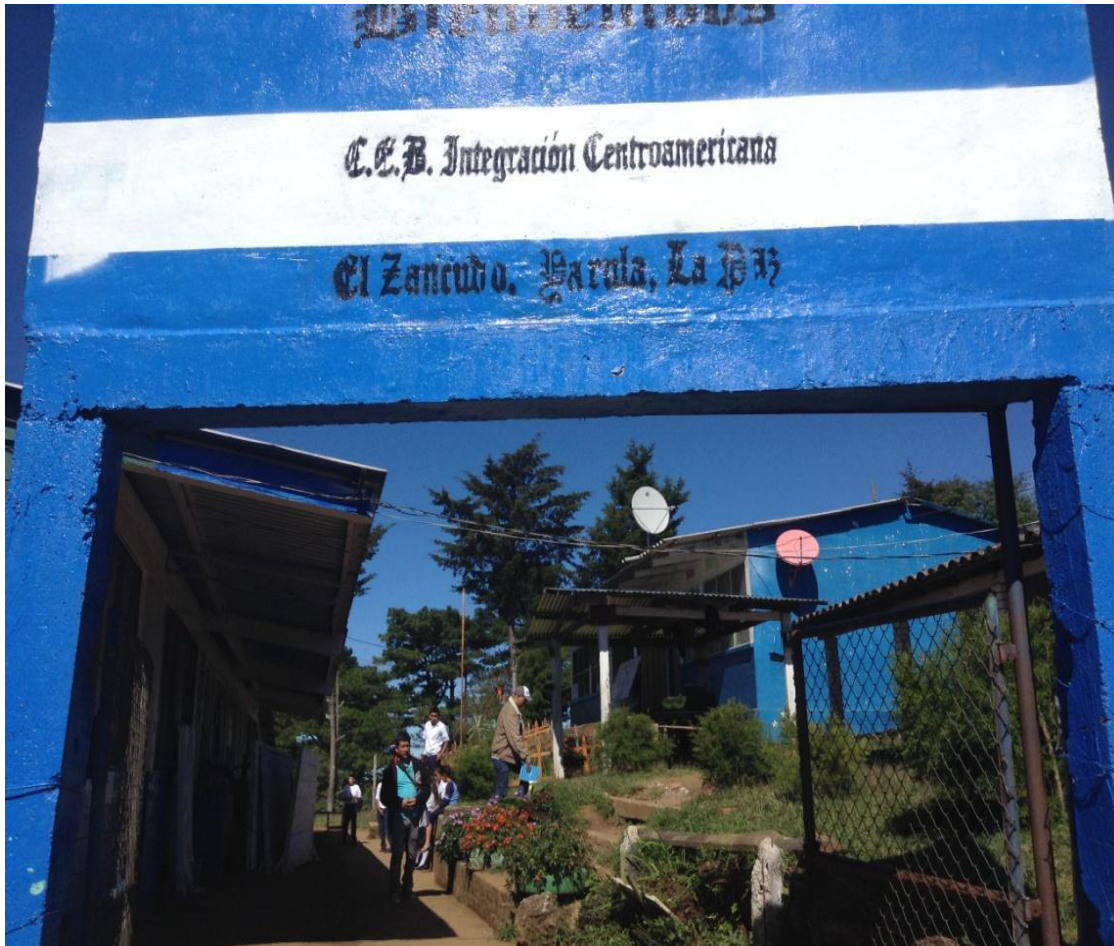
Centro Escolar Integración Centroamericana de la Comunidad El Zancudo.