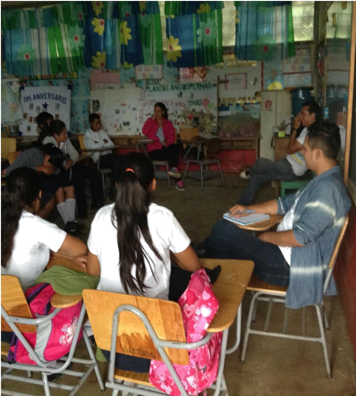
Grupo de Discusión con alumnos de noveno grado del C.E. B. Integración Centroamericana de entre 14 y 24 años de Edad.