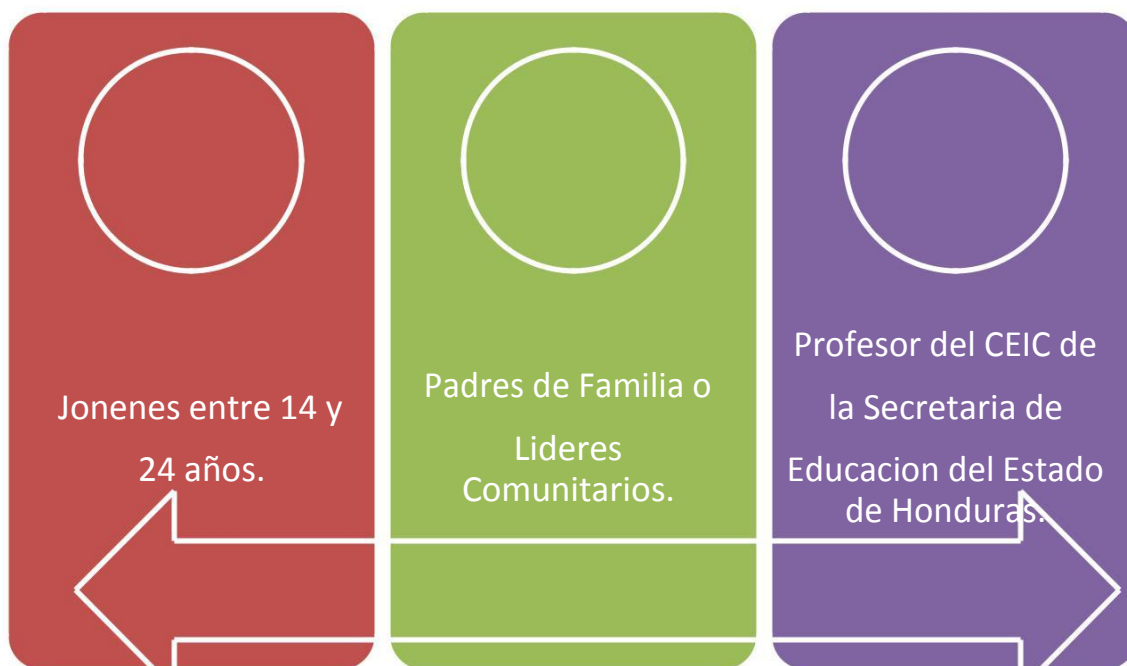
Tabla 1. Detalle de la Muestra.