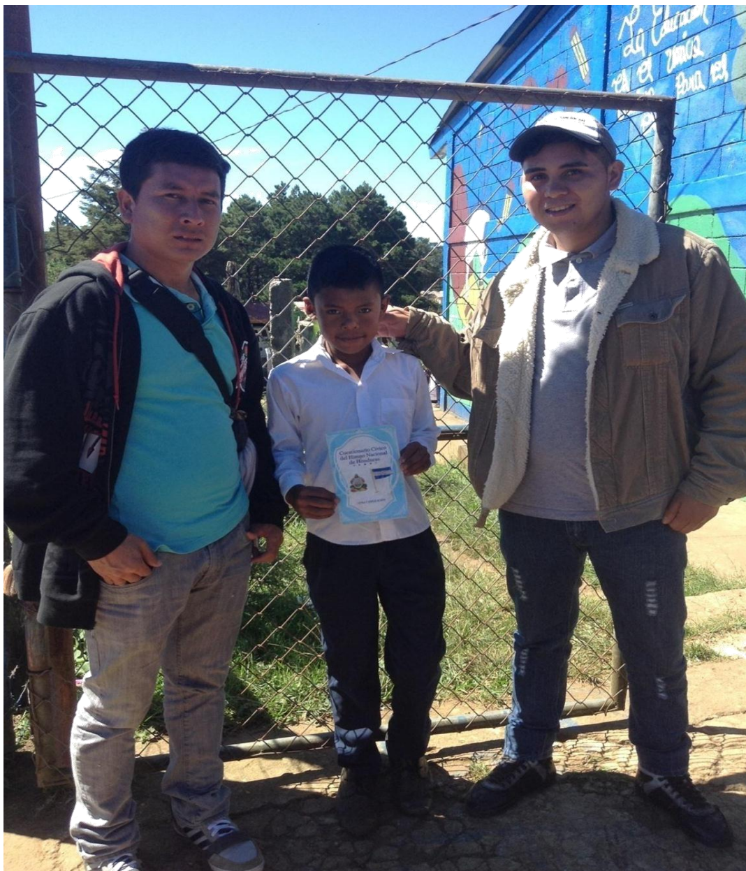
Alumno del sexto grado con el cuestionario cívico del Himno Nacional de Honduras