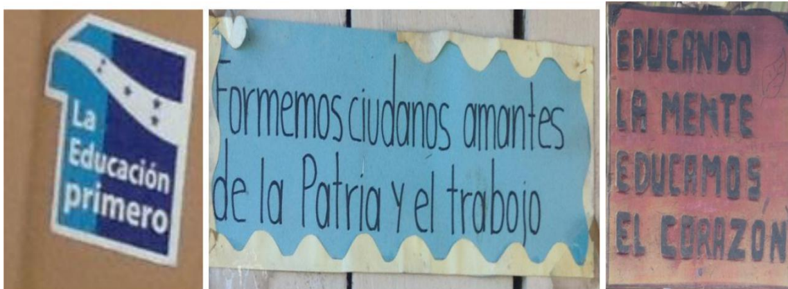
Imágenes visibles en las puertas y paredes externas e internas de las aulas de clases del CEIC.

por ejemplo: soy catracho de corazón, fiestas patrias de Honduras, el estudio pieza clave de nuestro futuro: Honduras la educación es 1º, formemos ciudadanos amantes de la patria y el trabajo, formando ciudadanos para engrandecer Honduras, entre otras.