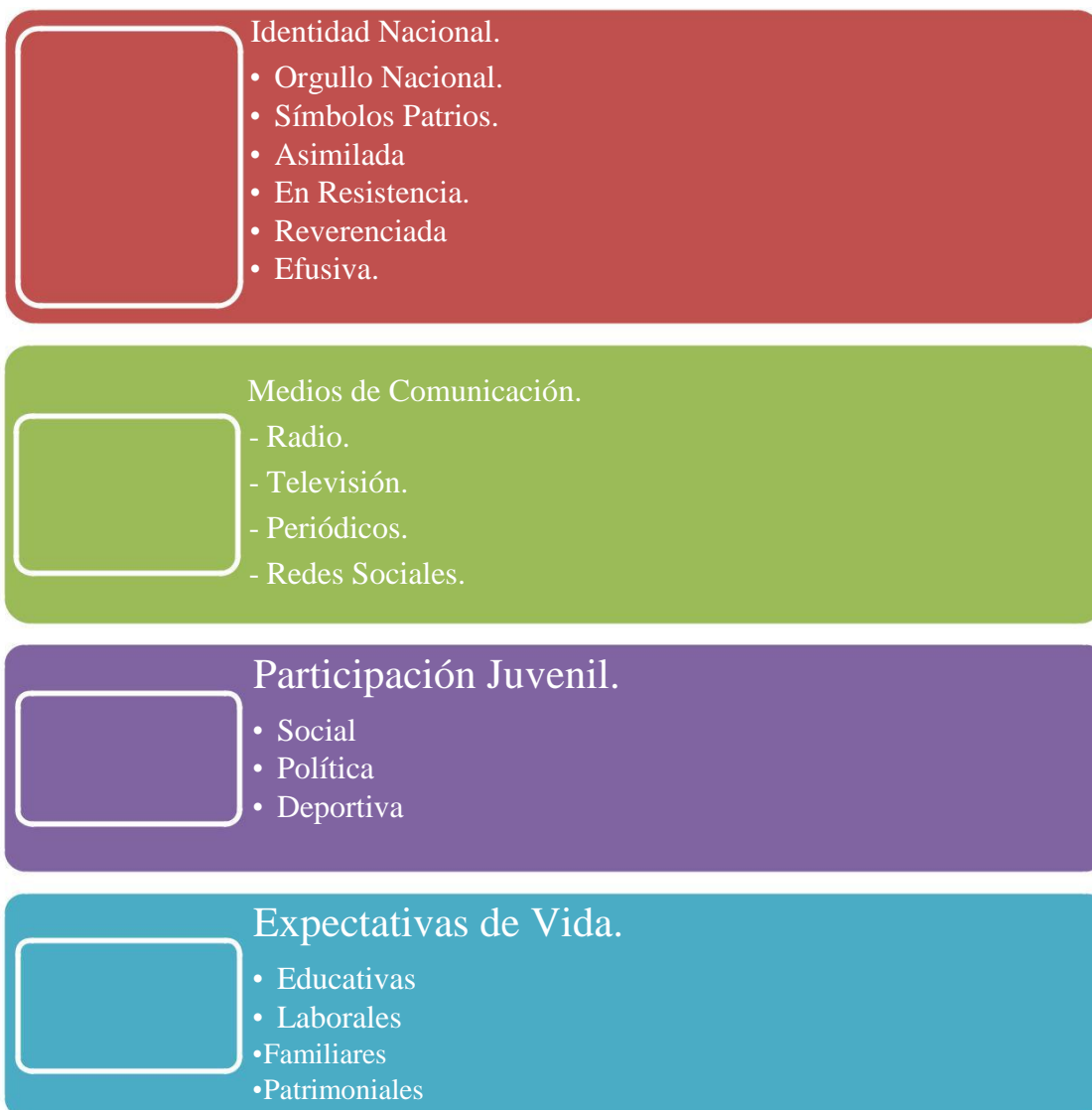
Cuadro 2. Categorías de Análisis del Estudio.