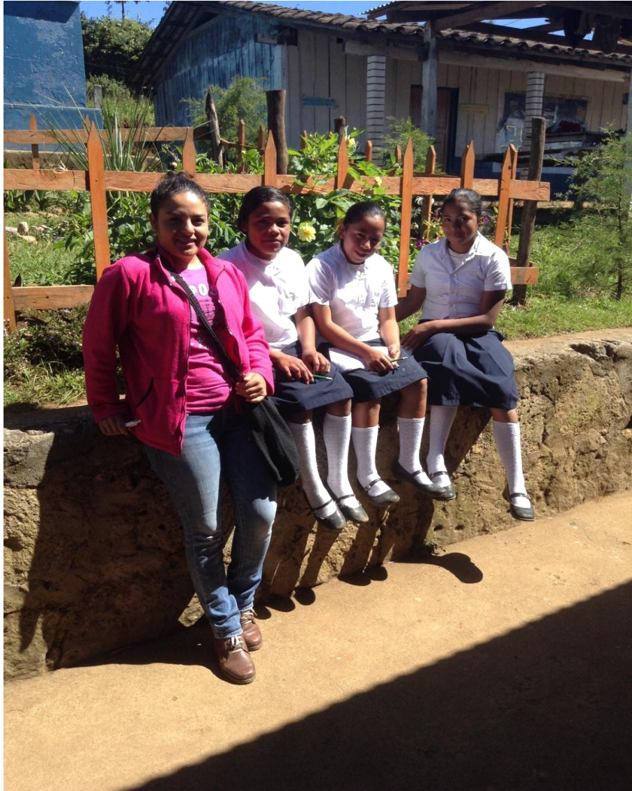
Junto a alumnas del sexto grado, estudiando para evaluación sobre el himno de Honduras.