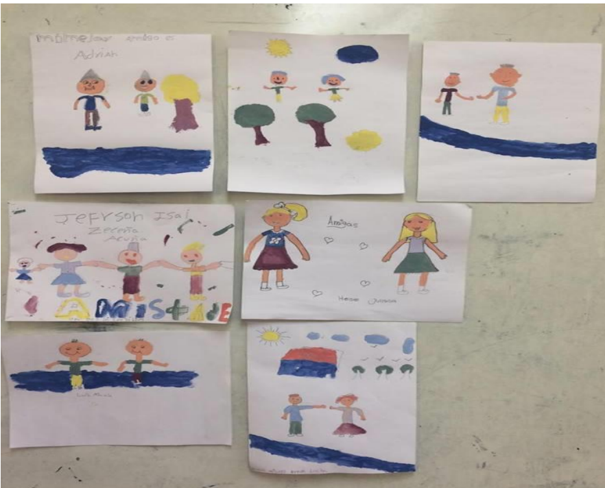
Dibujo y pintura