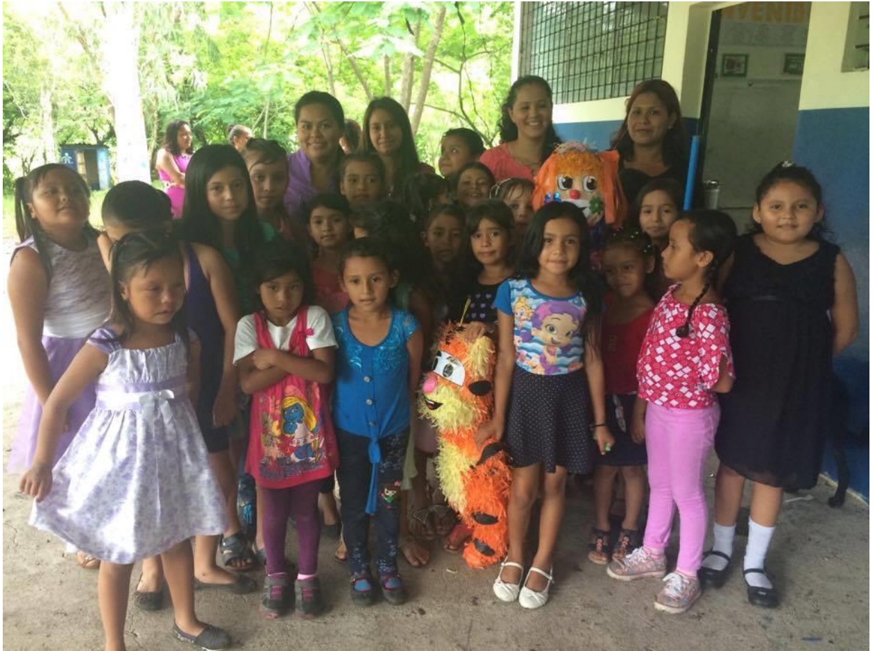
Foto de grupo