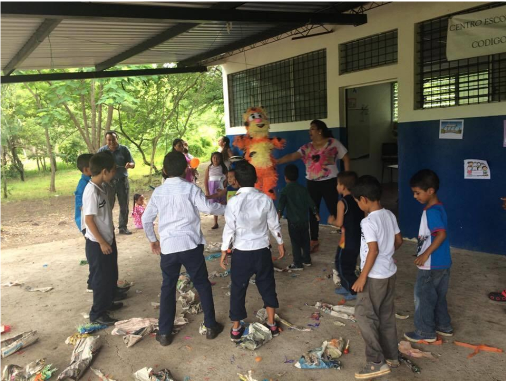
Quiebra de piñatas