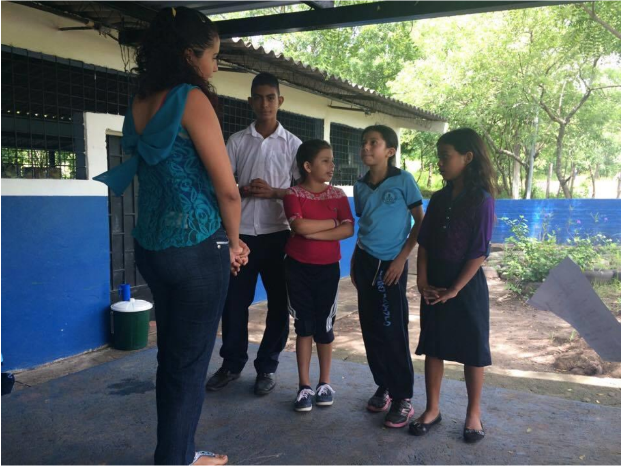
Ensayo del drama