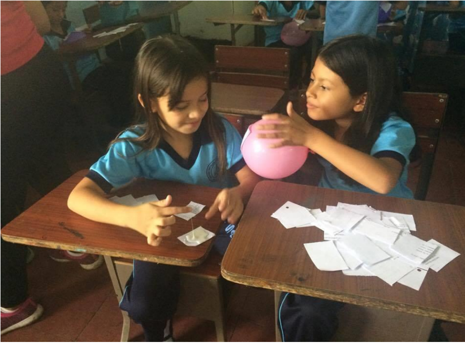
Trabajo en equipo