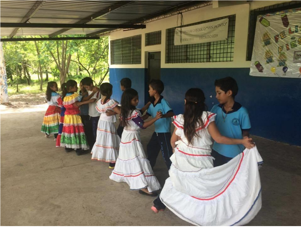
Ensayo de proyección de danza folklórica