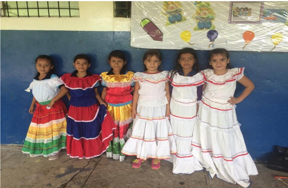
Grupo de danza folklórica