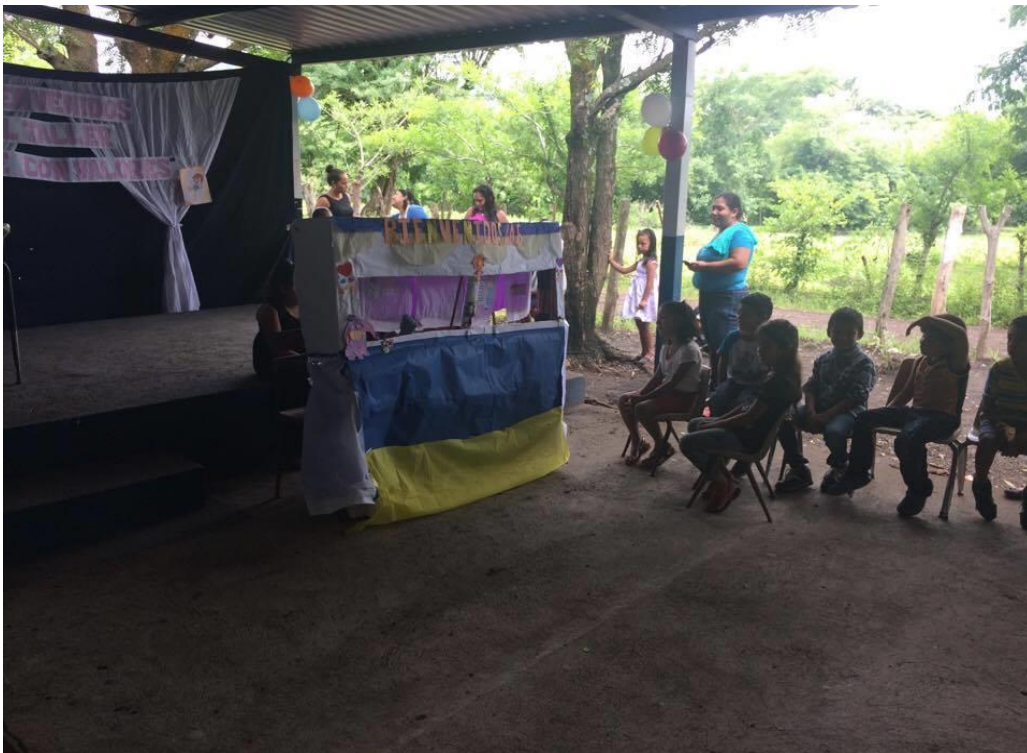
Presentación del teatrillo