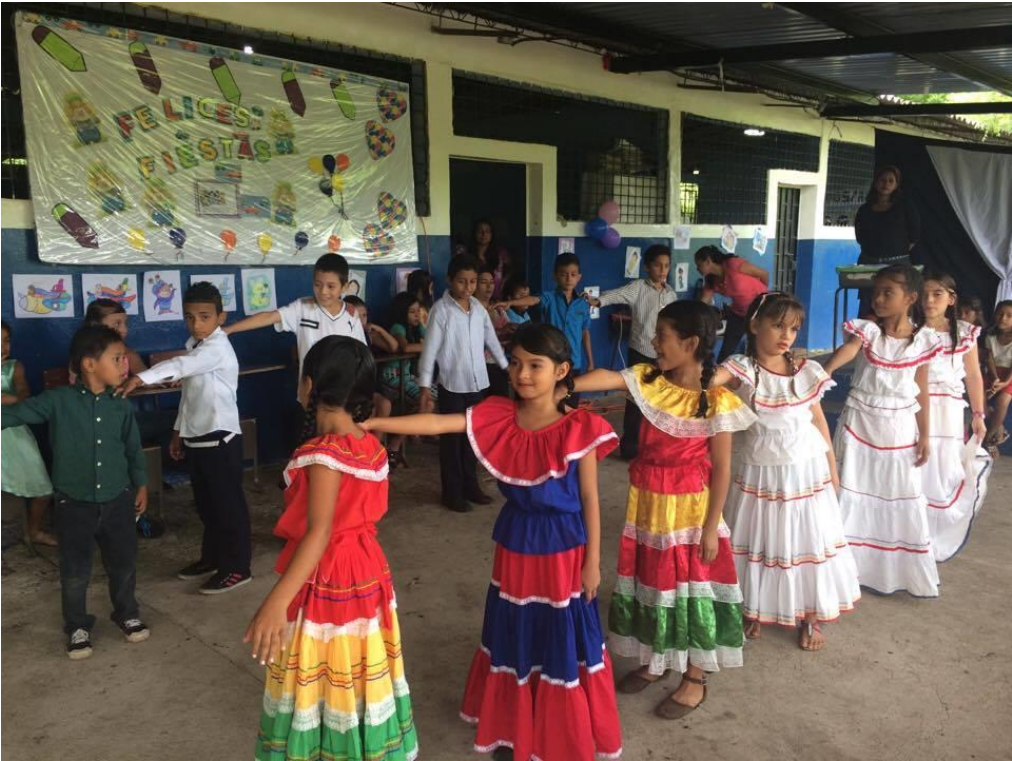
Proyección de danza folklórica