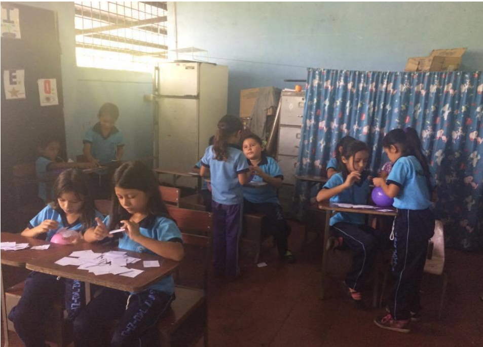
Realización de máscaras