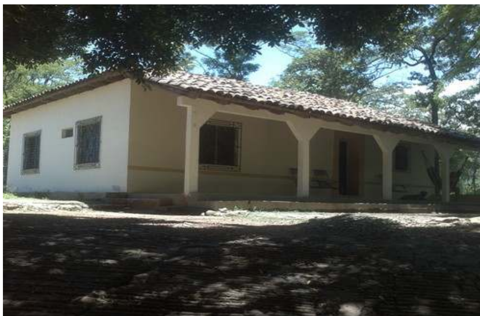
TIPO DE VIVIENDA DE FAMILIA RECEPTORA DE REMESAS