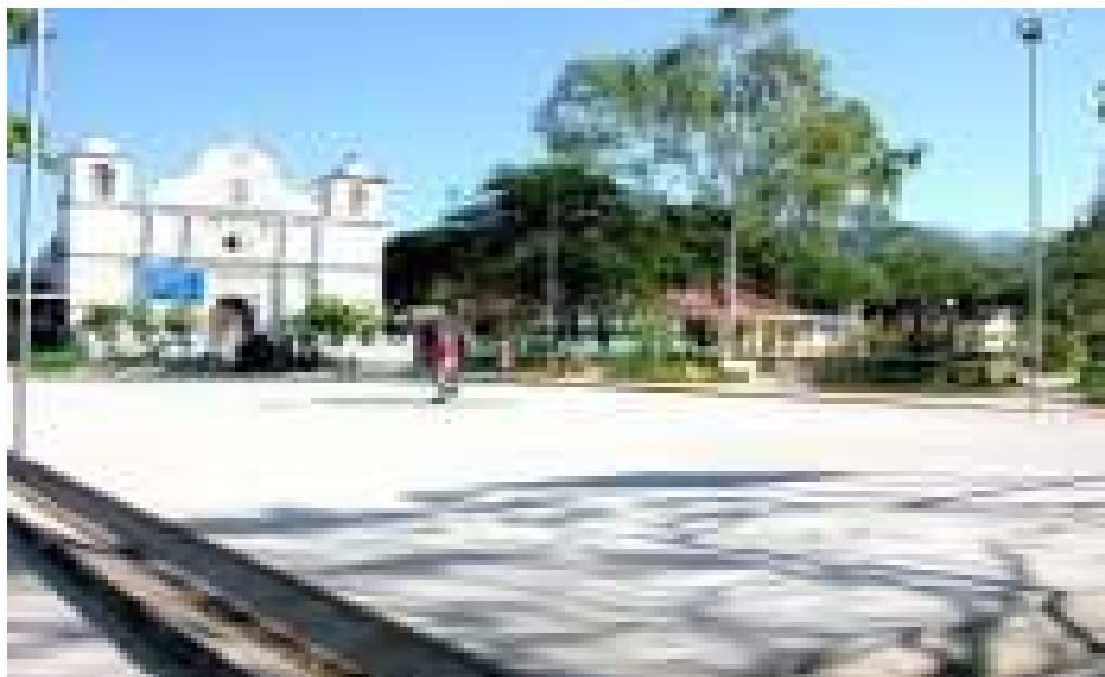
CANCHA DE BASKET BALL EN EL PARQUE CENTRAL