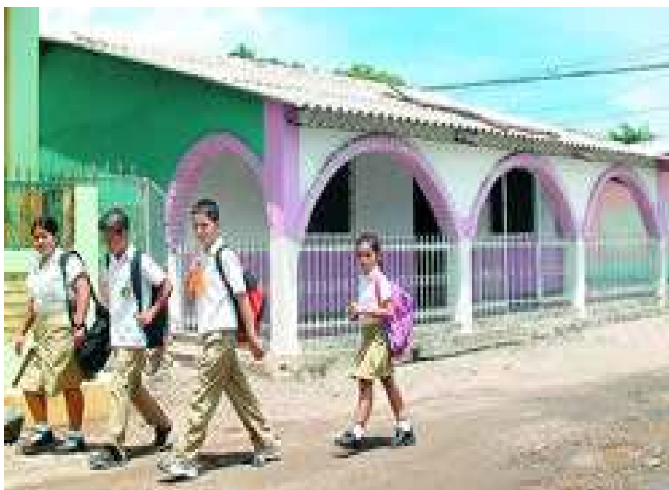
VIVIENDA SOLA EN LA ZONA RURAL DEBIDO A LA MIGRACION