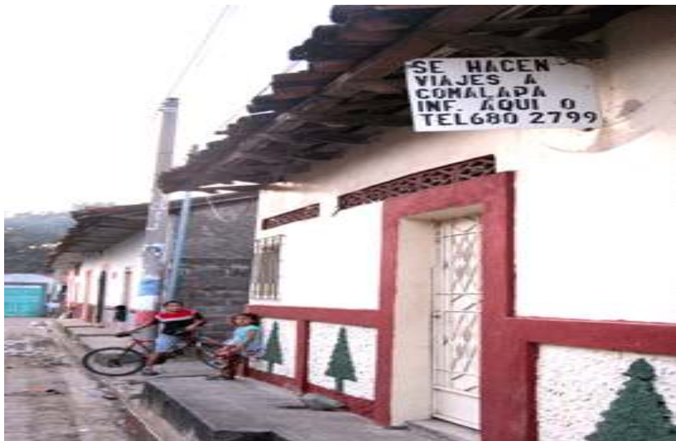
NEGOCIO DE VIAJES AL AEREO PUERTO DE EL SALVADOR