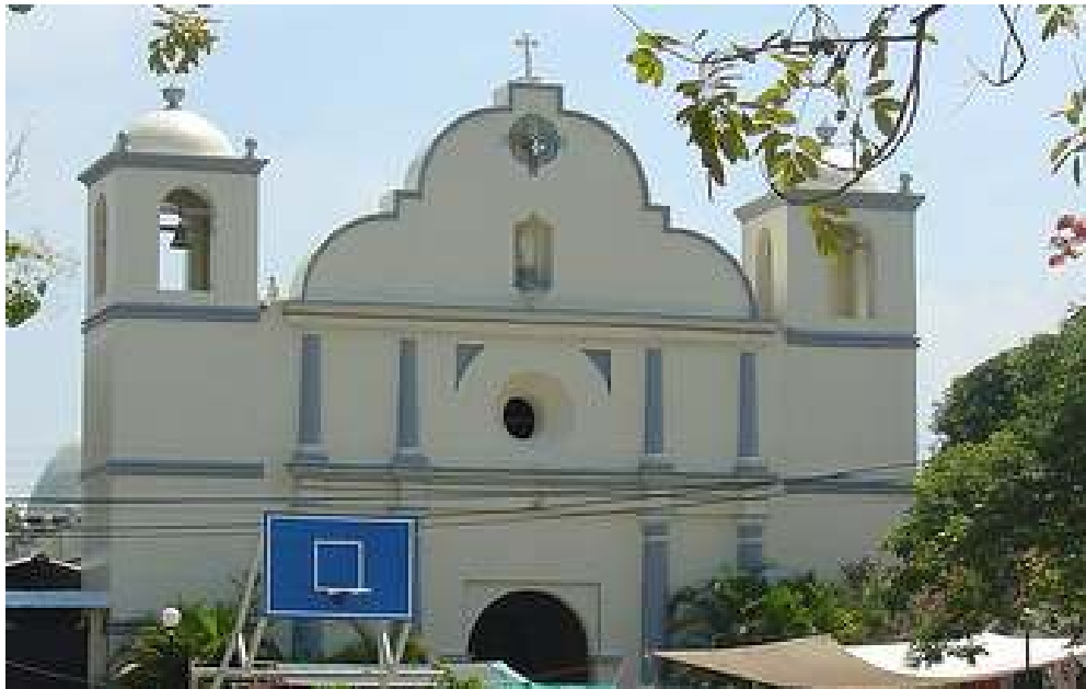
IGLESIA PARROQUIAL DE CONCEPCION DE ORIENTE