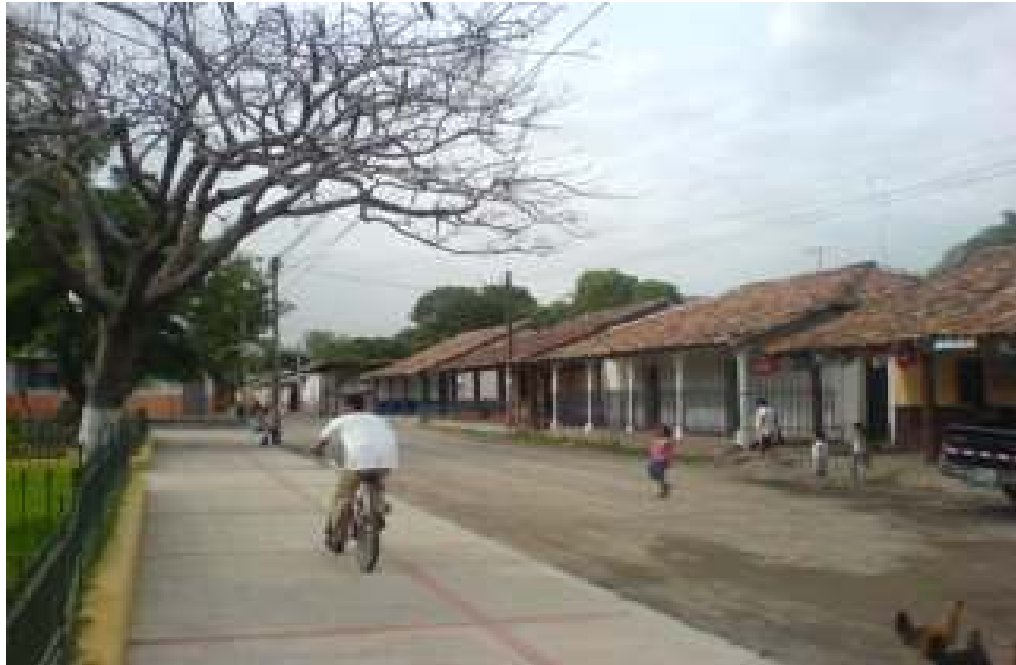
CALLES Y VIVIENDAS EN EL CASCO URBANO DEL MUNICIPIO