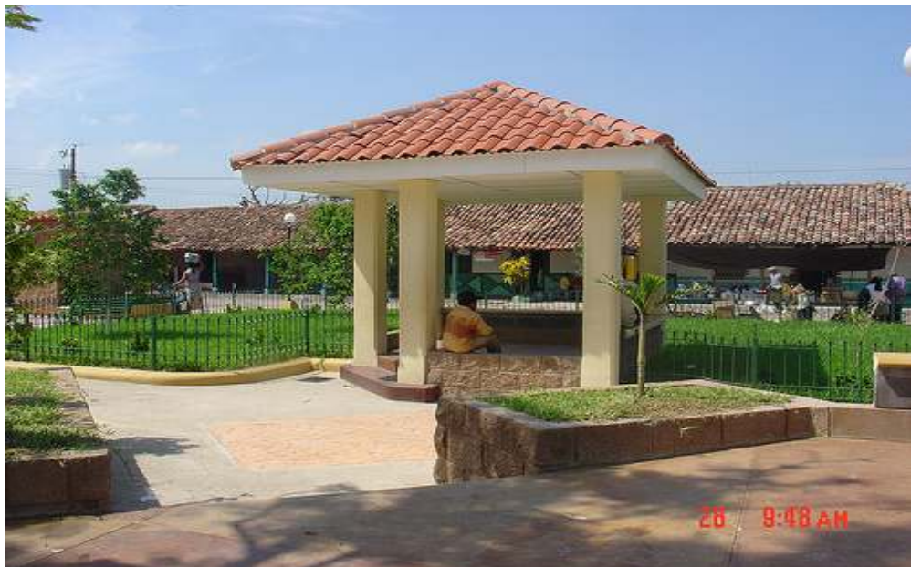
ZONA SUR DEL PARQUE CENTRAL