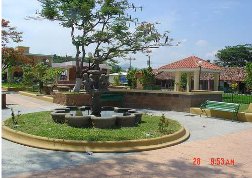
PARQUE CENTRAL CONSTRUIDO CON REMESAS COMUNITARIAS