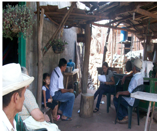
Ilustración 3: miembros del Caserío El Amate.