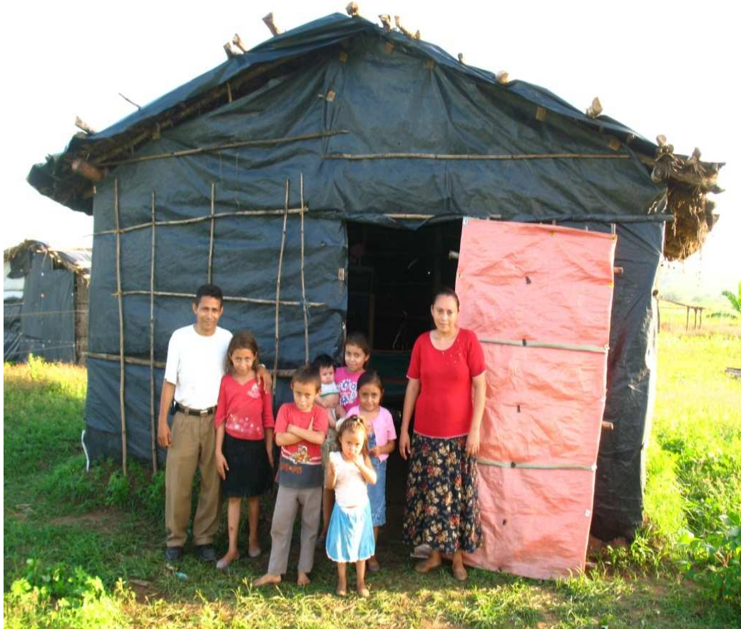
Esta fotografía muestra una de las familias que viven en el caserío los Ranchos del Municipio de Intipuca Departamento de la Unión.