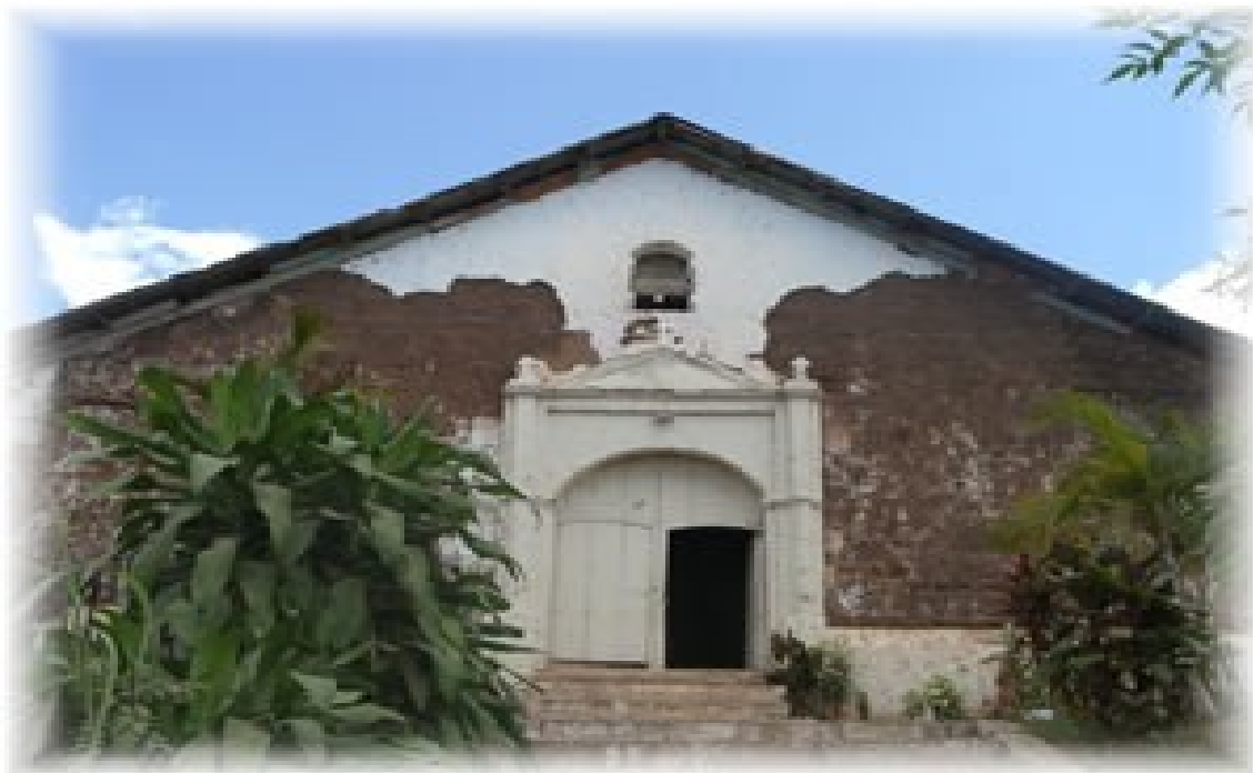
Iglesia Católica del Señor de Roma, Ubicada en el Barrio Roma de Ciudad Barrios.