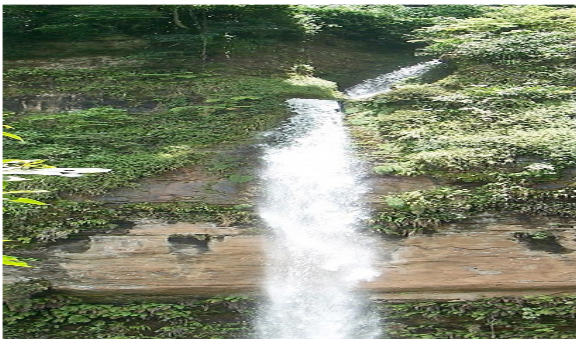
Ubicado en el Cantón San Matías de la jurisdicción de Ciudad Barrios, muy cerca de la línea divisoria entre San Simón y Ciudad Barrios. En este arroyo se forma la alta y espectacular cascada, conocida popularmente como EL CHORRÓN! Le da origen El Río El Chorro, esta corriente nace en las proximidades de Las Nubes mucho más arriba, cruza la carretera que de Ciudad Barrios va hacia San Simón y San Antonio, un poco más abajo de la cascada.