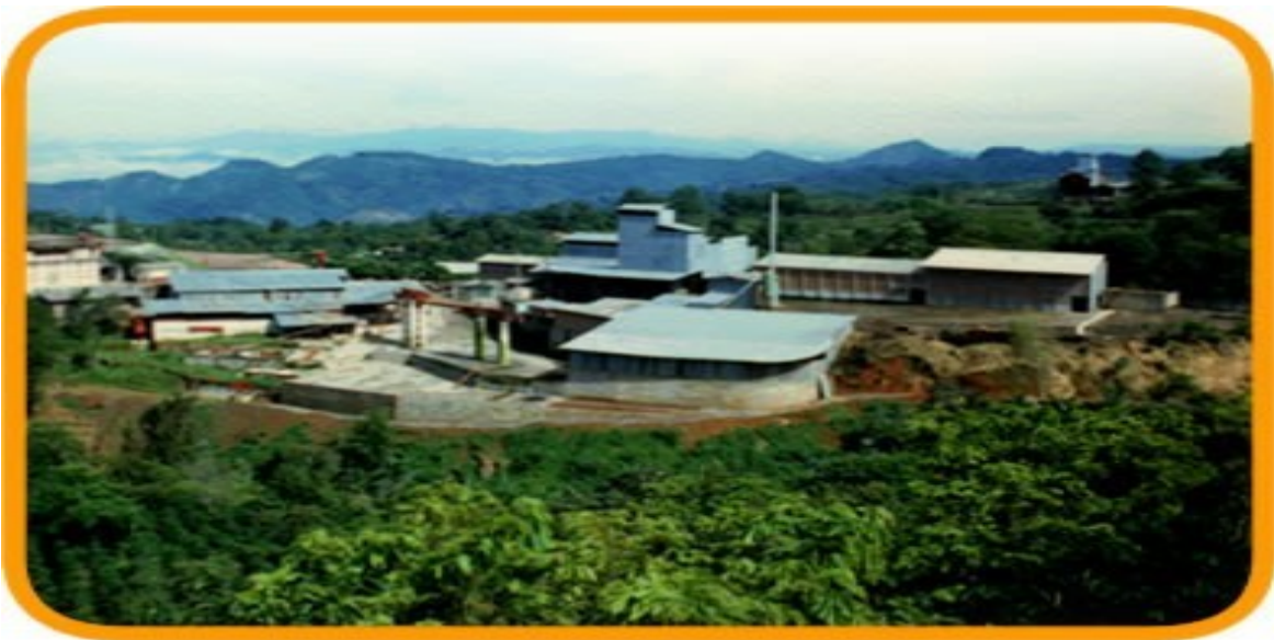
Beneficio de Cafetaleros de Ciudad Barrios, ubicado en el Barrio Bolivar

El café por años fuente principal de subsistencia de la población, Ciudad Barrios lugar en que se cultivo la primera finca de café en manos de Gerardo Barrios, el café soporte del mantenimiento de las fuentes de agua, su flor una belleza por cierto otro símbolo de Ciudad Barrio lleva como nombre" Flor de Café" y nos referimos a la marimba.