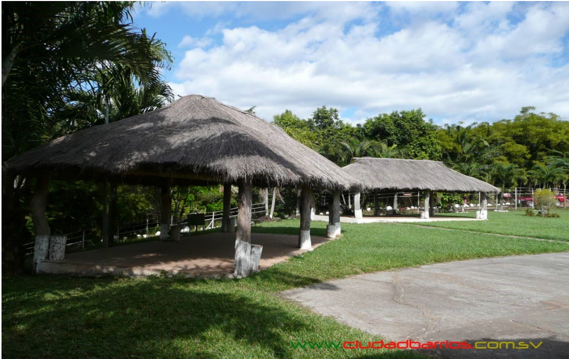
Centro Turístico el Amaton. Ubicado en Canton Belen de esta Ciudad.