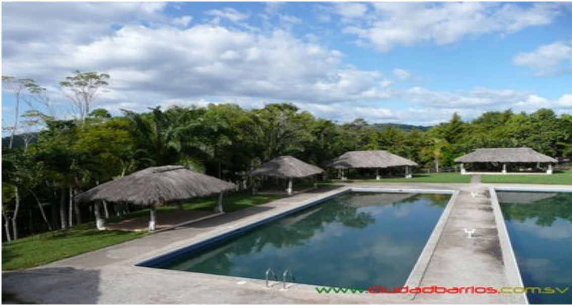
Centro Ecológico el Amaton.