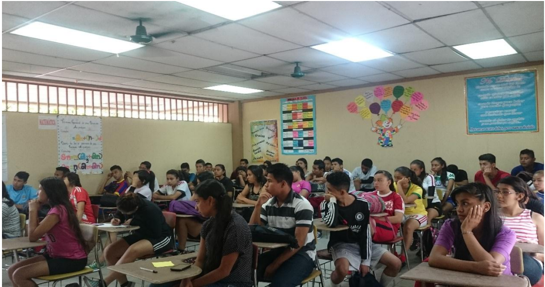
CICLO, CENTRO ESCOLAR SAN MAURICIO (Mejicanos, 2018)”.