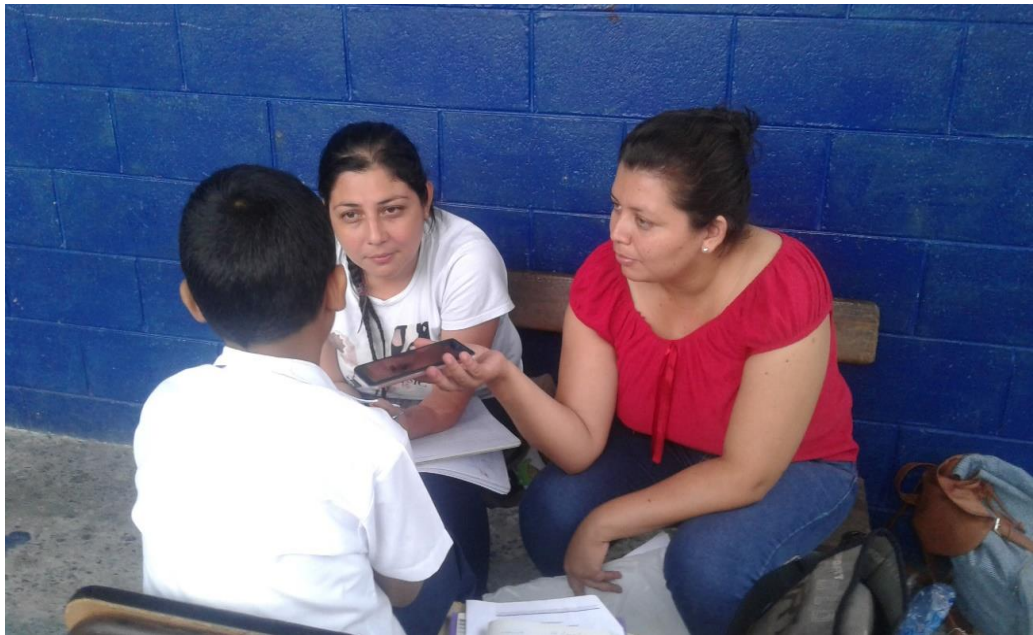
FUENTE: Fotografía tomada por estudiantes egresadas de la Licenciatura en Trabajo Social realizando el Proceso de Grado en el Centro Escolar 22 de Junio Mejicanos, San Salvador 26 de junio de 2018.