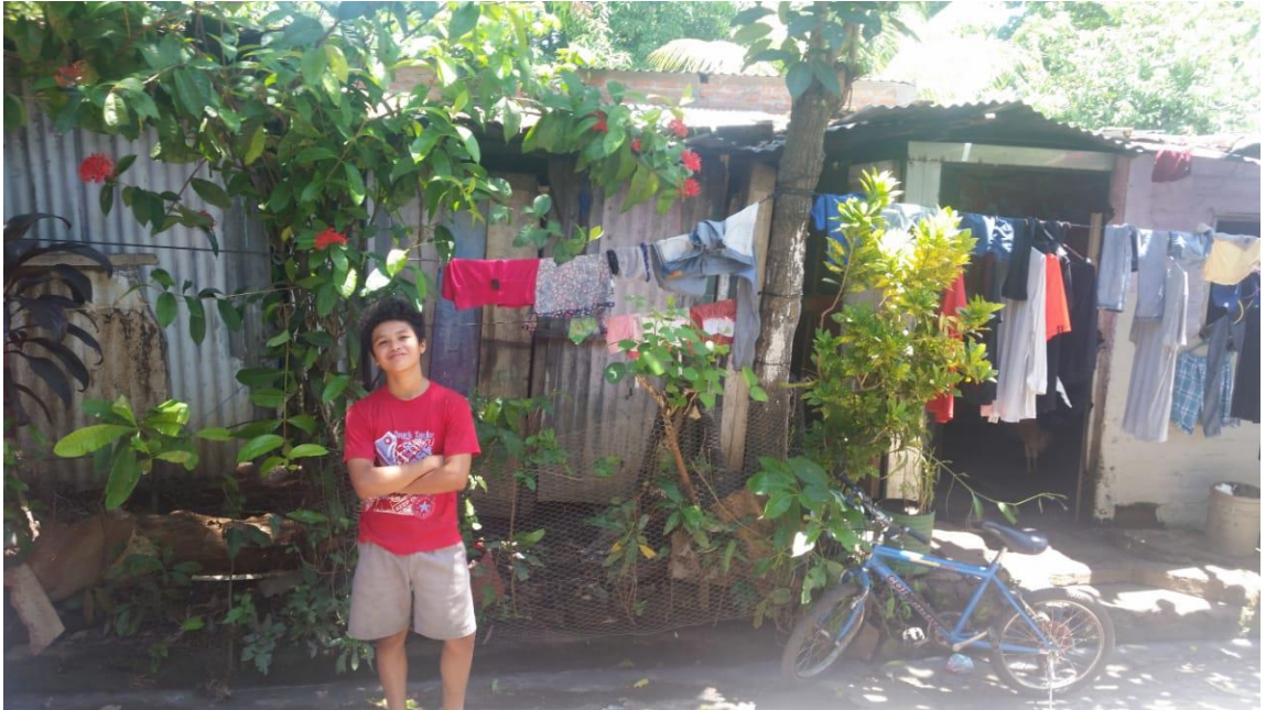
Un joven posa frente a su casa, Colonia Santa Marta Uno, 15 de octubre de 2018.