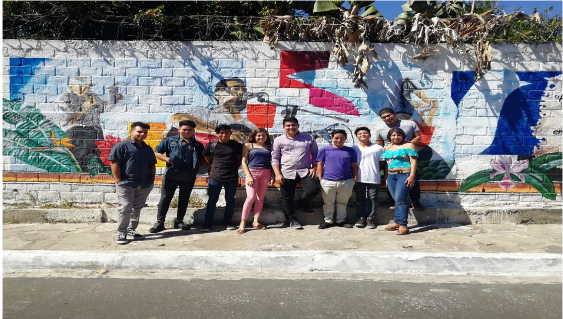
FUENTE: foto tomado por el equipo de investigación, los jóvenes posan frente al mural de la Colonia Santa Marta Uno, 17 de Noviembre de 2018