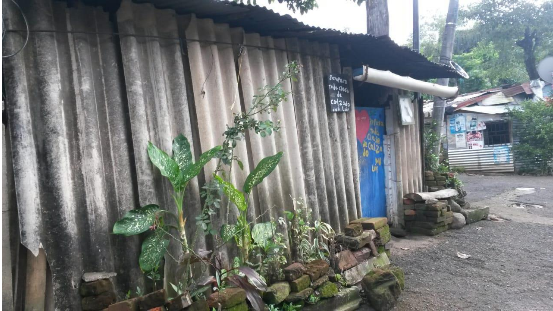
Colonia Santa Marta Uno, Armenia 10 de septiembre de 2018