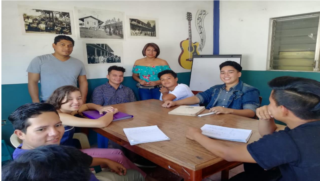
Reunión con los jóvenes de la Colonia Santa Marta Uno, Instalaciones de JOPROAR, 12 de Septiembre de 2018