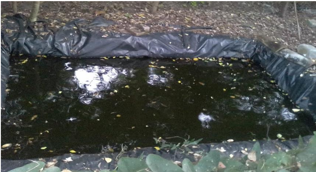
Estanque artesanal hecho por un habitante de Garita Palmera para el Cultivo de la especie Pez Sambo