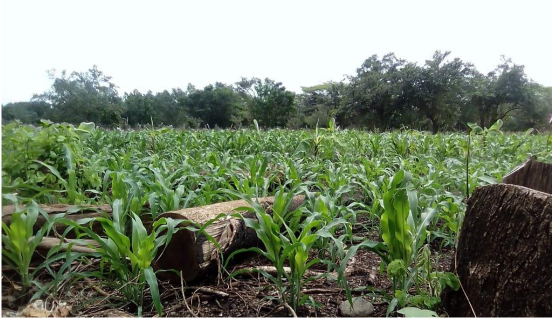
Cultivos de maíz en la comunidad de Garita Palmera