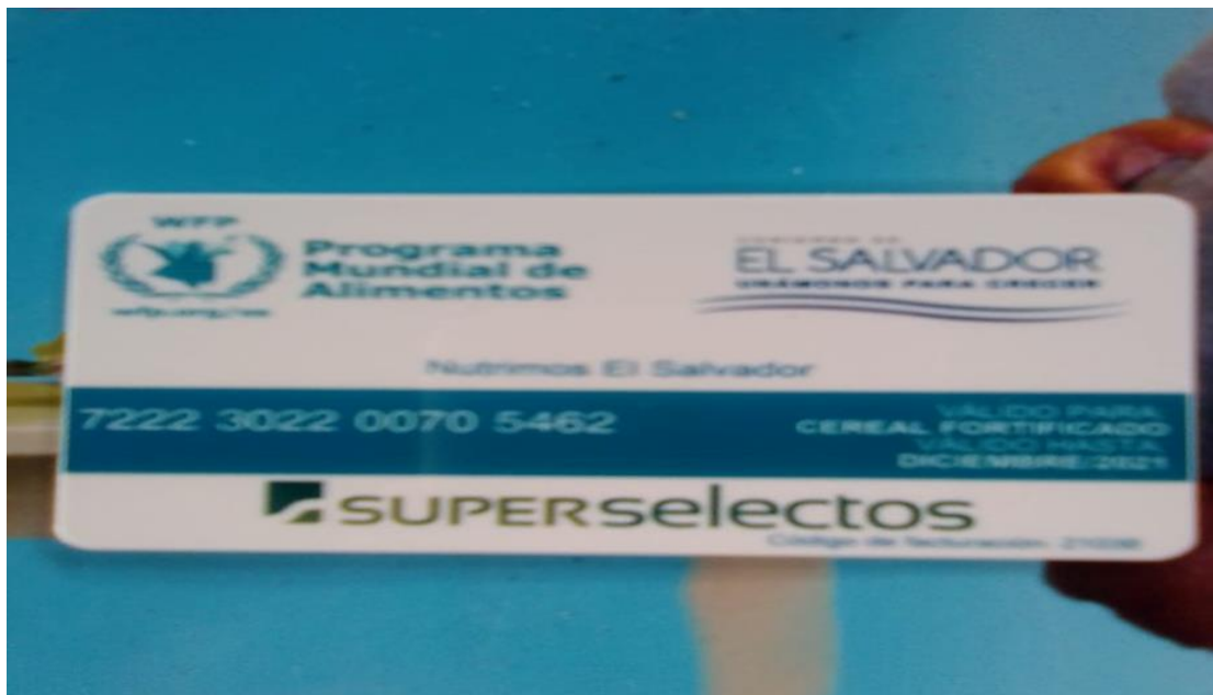
Tarjeta canjeable por harina fortificada entregada en Garita Palmera, como parte del programa Nutrimos El Salvador