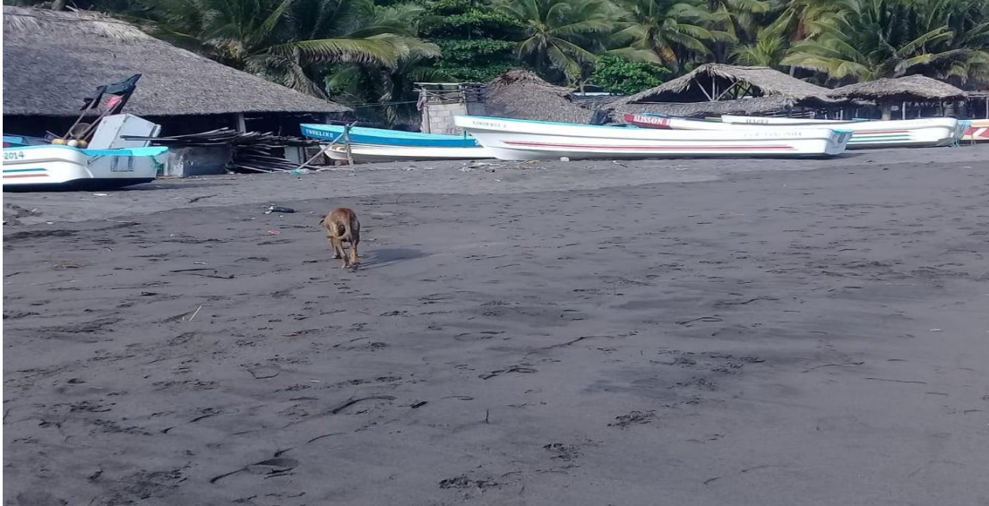
Playa de Garita Palmera