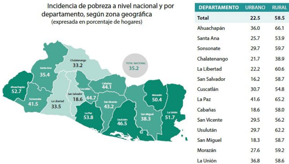
Mapa N°1: Porcentaje de hogares con incidencia de pobreza a nivel nacional