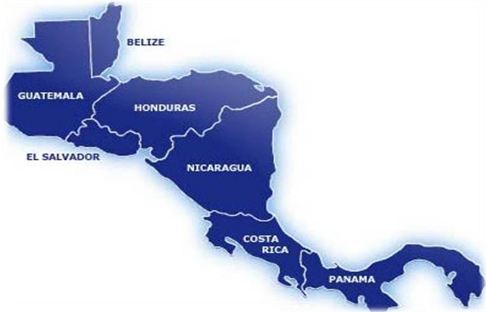
Anexo 1. Mapa de Centroamérica.