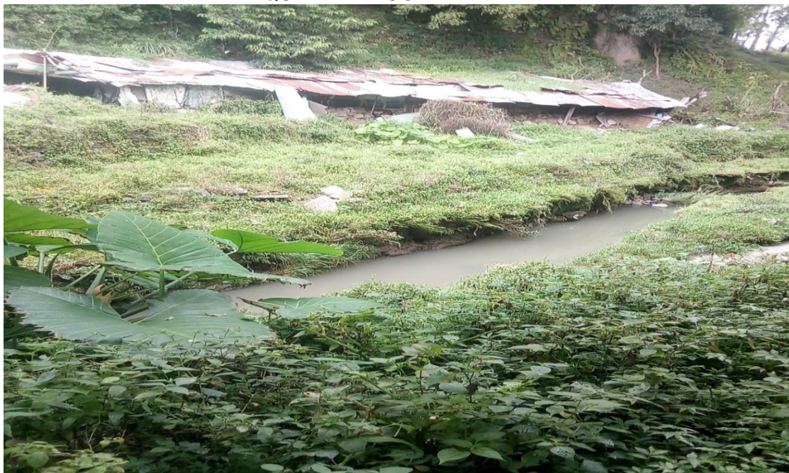
Fuente: foto tomada por el grupo investigador, Quebrada Champupe, entrevista líder comunal, 2018.