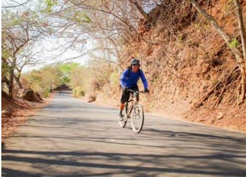
Activista Particular, haciendo uso de la bicicleta como medio de transporte ecológico