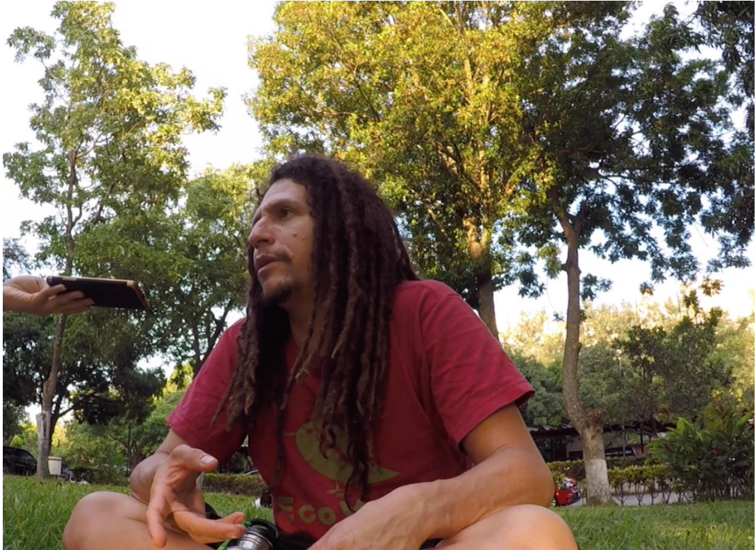
Activista Particular, durante sesión de entrevista en el campus de la Universidad de El Salvador. Octubre 2018.