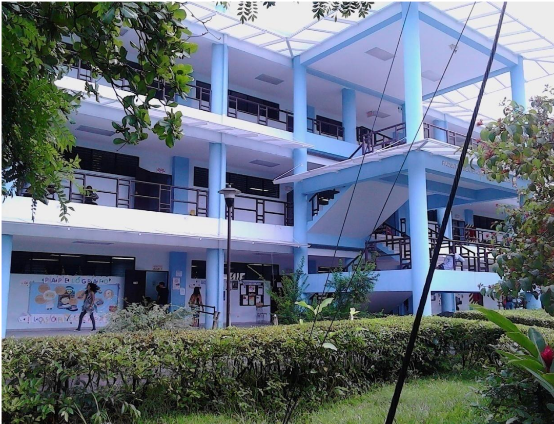
Fuente: Edificio Dr. Dagoberto Marroquín, Facultad de Ciencias y Humanidades