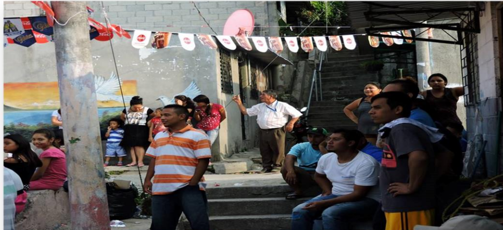
FUENTE: Fotografía de habitantes de la colonia Vista el Boulevard en Celebración del día de la madre, 30 de mayo 2017. Tomada por Pasante Especializada del Instituto Nacional de la Juventud INJUVE