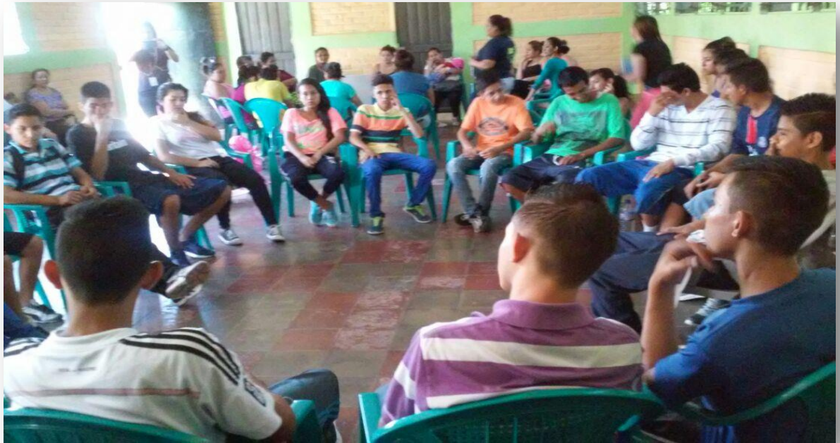
Fuente: Fotografía de jóvenes en reunión de coordinación deportiva, colonia Vista el Boulevard 30 de noviembre de 2016