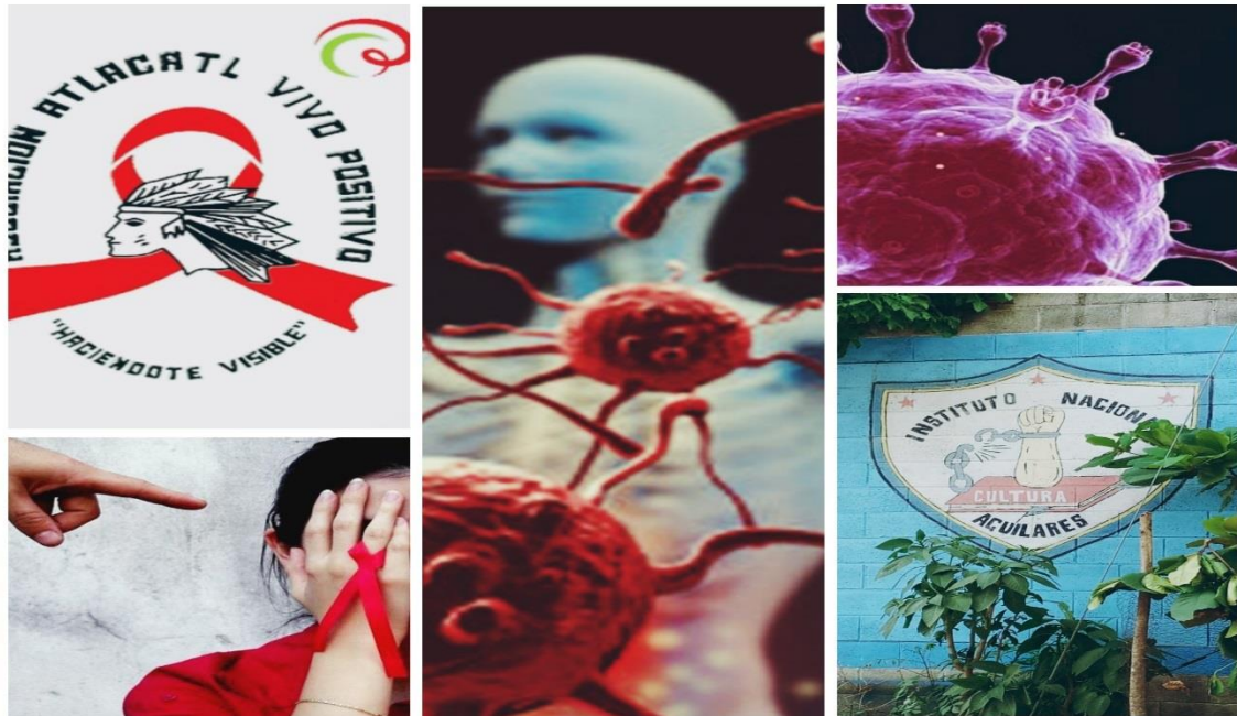
FUENTE TOMADO DE: Estudiantes egresados de la Licenciatura de Trabajo Social, “estigmas del VIH en adolescentes del instituto nacional de Aguilares 2018”, Atlacatl Vivo Positivo e Instituto Nacional de Aguilares 2018.