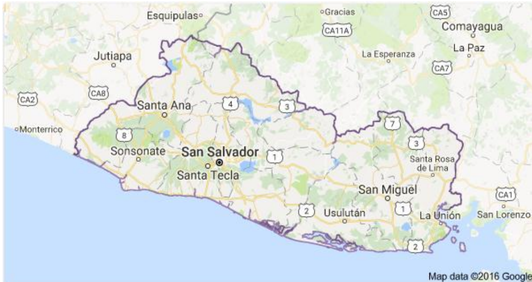
Imagen 3: Mapa de El Salvador