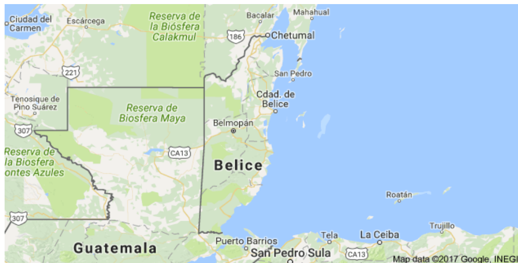
Imagen 2: Mapa de Belice