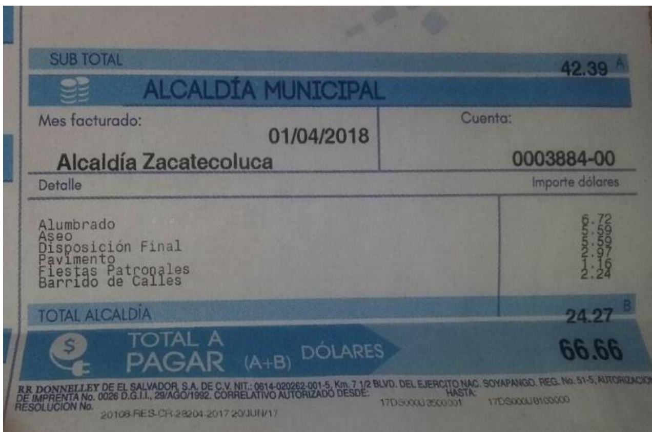
Imagen de Recibo de Luz en donde se detalla el cobro por fiestas patronales a la Alcaldía de Zacatecoluca, Departamento de la Paz, El Salvador.