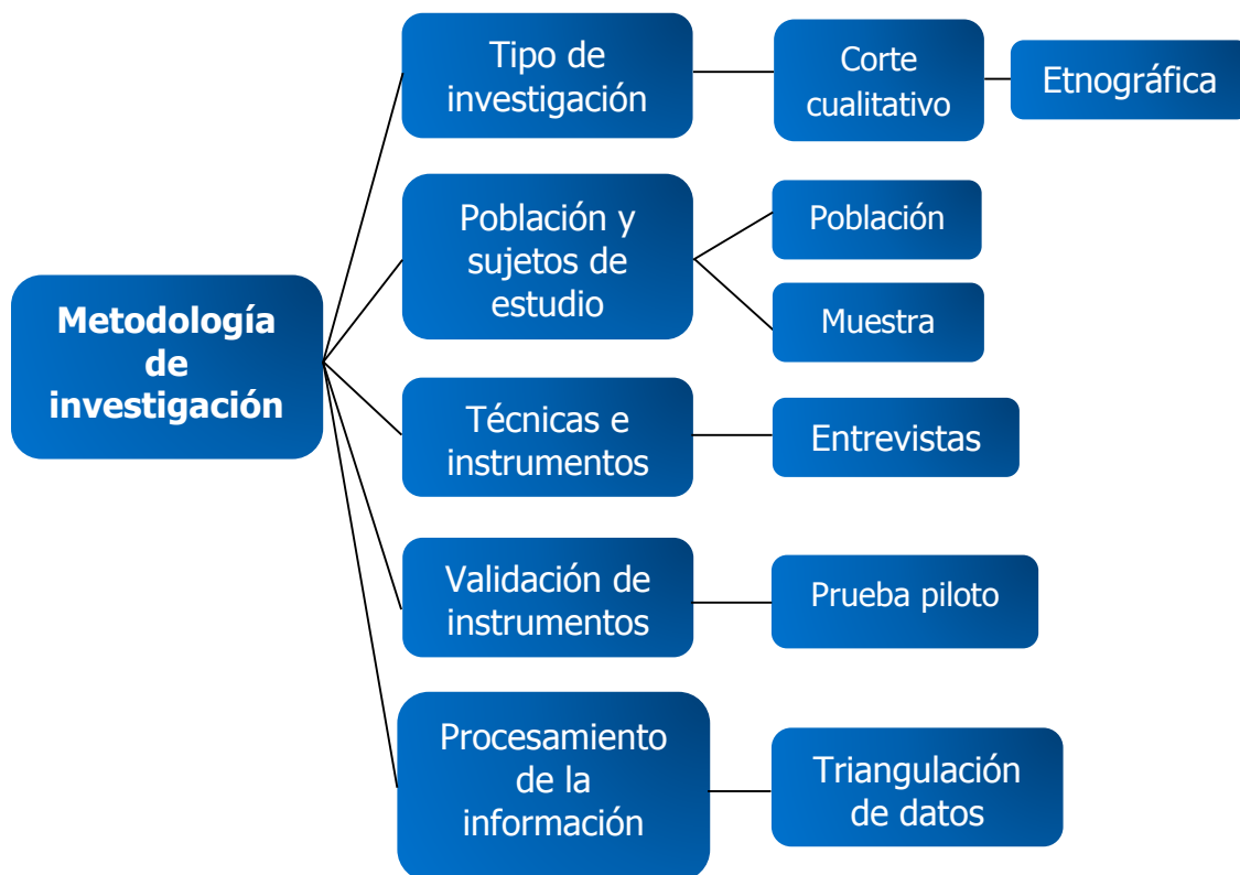
Figura 3. Metodología de la investigación

En este sentido, el siguiente esquema representa la estructura del capítulo: