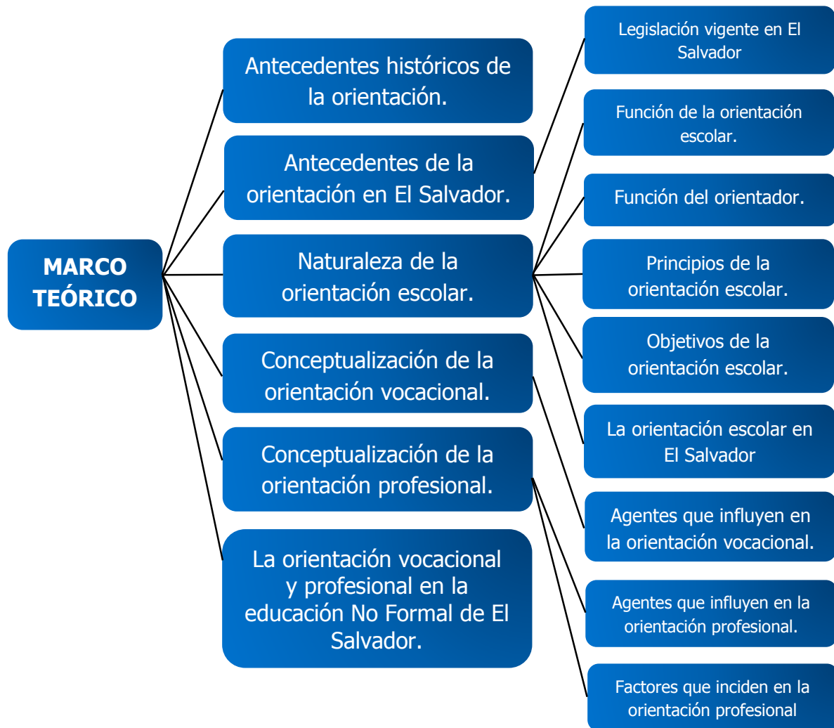
Figura 2. Estructura del marco teórico

Para el abordaje de este capítulo se detallan diversos aspectos que enriquecen la investigación; este está estructurado por diferentes subtemas que se desarrollarán a fin de sustentar el marco teórico y así destacar la importancia de la investigación. De esta manera, el presente capítulo está formado por las siguientes partes: