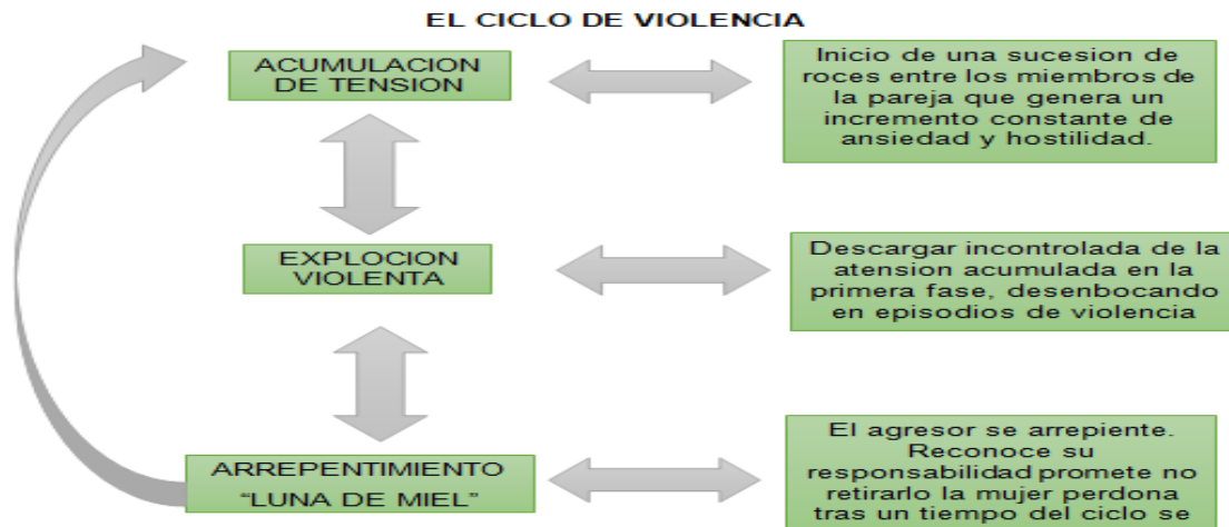
Imagen n° 2. Esquema de ciclo de violencia

Fuente: Esquema del ciclo de violencia retomado de violencia intrafamiliar abordaje integral a las víctimas, Núñez de Arco & Carvajal, 2004, pág.22.