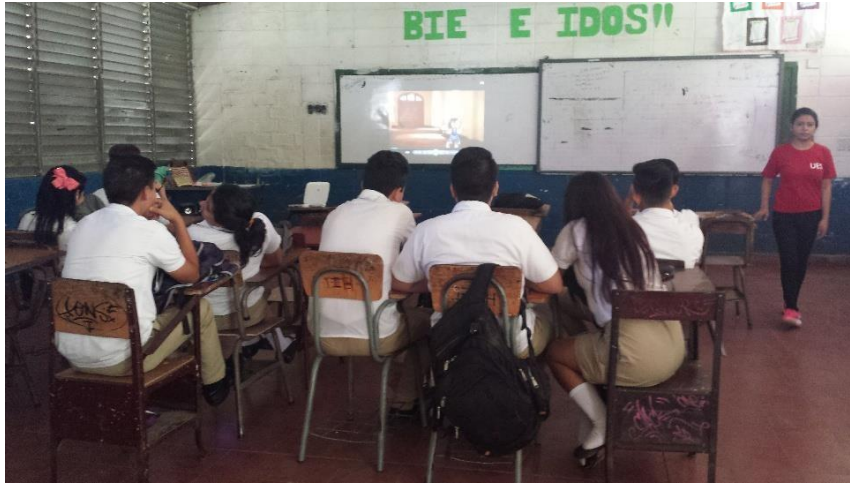
Foto 11: presentación de la dinámica vídeo fórum como actividad de inicio en el taller 4 “sensibilización social contra la violencia”.