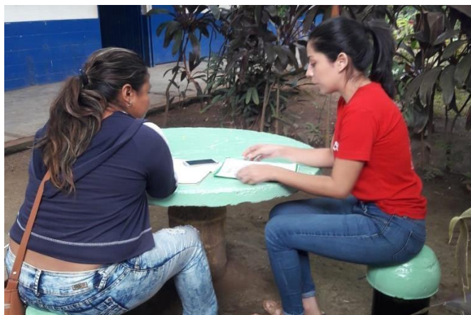
Foto 19: entrevista a una de las madres de familia de un estudiante de segundo año de bachillerato industrial del Centro Escolar INSA.