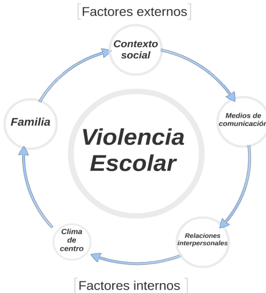
Ilustración 1 Causas y consecuencias de la violencia escolar