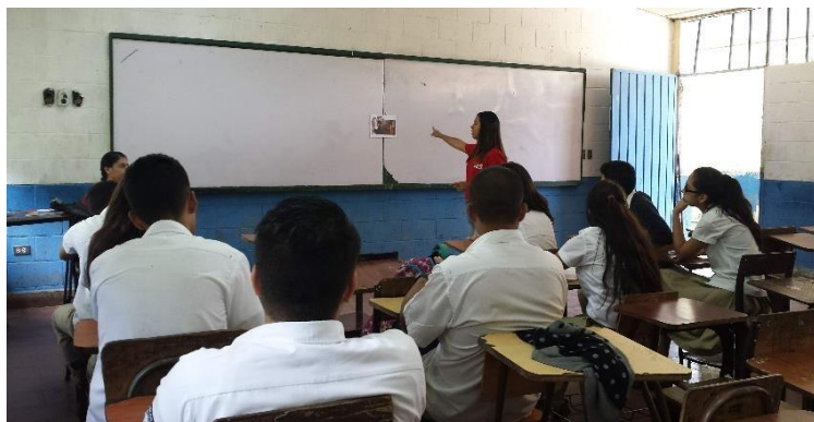
Foto: 10: refuerzo por parte de una investigadora en el taller 3 “aprendizaje social de la violencia según Bandura”.