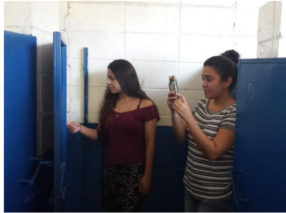
Foto 4 y 5: las investigadoras observaron mensajes violentos, escritos en paredes y puertas de los sanitarios.