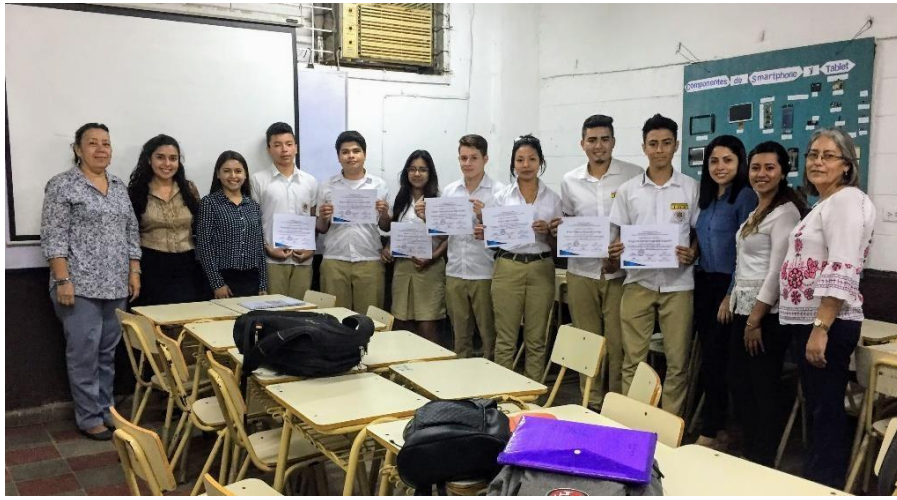
Foto 14: culminación de las jornadas de los talleres y entrega de diplomas a los participantes.