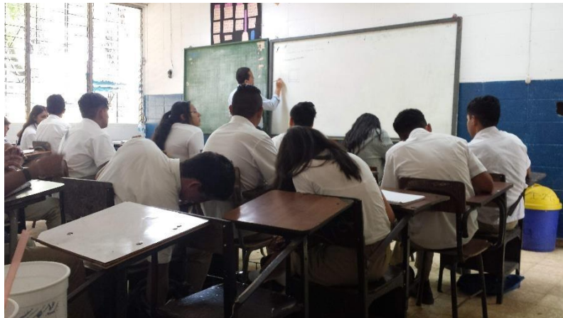
Foto 7: durante el desarrollo de una clase de la asignatura de ciencias, dos investigadoras estuvieron presentes para observar el rol del docente en cuanto al comportamiento de los estudiantes.