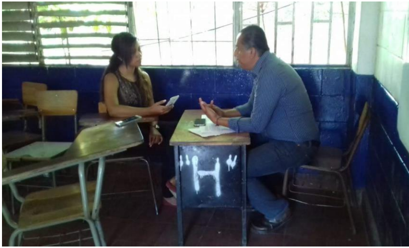
Foto 17: entrevista a uno de los docentes de segundo año de bachillerato industrial del Centro Escolar INSA.