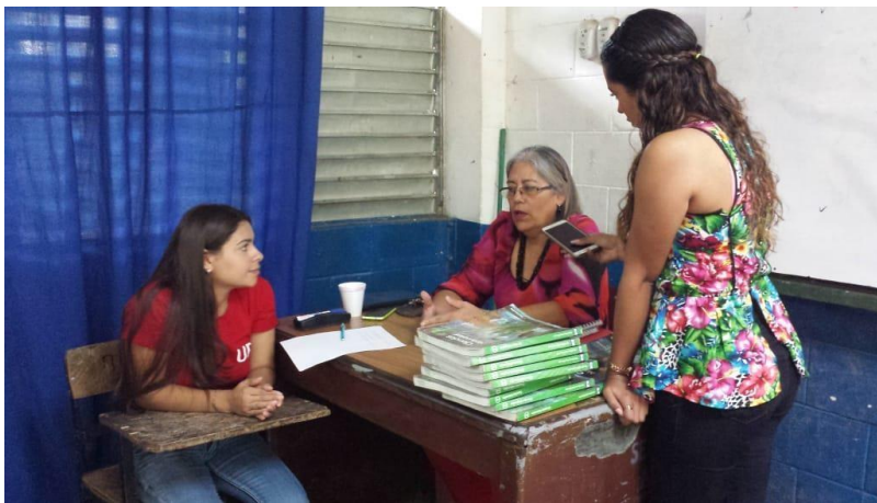
Foto 18: entrevista a una de las docentes de segundo año de bachillerato industrial del Centro Escolar INSA.