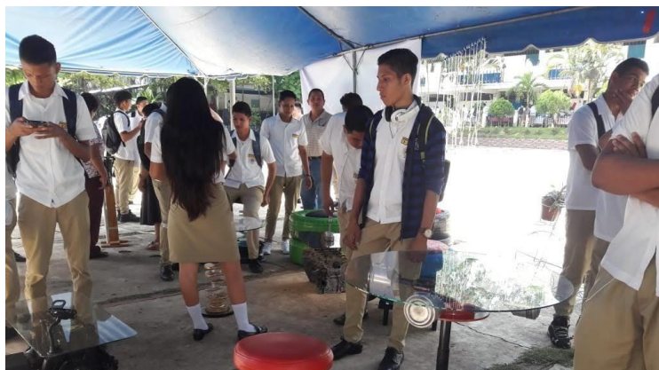
Foto 3: presentación de proyectos por parte de los estudiantes en la feria técnicotecnológico.