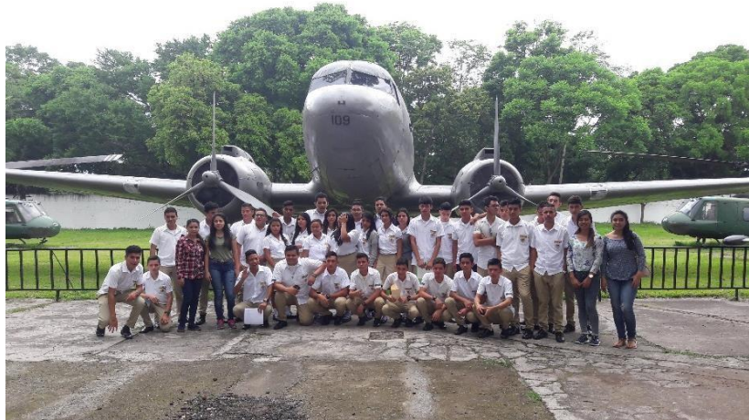
Foto 2: los estudiantes, el orientador de la sección "G" de segundo año de bachillerato industrial junto a las investigadoras, asistieron al museo militar cuartel el zapote y al ferrocarril.