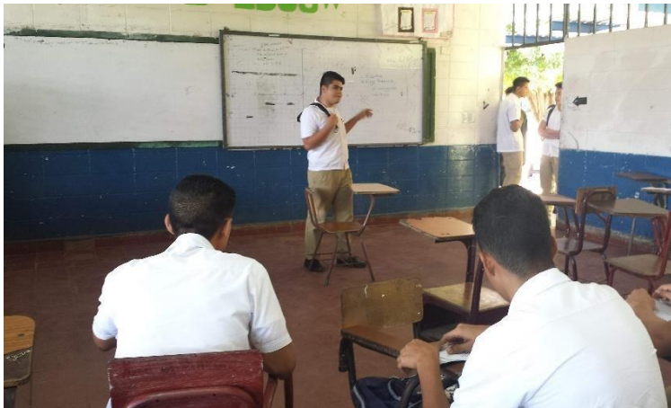
Foto 9: la dinámica juego de roles se realizó en el taller 2 “las instituciones y las organizaciones en la prevención de la violencia escolar”.