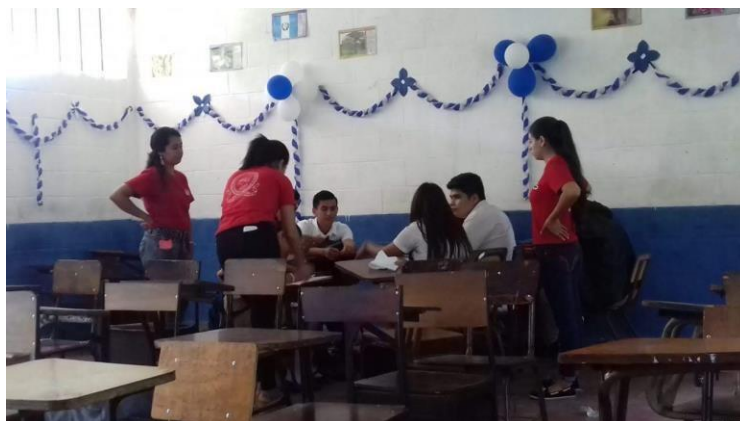
Foto 13: la elaboración de una propuesta colectiva para prevenir situaciones violentas corresponde al taller 6 “Propuesta colectiva para la prevención de la violencia escolar”.