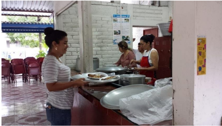
Foto 1: celebración a las docentes por el día de las madres, con el apoyo de las investigadoras a la organización del evento.