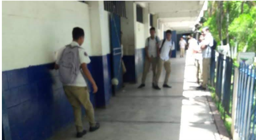
Foto 6: una de las investigadoras observó a tres estudiantes jugando con una pelota en el pasillo frente al aula del 2° "H" ITSI, irrespetando el normativo de convivencia institucional.