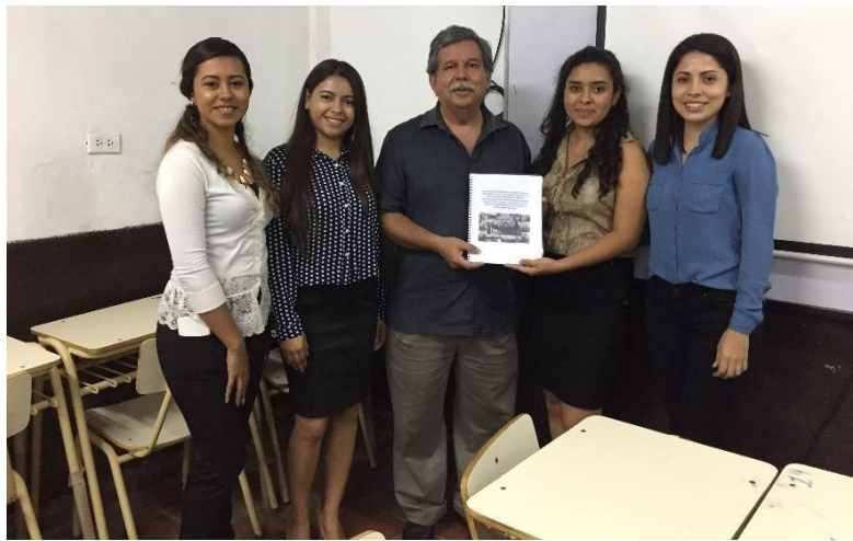
Foto 15: devolución del plan de ejecución de talleres para la prevención de la violencia escolar al subdirector del Centro Escolar INSA.