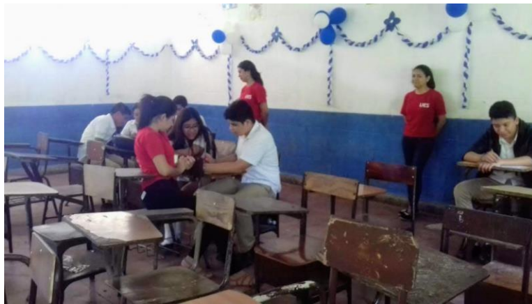
Foto 12: ejecución de la actividad de desarrollo denominada mecanismos de prevención en el taller 5 “mecanismos para la prevención de la violencia”.