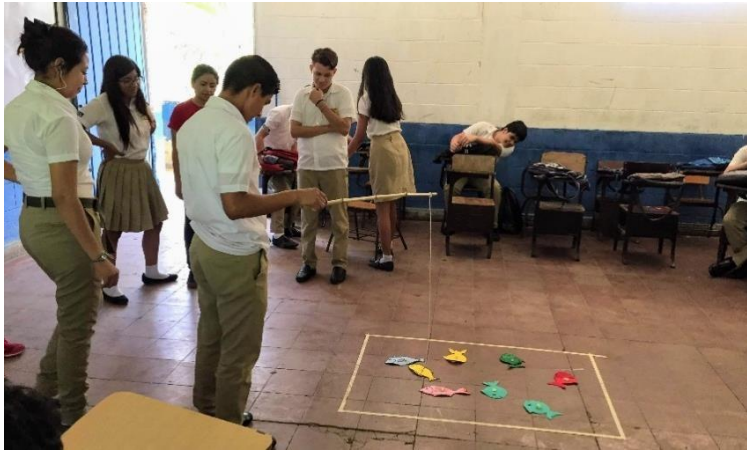
Foto 8: la dinámica pecera educativa se realizó en el taller 1 “introducción a la conceptualización de la violencia”.