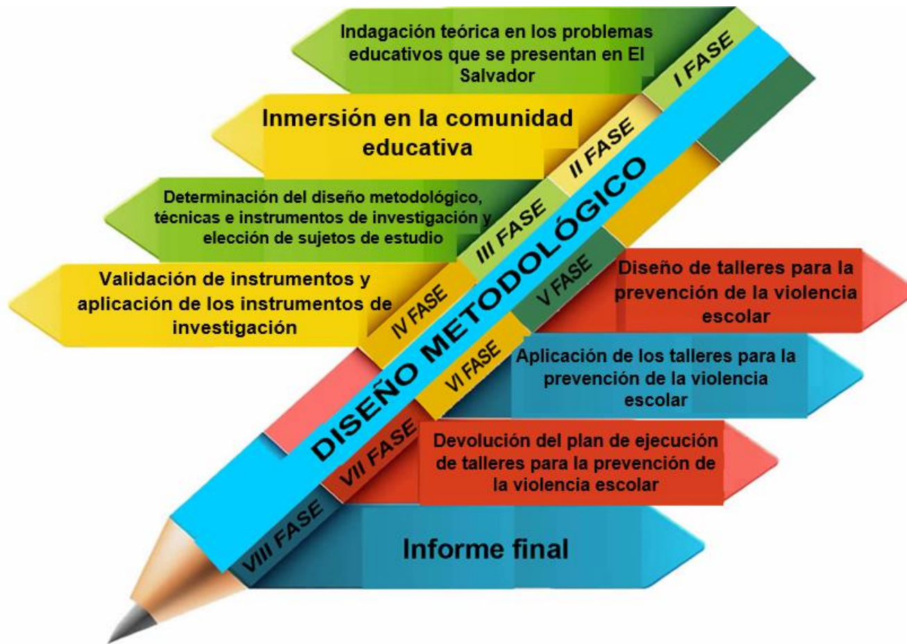
Ilustración 2 Diseño metodológico.