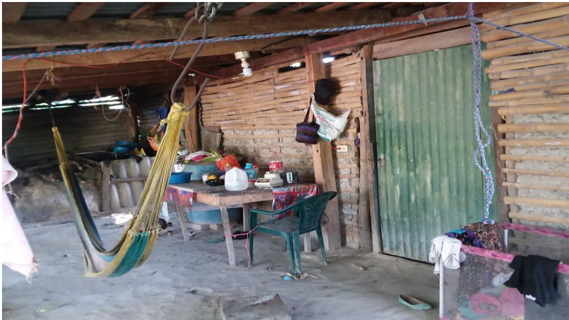
Fuente tomada de Vivienda de Cantón San José La Baza, Tapalhuaca, La Paz, jueves 22 de agosto 2019