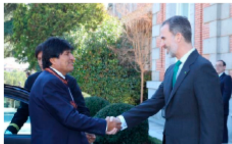
S.M. el rey Felipe VI recibe el saludo de su excelencia el presidente del Estado Plurinacional de Bolivia, Sr. Evo Morales Ayma, a su llegada al Palacio de La Zarzuela Madrid, 16.03.2018.

Los principales sectores de destino de la Inversión española son: el energético, el químico, el financiero y el editorial. Las principales empresas españolas en estos ámbitos son Repsol-YPF, MAXAM, BBVA y Santillana.