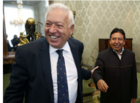
El anterior ministro de Asuntos Exteriores y de Cooperación junto a su anterior homólogo boliviano, David Choquetuasca, durante su visita a Madrid en enero de 2015.