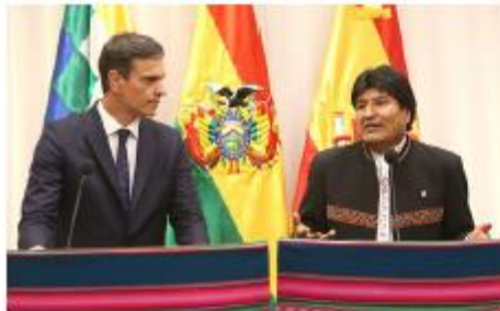
El presidente de España, Pedro Sánchez y de Bolivia, Evo Morales, durante sendas intervenciones, en el transcurso de la visita oficial de Sánchez a Bolivia. Bolivia.-29/08/2018.