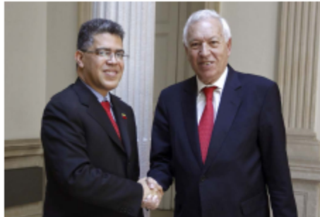
El anterior Ministro de Asuntos Exteriores y Cooperación, José Manuel García-Margallo, junto al ex ministro de Asuntos Exteriores de Venezuela, Elías José Méndez, durante una visita realizada a Madrid en junio de 2012 © FOTO EFE.

El 2 de diciembre de 2007, Hugo Chávez sometió a referéndum un proyecto de