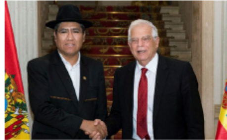
El ministro español de Asuntos Exteriores, Unión Europea y Cooperación, Josep Borrell junto a su homólogo boliviano Diego Pary. Madrid.- mayo de 2019

En 2014: visitó en varias ocasiones España el procurador general del Estado