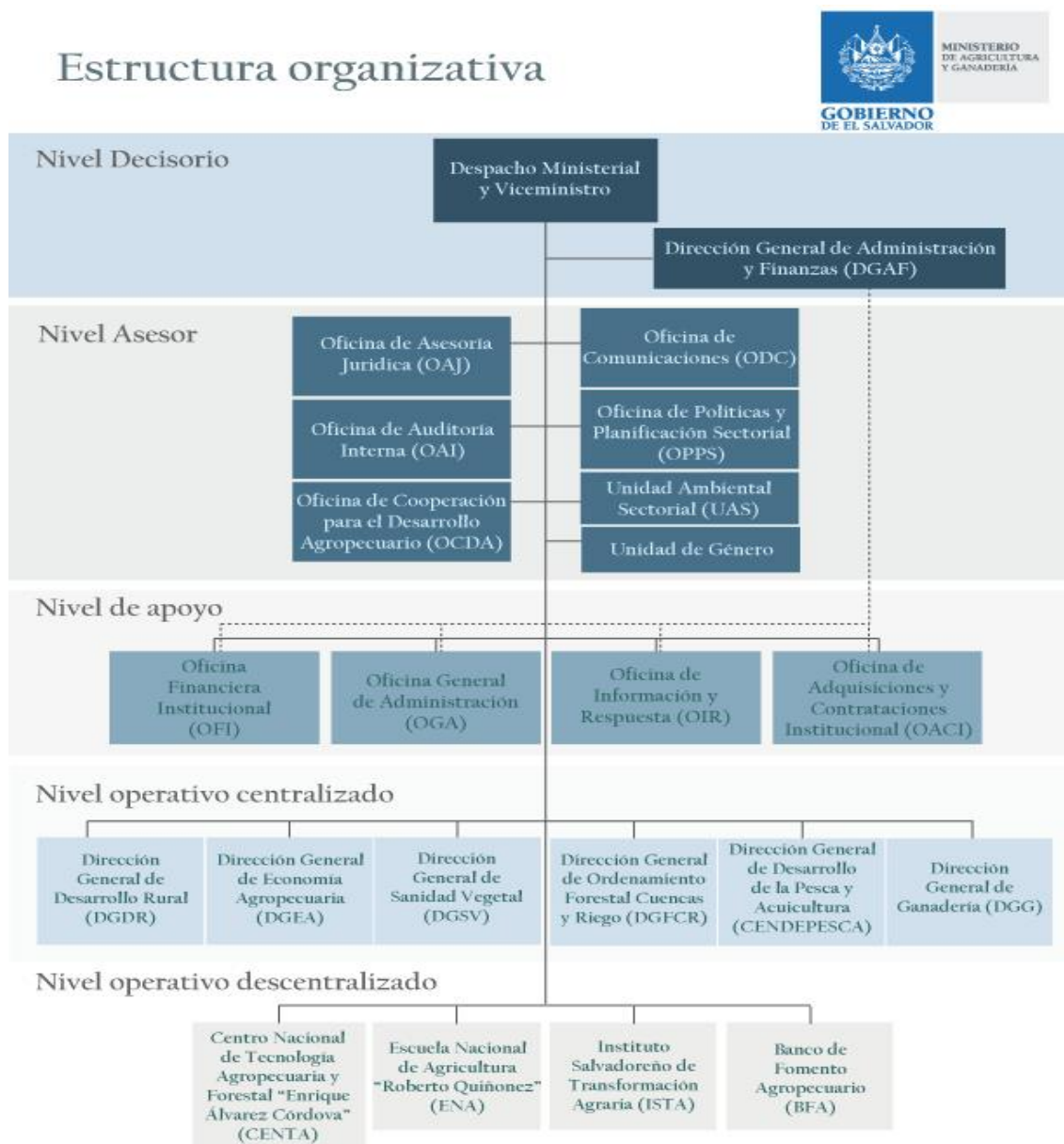
Figura 3: Estructura organizativa del Ministerio de Agricultura y Ganadería

Fuente: Ministerio de agricultura y ganadería 85