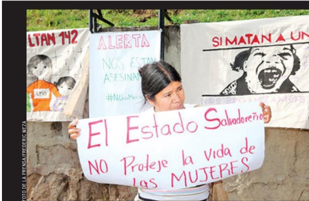
PROTECCIÓN. LAS MUJERES EXIGEN QUE EL ESTADO DÉ GARANTÍAS Y PROTEJA LOS DERECHOS HUMANOS DE LAS MUJERES.