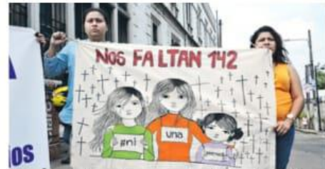
Mujeres organizadas marcharon ayer para demandar seguridad, justicia y pronunciarse por los recientes casos de feminicidio.

La Organización de las Naciones Unidas sugirió al Estado salvadoreño frenar la situación de violencia contra mujeres, quienes en muchos casos son víctimas de sus parejas.