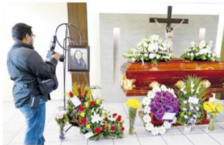
Familiares, amigos, colegas y compañeros de trabajo han acudido a la funeraria para expresar sus condolencias a la familia.