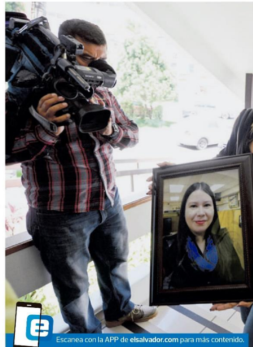
Escanea con la APP de elsalvador.com para más contenido.

● Según la Policía, citatorio para que el cónyuge fuera al Ministerio Público a ampliar su declaración preliminar, le fue notificado cuando estaba en velorio de Turcios. También fue citado el padre de la víctima.