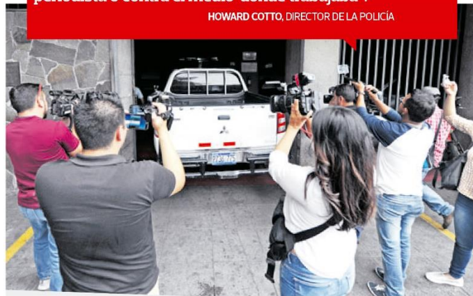
Personal de la Fiscalía arriba a Medicina Legal de Santa Ana, con el esposo de la periodista.