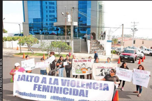
ALTO A LOS FEMINICIDIOS. LAS MUJERES QUE PARTICIPARON EN LA PROTESTA SE INSTALARON FRENTE A LA FISCALÍA PARA EXIGIR QUE ESCLAREZCA TODOS LOS CASOS.