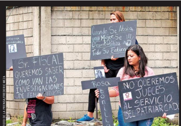
INVESTIGACIONES. MUJERES EXIGEN QUE AVANCEN LAS INVESTIGACIONES DE TODOS LOS CASOS DE VIOLENCIA DE GÉNERO, Y QUE NO HAYA IMPUNIDAD.