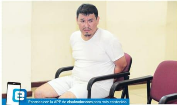
Mario Huezo, según la Fiscalía, asesinó a la periodista Karla Turcios por factores que apuntan a la misoginia. Las investigaciones indican que la víctima enfrentó un ciclo de violencia económica.