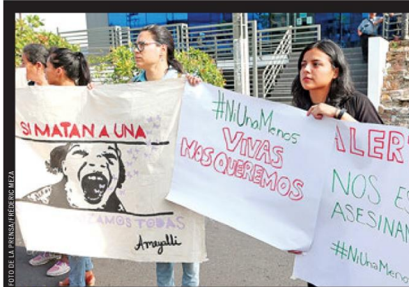
LLAMADO. VARIAS MUJERES PARTICIPARON AYER EN UNA CONCENTRACIÓN PARA PROTESTAR POR EL INCREMENTO DE FEMINICIDIOS.