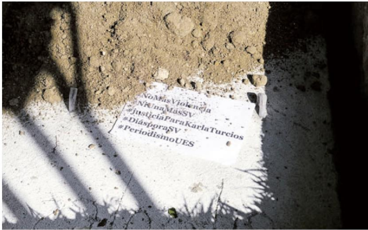
El asesinato de la periodista Karla Turcios no solo ha despertado la condena y repudio generalizado del gremio nacional de comunicadores, sino también de periodistas salvadoreños en el exterior.