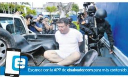
Fiscales del caso aseguran tener suficientes evidencias que incriminan al principal sospechoso del feminicidio de Turcios.

Agregó que tras analizar los teléfonos de ambos, se evidencia una relación difícil, con serios problemas de violencia económica. El Fiscal General tildó de "mantenido" al presunto asesino, tras su captura. Por su parte, el imputado fue llevado al tribunal bajo fuertes medidas de seguridad, donde se le notificó la acusación que pesa sobre él. El sujeto insiste que es inocente, "que él amaba, ama y seguiré amando a Karla".