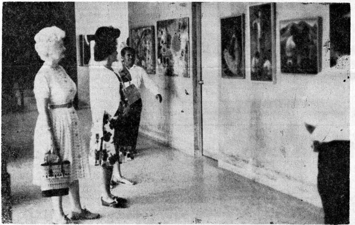
VISITAN EXPOSICION PICTORICA. —Numerosas personas estuvieron visitando la Ciudad Universitaria para apreciar las diversas obras de pintores nacionales que expusieron sus cuadros en el edificio de la Rectoría, con motivo del Primer Festival del Arte y la Cultura que se efectuó del 23 de febrero al primero de marzo.