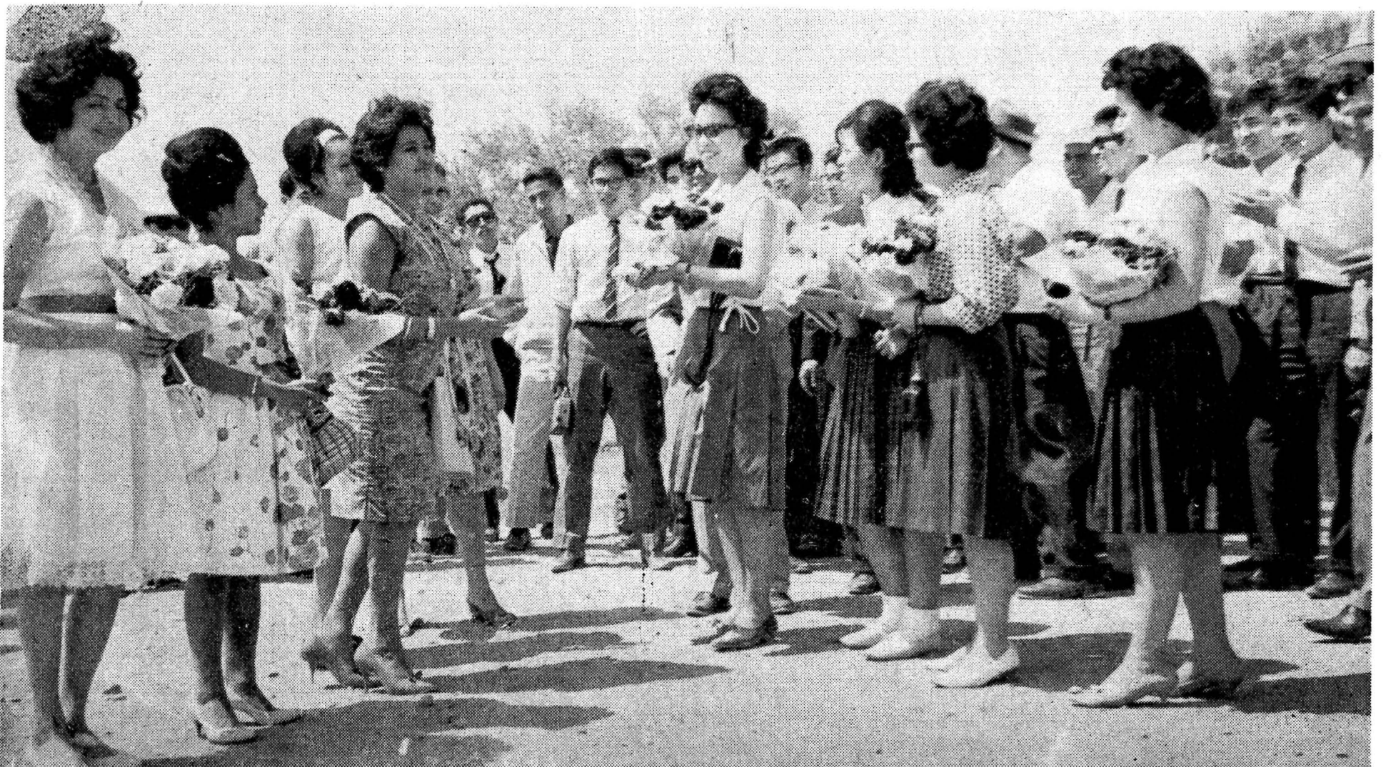
CONFRATERNIDAD UNIVERSITARIA.—La misión universitaria japonesa, integrada por ciento cincuenta alumnos, jefes de misión y catedráticos de la Universidad de Keio, visitaron durante varios días nuestro país en donde conocieron centros de cultura y lugares de recreo. La Universidad de El Salvador e instituciones particulares atendieron cordialmente a los estudiantes japoneses, quienes hace algunos días partieron con destino a México y los Estados Unidos. En la fotografía se aprecia el instante en que estudiantes japoneses y salvadoreños intercambian saludos en la frontera de El Salvador y Guatemala.

SEGUNDA CAMPAÑA PRO CIUDAD UNIVERSITARIA