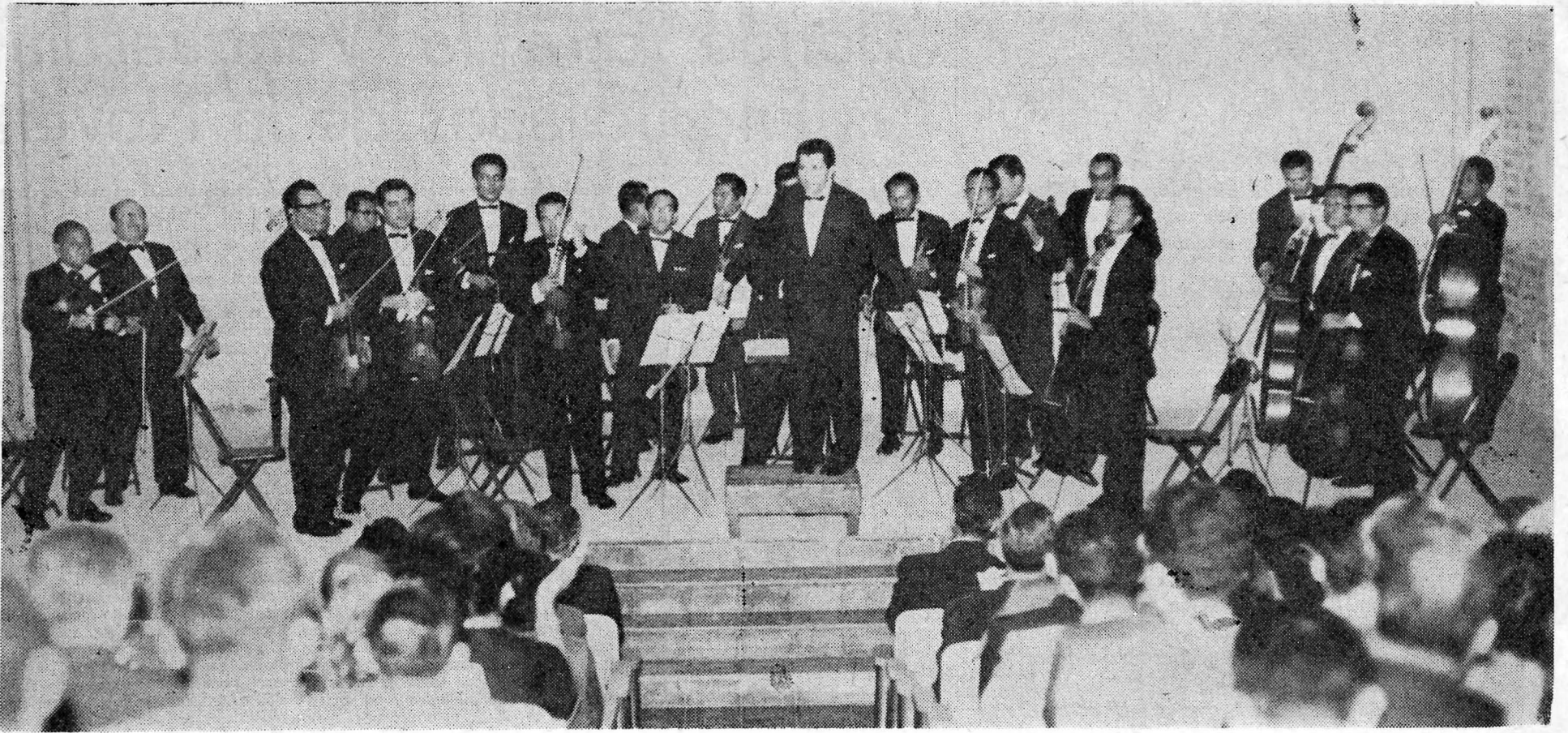
CONCIERTO DE LA SINFONICA DE EL SALVADOR. —Durante el Primer Festival del Arte y la Cultura, auspiciado por el Departamento de Extensión Cultural de nuestra Universidad, se desarrollaron varios actos que por su contenido despertaron interés general. Uno de ellos fue la participación de un conjunto de cámara, integrado por profesores de la Orquesta Sinfónica, quienes interpretaron la obra de Vivaldi, "Las Cuatro Estaciones". Numeroso público asistió a dicho concierto que se ofreció en el Paraninfo del nuevo edificio de la Rectoría.