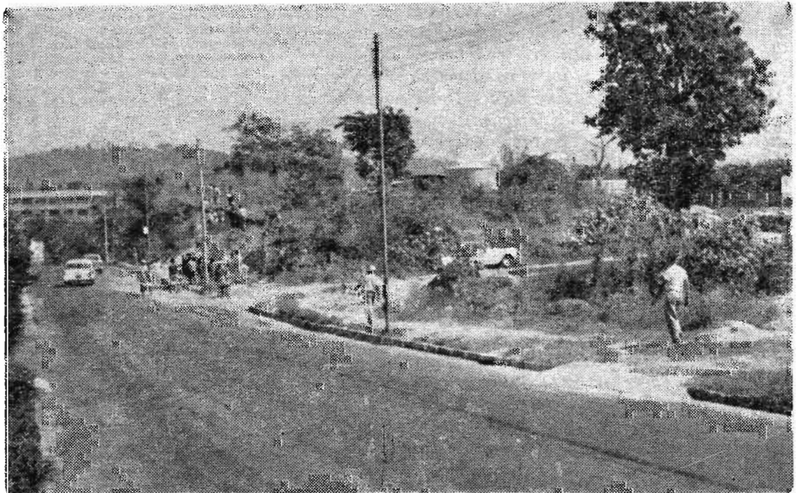
TRABAJOS VOLUNTARIOS. —Con todo entusiasmo continúan realizándose, domingo a domingo, los trabajos voluntarios pro construcción de la Ciudad Universitaria en cuya labor participan estudiantes, profesionales, obreros y mujeres. Esta fotografía corresponde a la zona noroeste de la Ciudad Universitaria, en donde se trabaja en terracería, encunetado, etc.