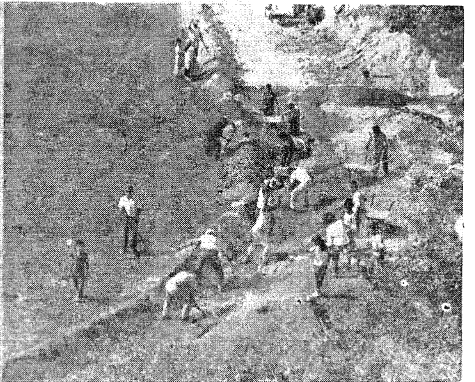
TRABAJOS EN EL ESTADIO UNIVERSITARIO. —Grupos de trabajadores voluntarios han iniciado sus labores dominicales en pro de la construcción del futuro Estadio Universitario. Aquí podemos apreciar a varias personas trabajando entusiastamente en esta importante obra que impulsará el deporte dentro de la Universidad.—(Foto de Estela de Guerra).