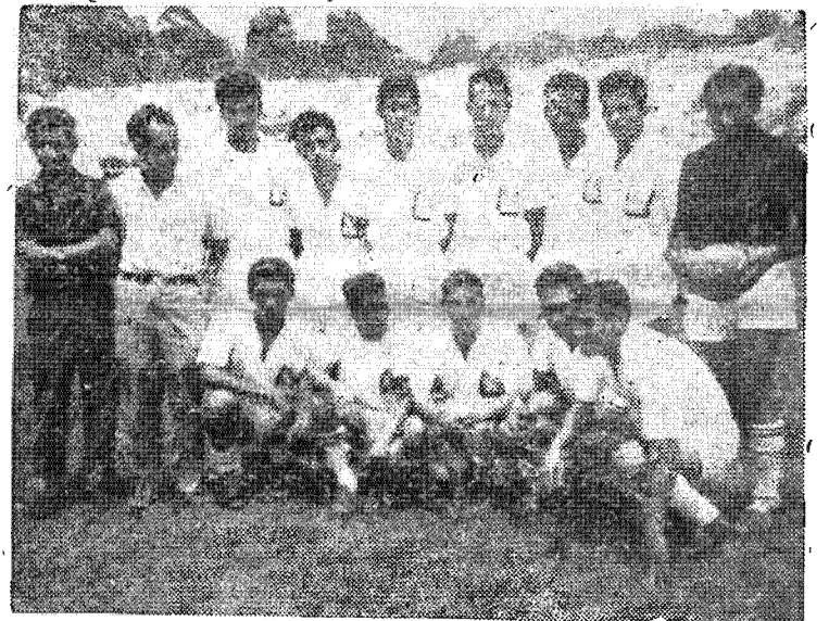
NUEVO CONJUNTO DEPORTIVO. —Entusiastas empleados de nuestro máximo Centro de Estudios fundaron recientemente la oncená futbolera Deportivo Empleados Universitarios Salvadoreños —DEUS—. Los muchachos del DEUS se están sometiendo a un riguroso entrenamiento y están dispuestos a ofrecer dura batalla.