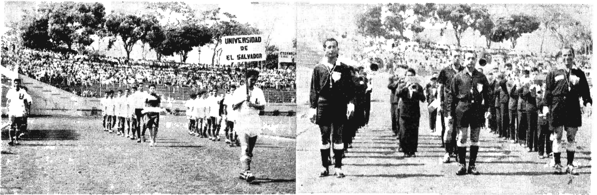
Los integrantes de la Oncena Futbolera que defendiera los colores de El Salvador, en los momentos de su desfile en la grama del Coso Olímpico, cuando se prestaba a su presentación en los actos de inauguración. En la siguiente gráfica puede apreciarse el desfile de los componentes del cuerpo de árbitros que participaron en los distintos encuentros del II Campeonato Universitario de Fútbol Centroamericano y Panamá.