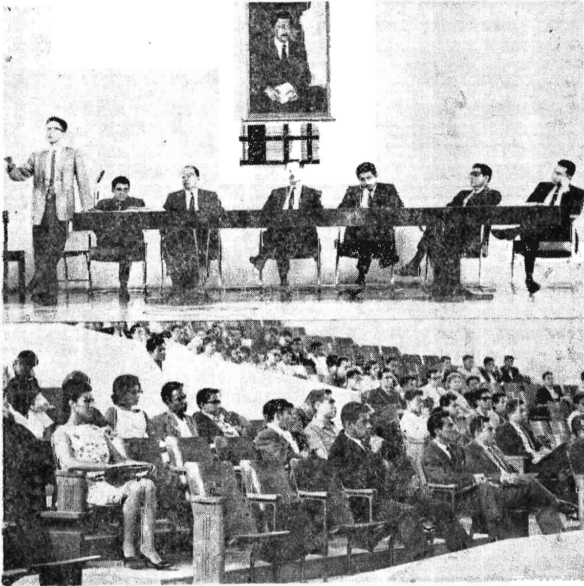
PANEL INFORMATIVO.—En el auditorium de la Facultad de Derecho, se celebró una Asamblea Universitaria, convocada por la Junta Directiva y el Decanato para considerar el plan de reformas en la Facultad de Derecho. La gráfica recoge dos aspectos de dicha asamblea.

Sobre este último y otros problemas particulares, en breve se ofrecerá mayor información.