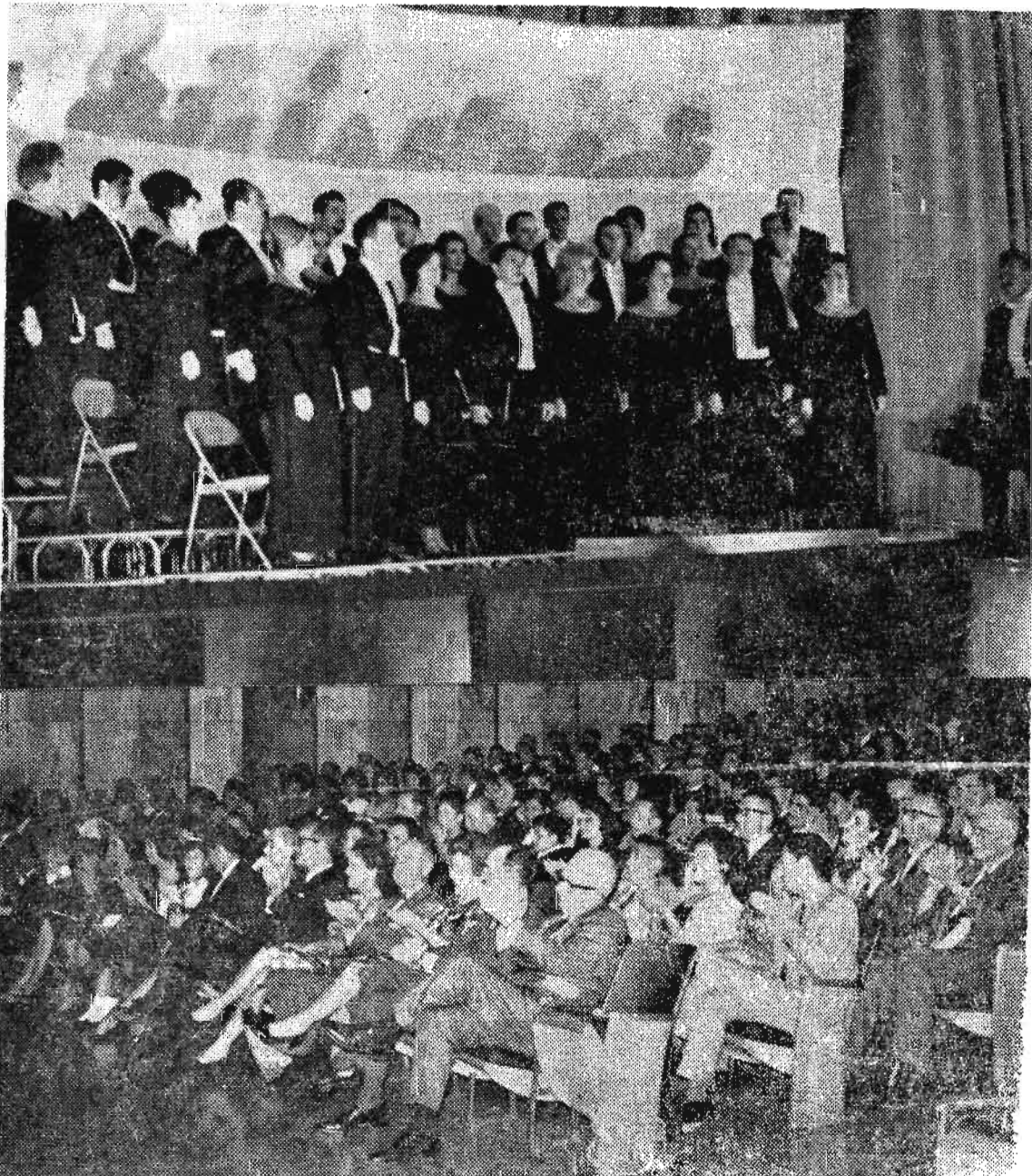
CORO ROGER WAGNER.—Dos aspectos de la actuación del coro Wagner, en el Cine Darío. La mayor parte de los estudiantes universitarios asistieron a las dos funciones que ofreció el conjunto coral norteamericano.