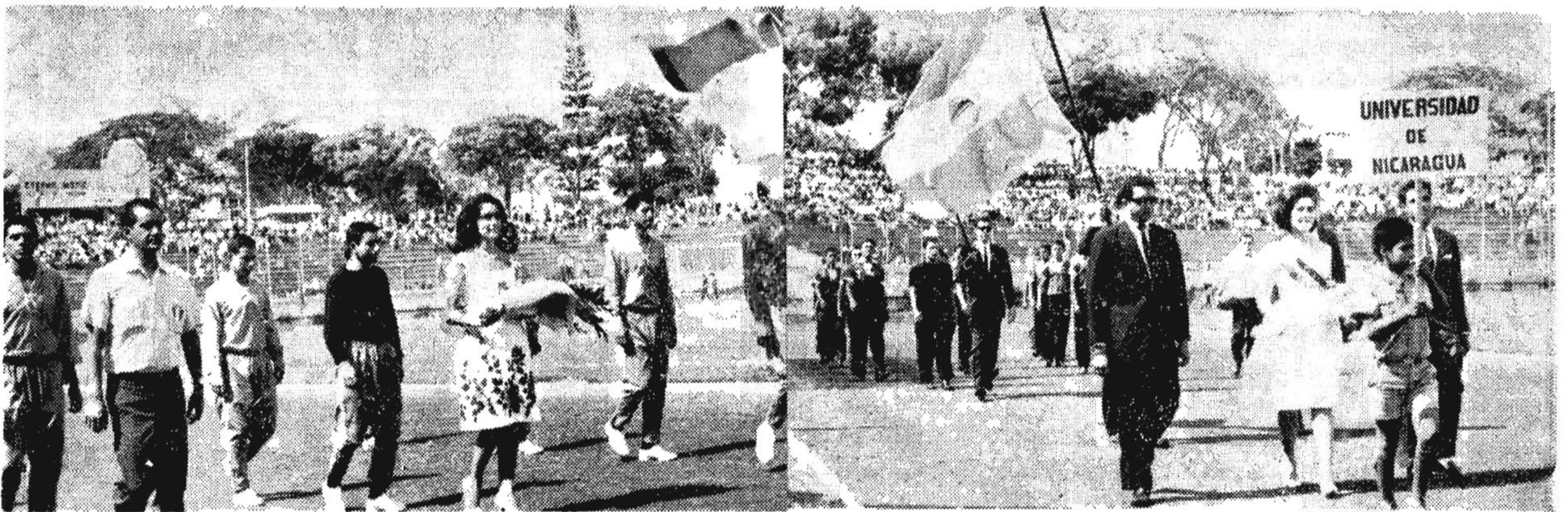
Otro aspecto captado por la cámara en el desarrollo del acto inaugural del II Campeonato de Fútbol Centroamericano y Panamá. Ambas delegaciones vienen acompañadas de sus respectivas madrinas.