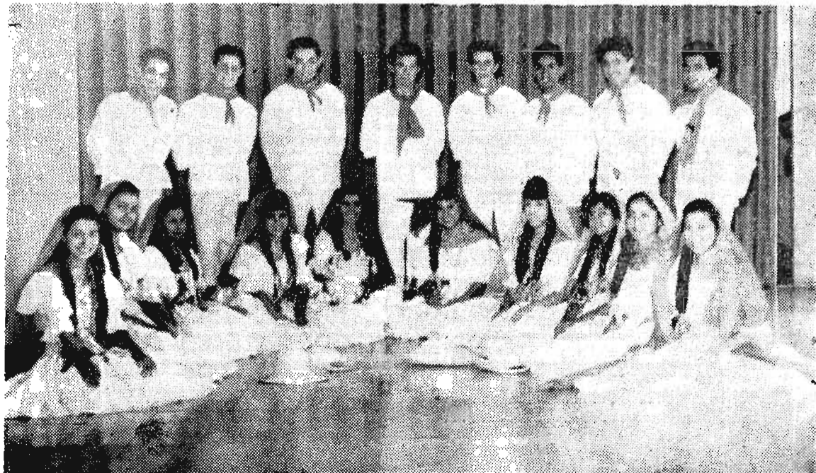
CONJUNTO DE DANZA FOLKLORICA DE LA UNIVERSIDAD, que actuó con motivo de la toma de posesión de la Junta Directiva de la sociedad "Amigos de la Universidad" de Sonsonate.

INFORMES allí mismo o en Teléfono 35-47.