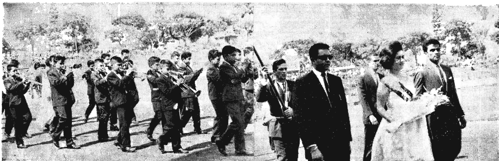
Los jovencitos de la Banda del Colegio Don Bosco, son captados por la cámara cuando desfilaban ingresando al Estadio Flor Blanca. En la siguiente gráfica, los muchachos de la delegación de la hermana República de Nicaragua, hacen su triunfal presentación con su respectiva Madrina.