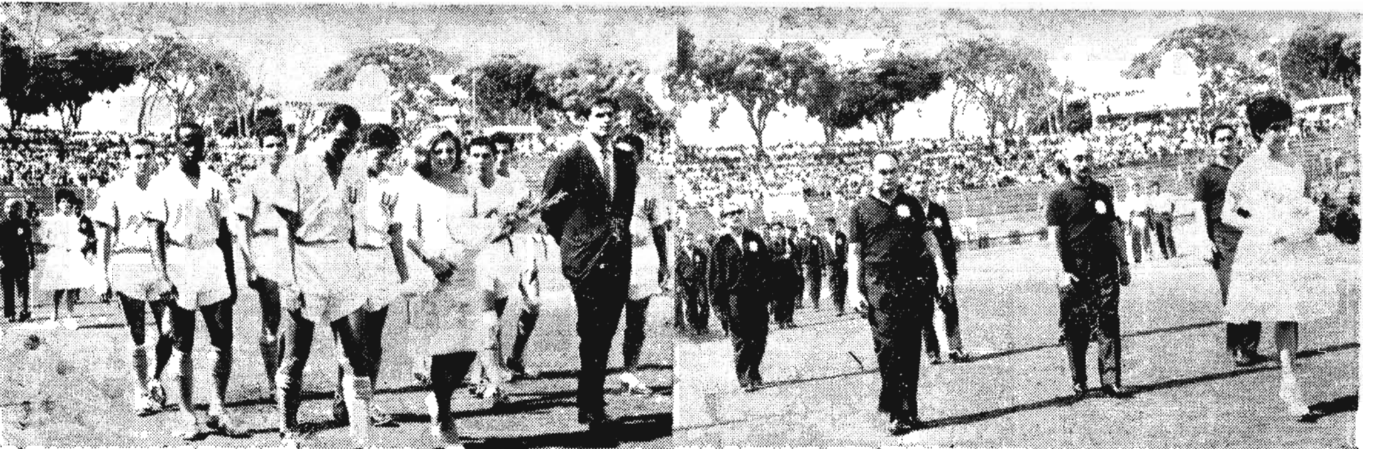
En la primera gráfica aparecen los integrantes del equipo universitario de la hermana República de Costa Rica, con su bella madrina. En la otra, aparecen los muchachos integrantes de la delegación de la hermana República de Guatemala, que obtuvo honroso lugar.