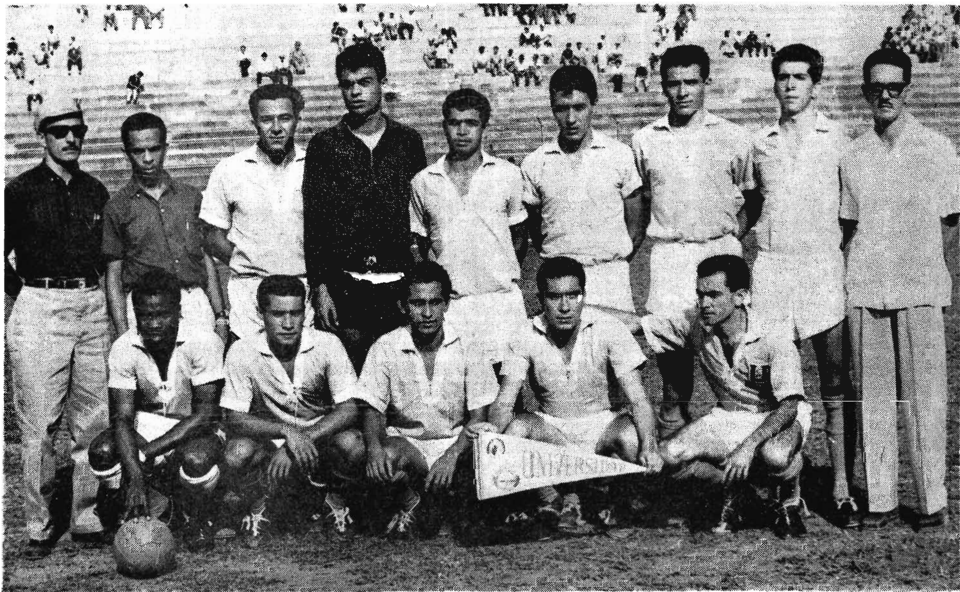
He aquí la victoriosa oncena de la hermana República de Costa Rica que logró obtener el título de Campeón, en el Segundo Torneo de Centro América y Panamá de Fútbol Universitario, efectuado del 3 al 10 de mayo en esta ciudad. EL UNIVERSITARIO expresa a los hermanos costarricenses su cordial felicitación.