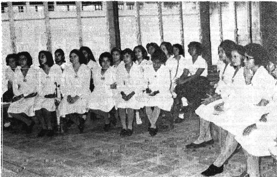
Alumnas de la Escuela Normal España asisten a una clase impartida en los laboratorios del Instituto Tropical de Investigaciones. Este es uno de los servicios prestados por la Universidad a los distintos sectores.

El otro resultado que ha dado qué hablar fue la aplastante derrota sufrida por el Campeón Aguila, quien cayó por 5 goles a 2 en su propia cancha ante el modesto Atlante; FAS, por su parte, sigue conquistando puntos que lo lleven a la conquista del título de este torneo, logrando vencer a 11 Municipal por dos goles a 0.