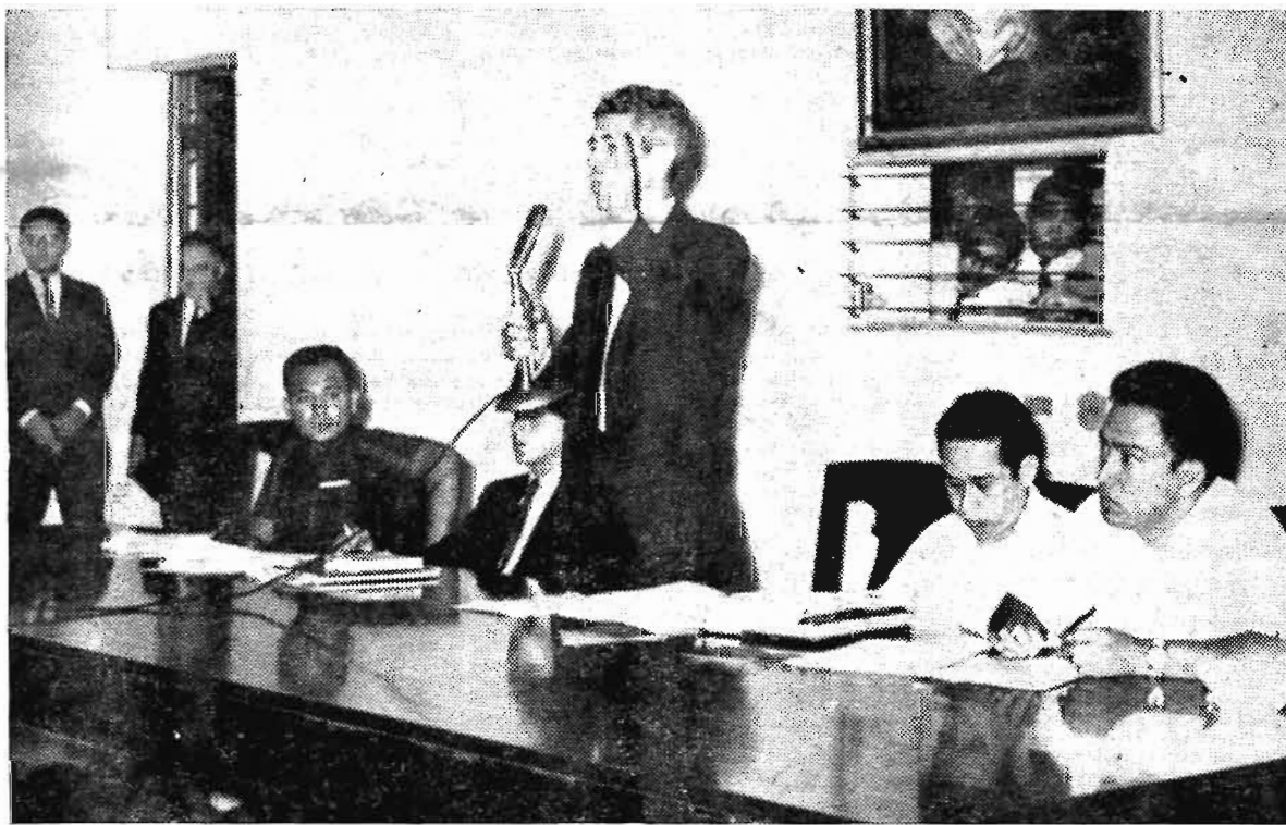
El Rector de la Universidad de El Salvador, Dr. Fabio Castillo Figueroa, da su informe durante la Asamblea General de Estudiantes Universitarios celebrada el pasado 11 de agosto.