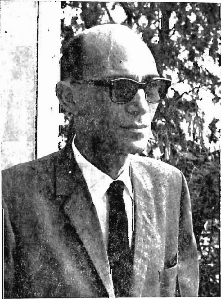
Dr. Mariano Fiallos Gil, vigoroso intelectual cuyo deceso ha sido una gran pérdida para la Patria Centroamericana.

La Universidad de El Salvador, en su camino de reforma, ha elaborado un Plan Quinquenal para 1965-1969 "cuyo principal objetivo es colocar a la Universidad, mediante un gran impulso inicial, en condiciones satisfactorias como institución de educación superior".