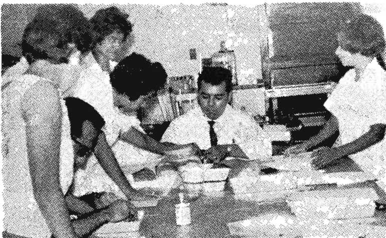
Personal del Departamento de Biología se dedica a preparar prácticas para la enseñanza de las ciencias biológicas en el mencionado Departamento.— (Foto de Ramírez Avelar).

Las personas interesadas deberán hacer sus ofertas en la Editorial Universitaria (5ª C. O. 220) el día y hora indicados.